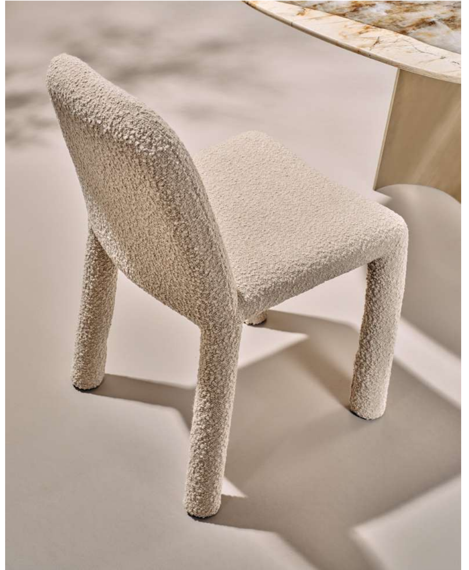
EN Origin Seating in bouclè B02 fabric.