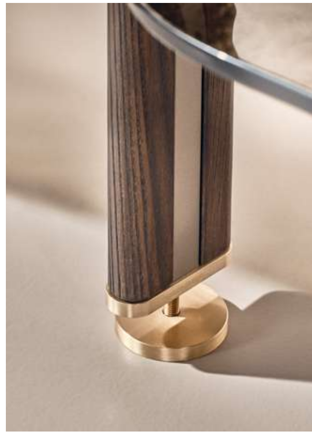
Stem Libreria con struttura in legno frassino moka e metallo champagne e ripiani in vetro cotto bronzo.