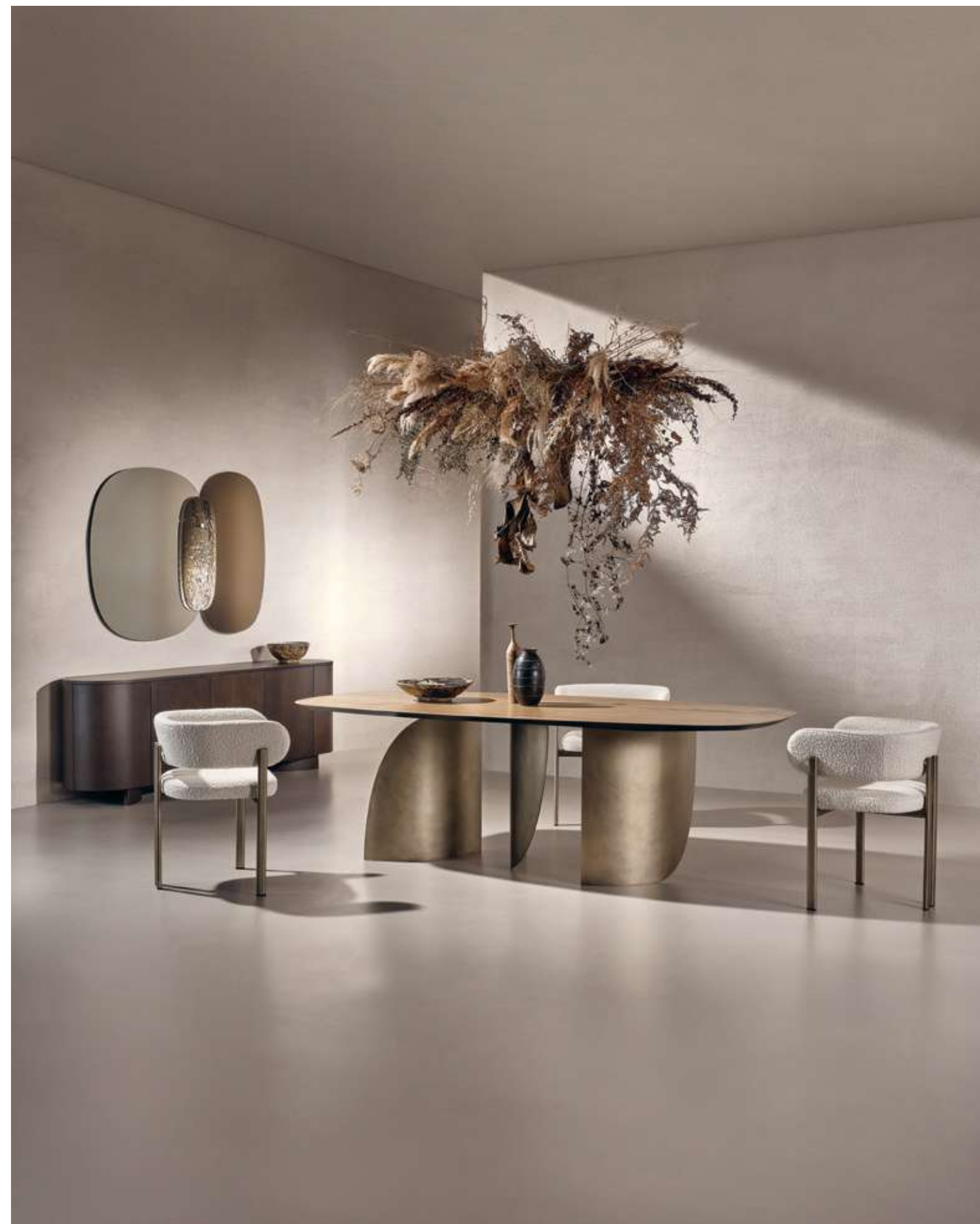
EN Sail Table with caramel ash wood top and luxor bronze metal base.