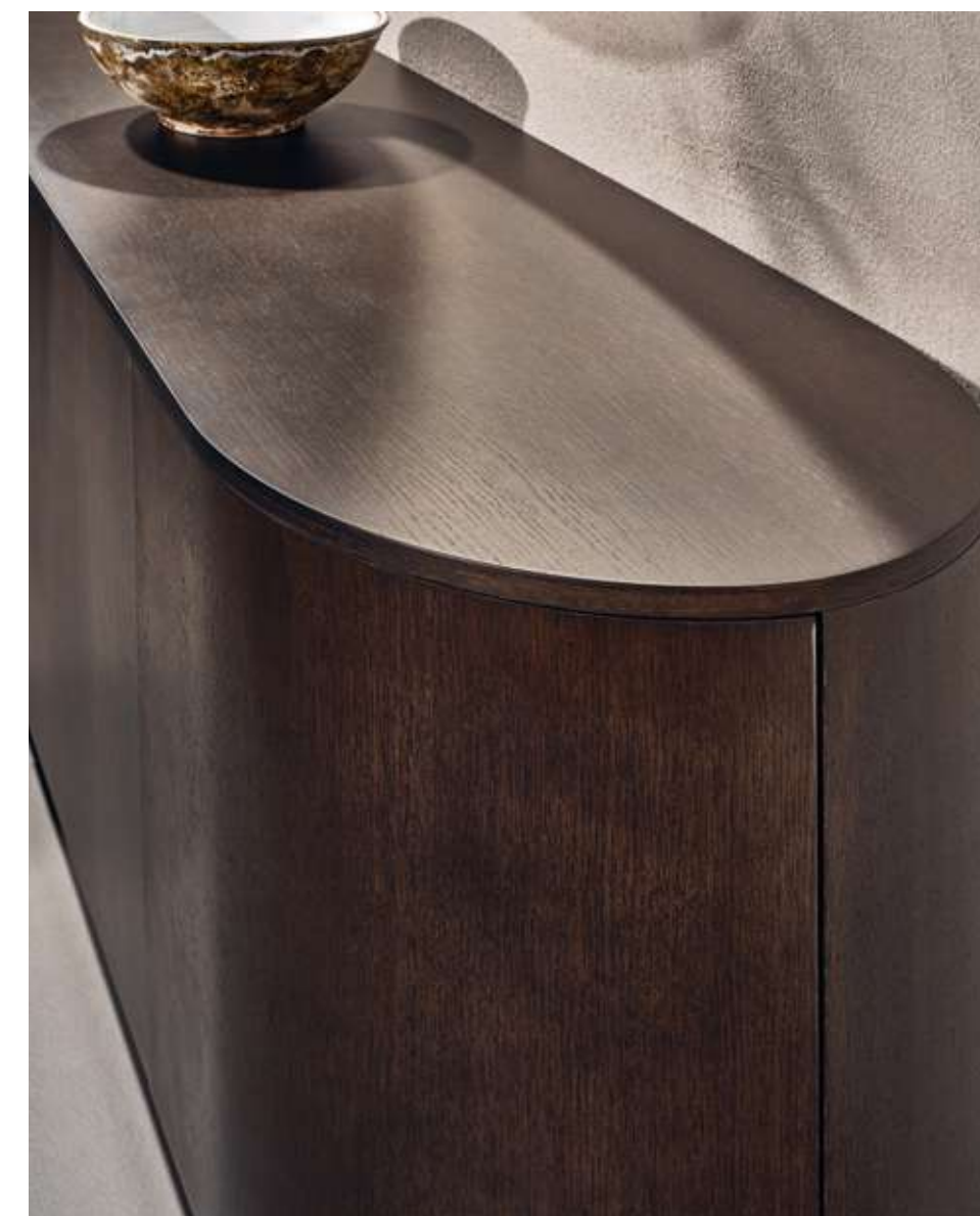
Flow Madia in legno frassino moka. Lagoon Complemento con specchio argento, specchio bronzo e vetro cotto bronzo.