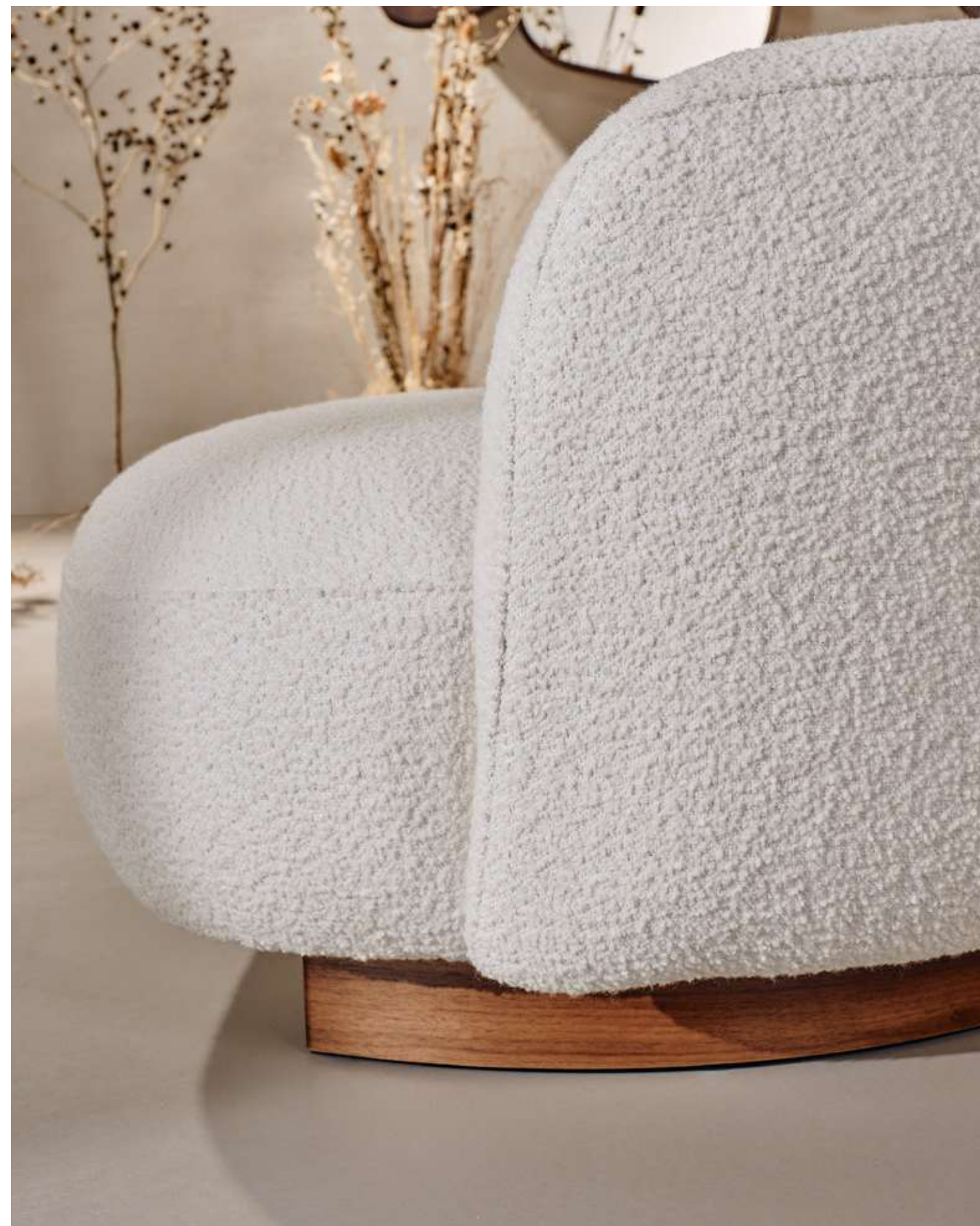
EN Pebble Lounge Armchair in bouclé B01 fabric and american walnut base.