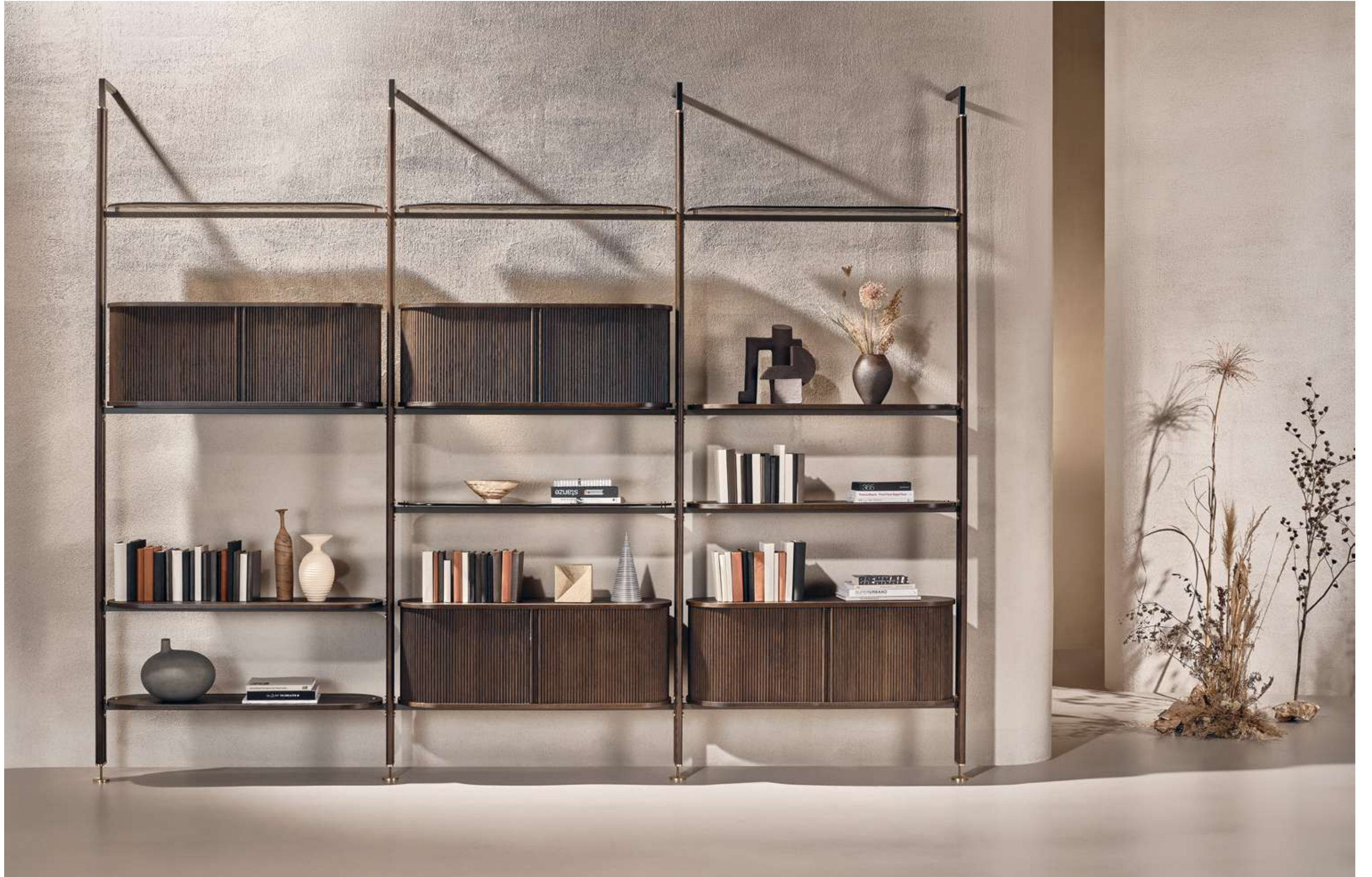
Stem Libreria, Bookshelf.