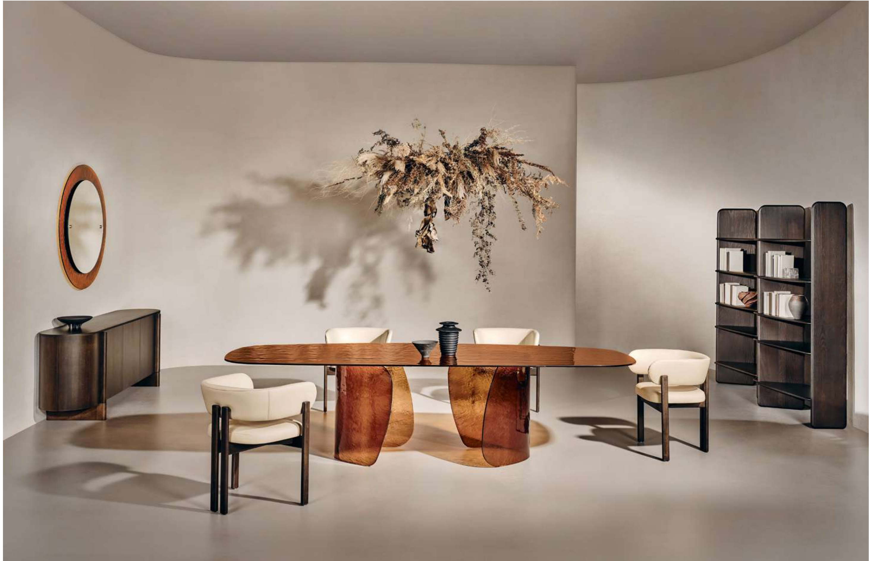
Blur Tavolo, Table ; Bay Wood Armchair Seduta, Seating ; Dusk Madia, Sideboard ; Eclipse Complemento, Complement ; Nook Libreria, Bookshelf .