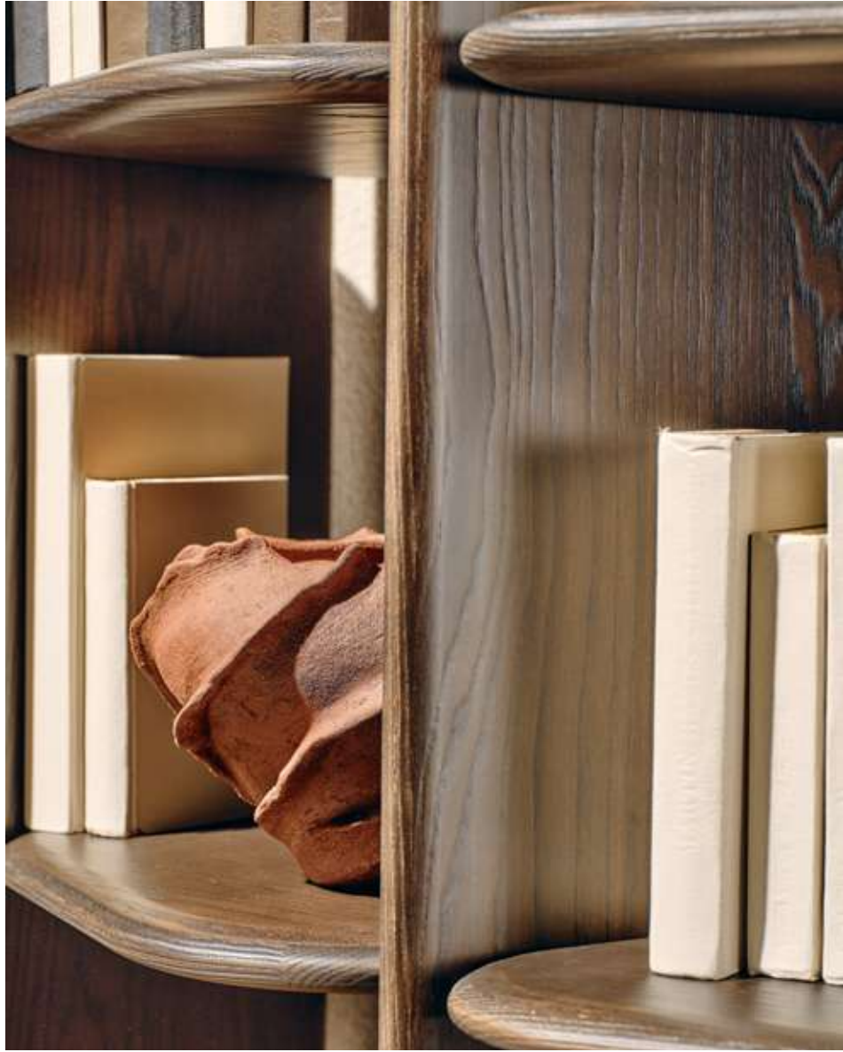
Nook Libreria in legno frassino moka.