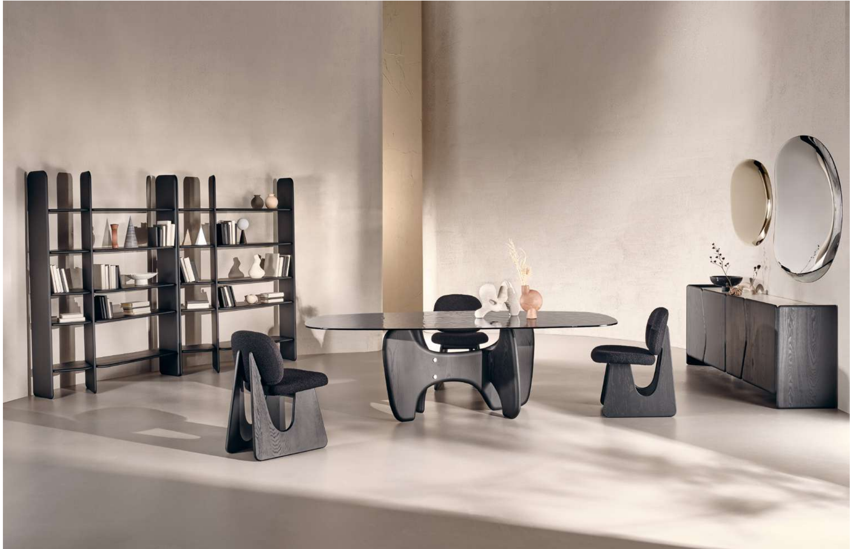
Tribe Tavolo, Table ; Twig Seduta, Seating ; Nook Libreria, Bookshelf ; Dolmen Madia, Sideboard ; Pangea Complemento, Complement .