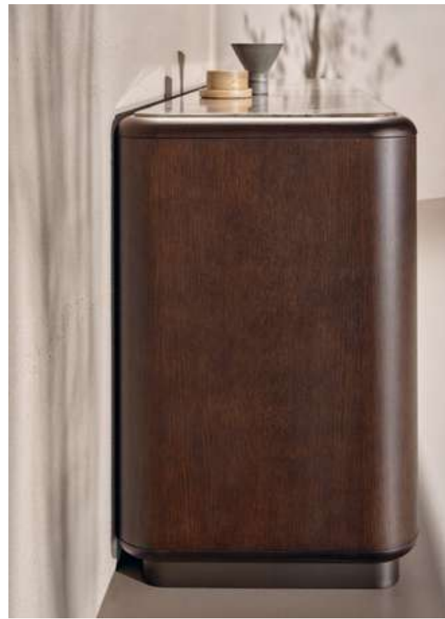
Pod Madia con struttura in legno frassino moka, top in marmo Camouflage e base in metallo brunito. Lagoon Complemento con specchio argento, specchio bronzo e vetro cotto bronzo.