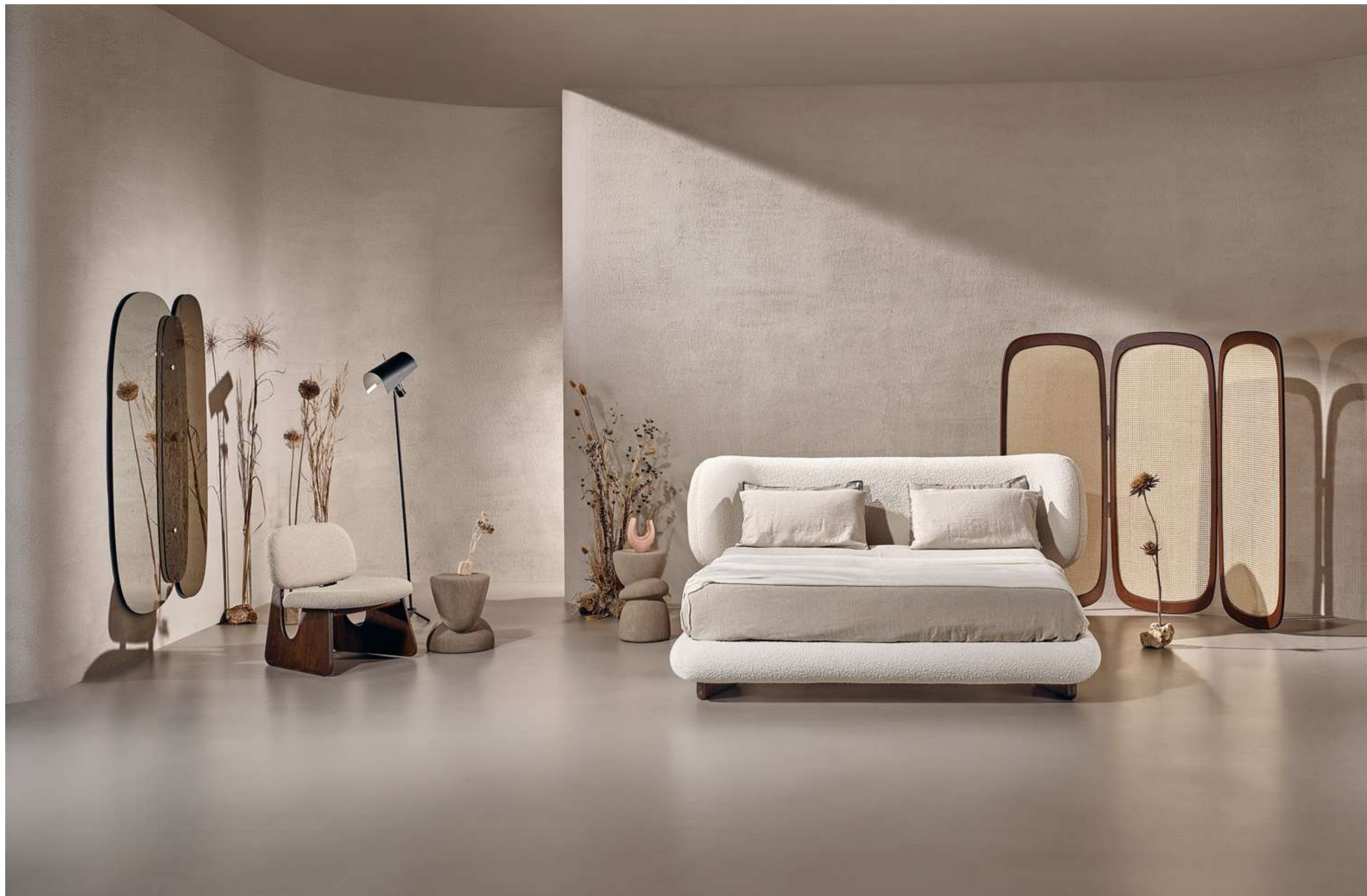
Lily Letto, Bed ; Cloud Complemento, Complement ; Twig Lounge Poltrona, Armchair ; Ovoo Tavolini, Coffee Tables ; Lagoon Complemento, Complement .