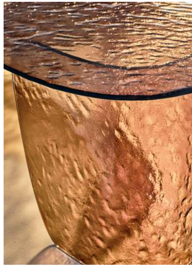
Blur Coffee Table Tavolini in vetro cotto ambra.