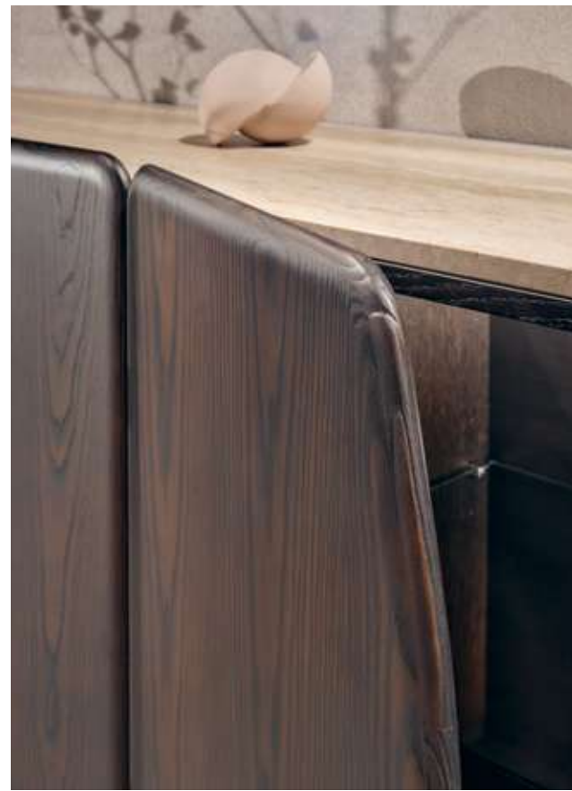
Dolmen Madia con struttura in legno frassino moka e top in marmo Travertino. Dew Complementi con specchio e cornice in metallo champagne.