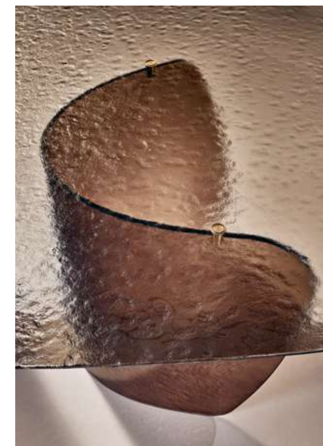
Blur Tavolo con top e base in vetro cotto bronzo. Bay Wood Seduta con struttura in legno frassino moka e tessuto twill TW01. Pod Madia con struttura in legno frassino moka, top marmo Camouflage e base in metallo brunito. Lagoon Complemento con specchio argento, specchio bronzo e vetro cotto bronzo.