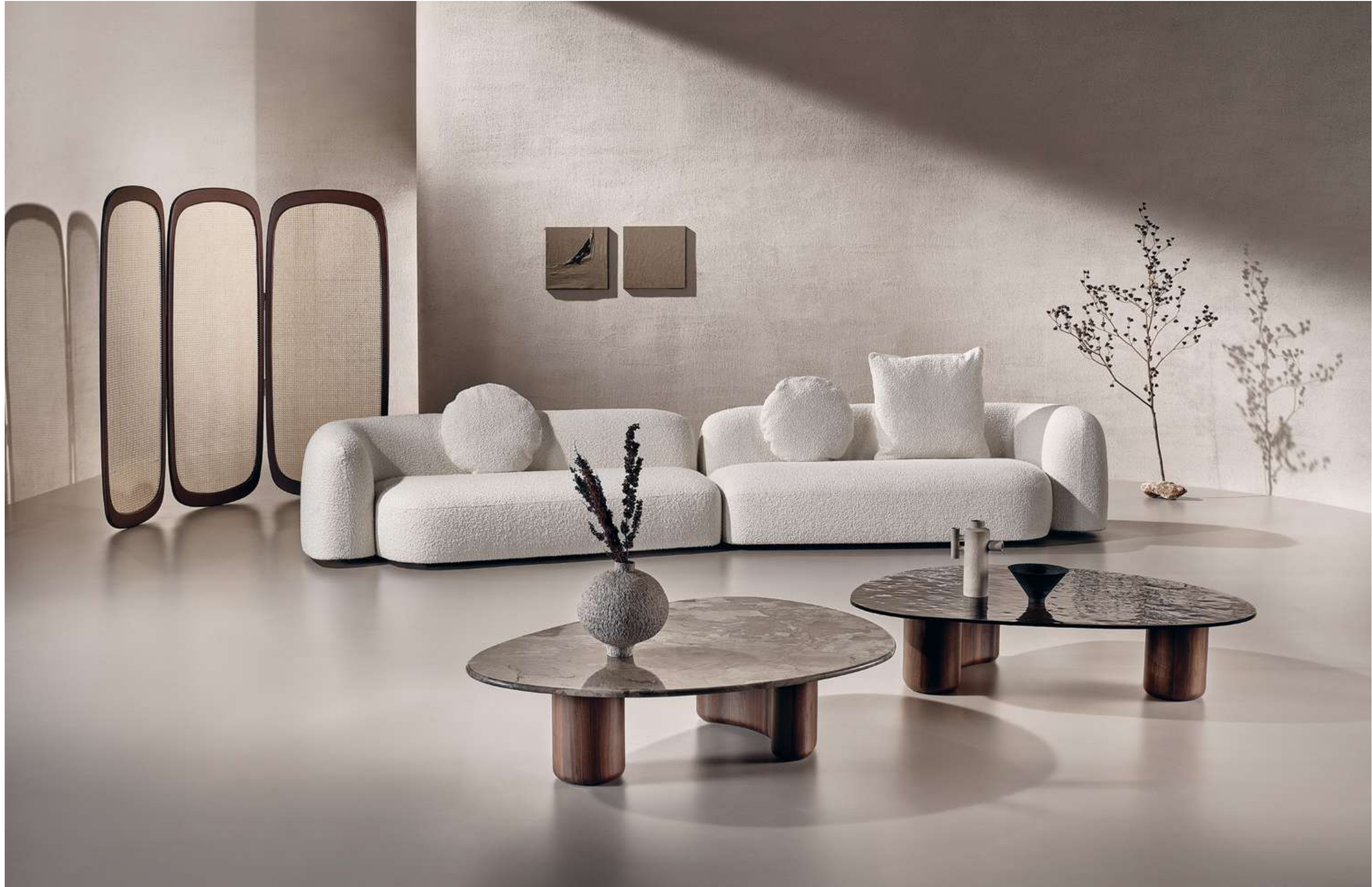
Dune Divano, Sofa; Lake Tavolini, Coffee Tables; Cloud Complemento, Complement.