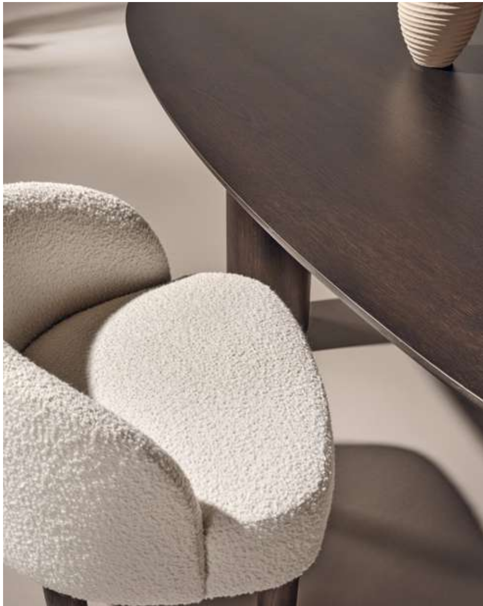
Pebble Seduta con base in legno frassino moka e tessuto bouclé B01.