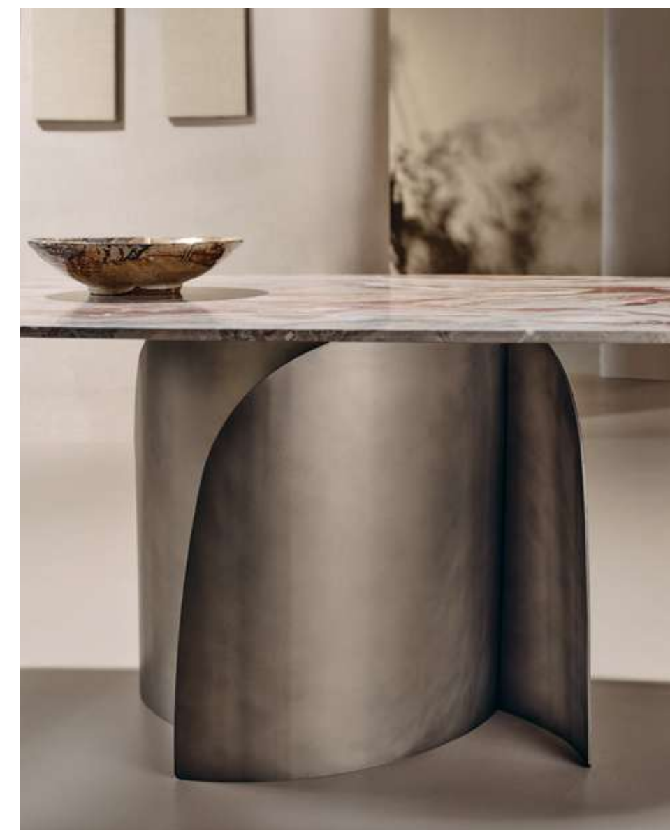
Bloom Tavolo con top in marmo Rosso Orobico e base in metallo titanio luxor.