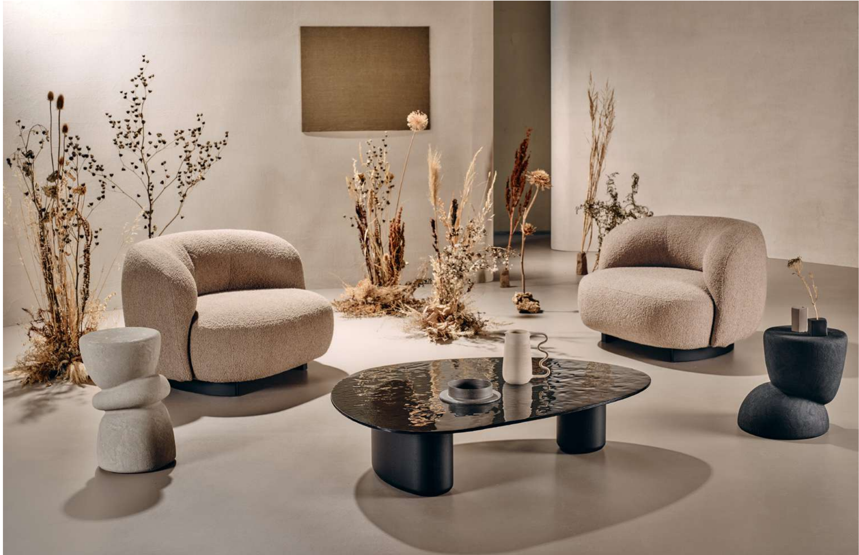
Pebble Lounge Poltrona, Armchair; Lake Tavolino, Coffee Table; Ovoo Tavolini, Coffee Tables.