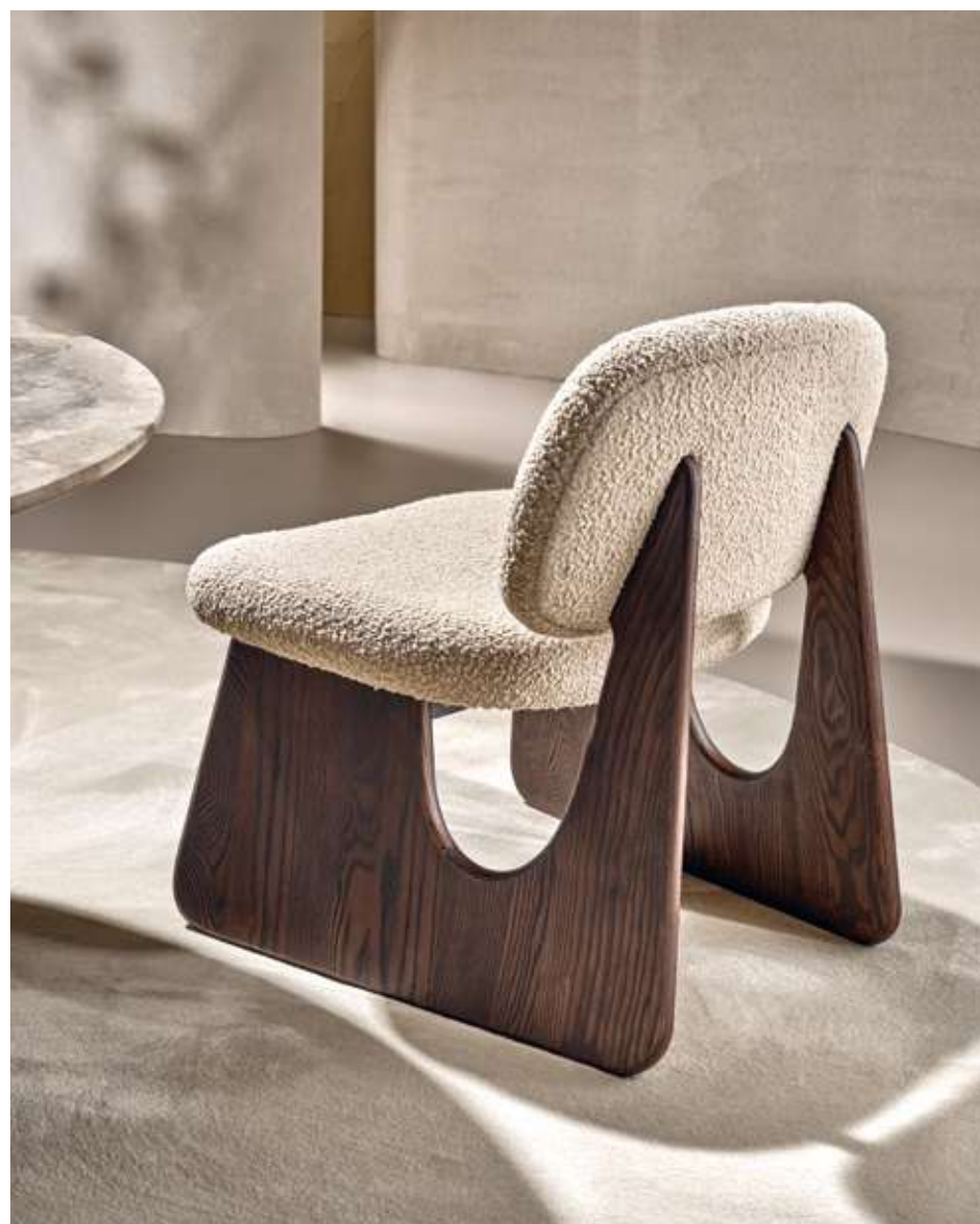
Twig Lounge Poltrona con base in legno frassino tinta noce e tessuto bouclé B02.