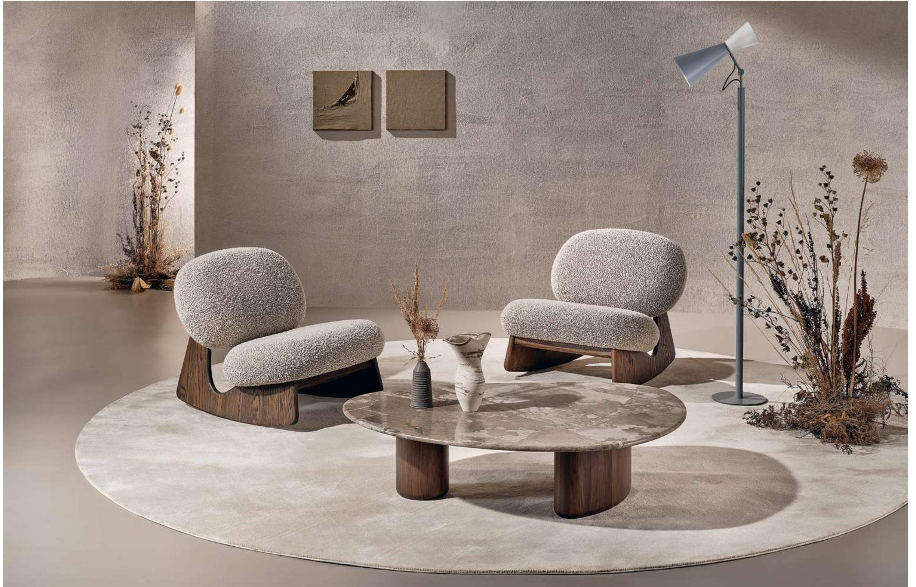
Twig Rocking Chair Poltrona, Armchair; Lake Tavolino, Coffee Table.