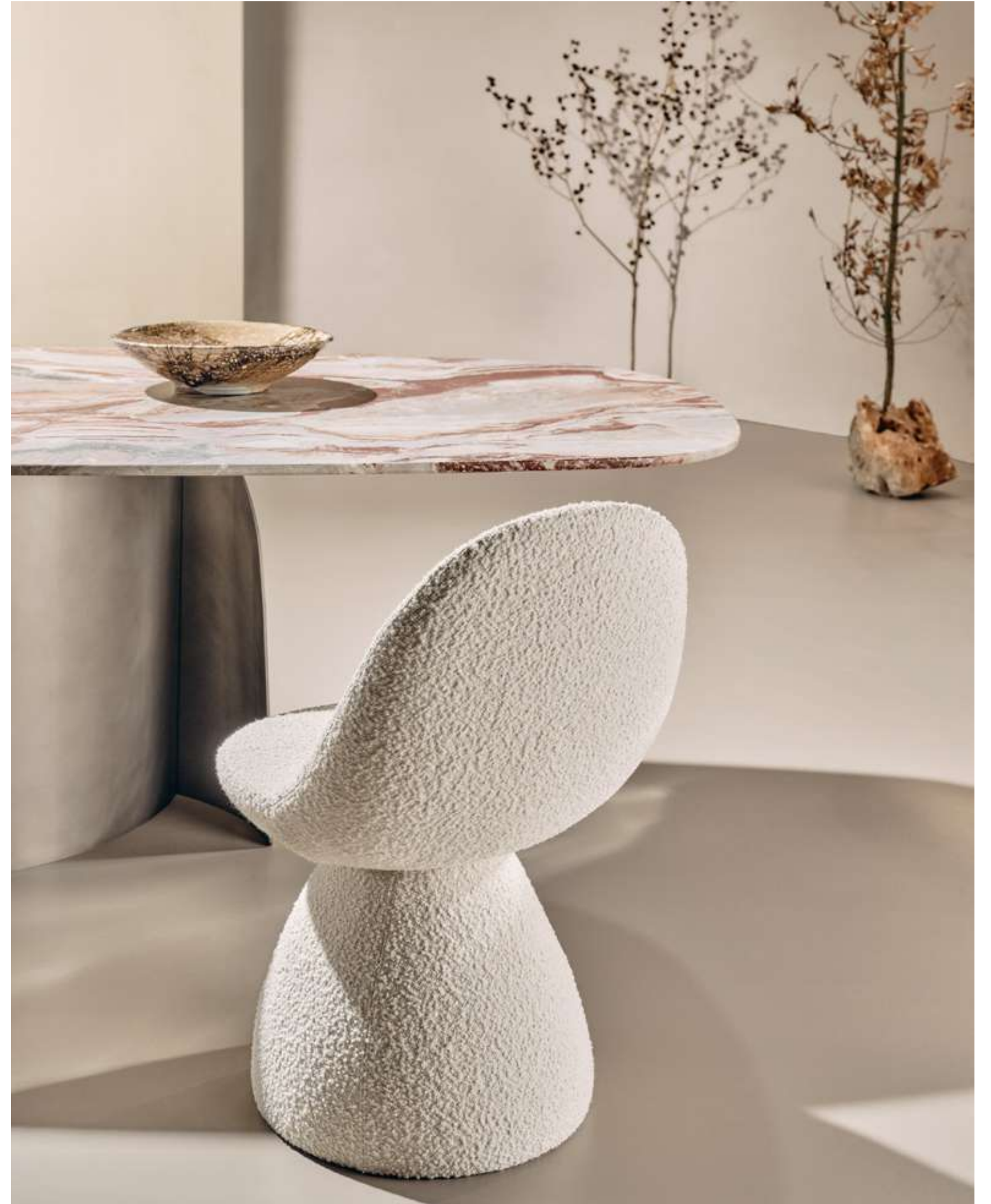
EN Nest Seating in bouclé B01 fabric.