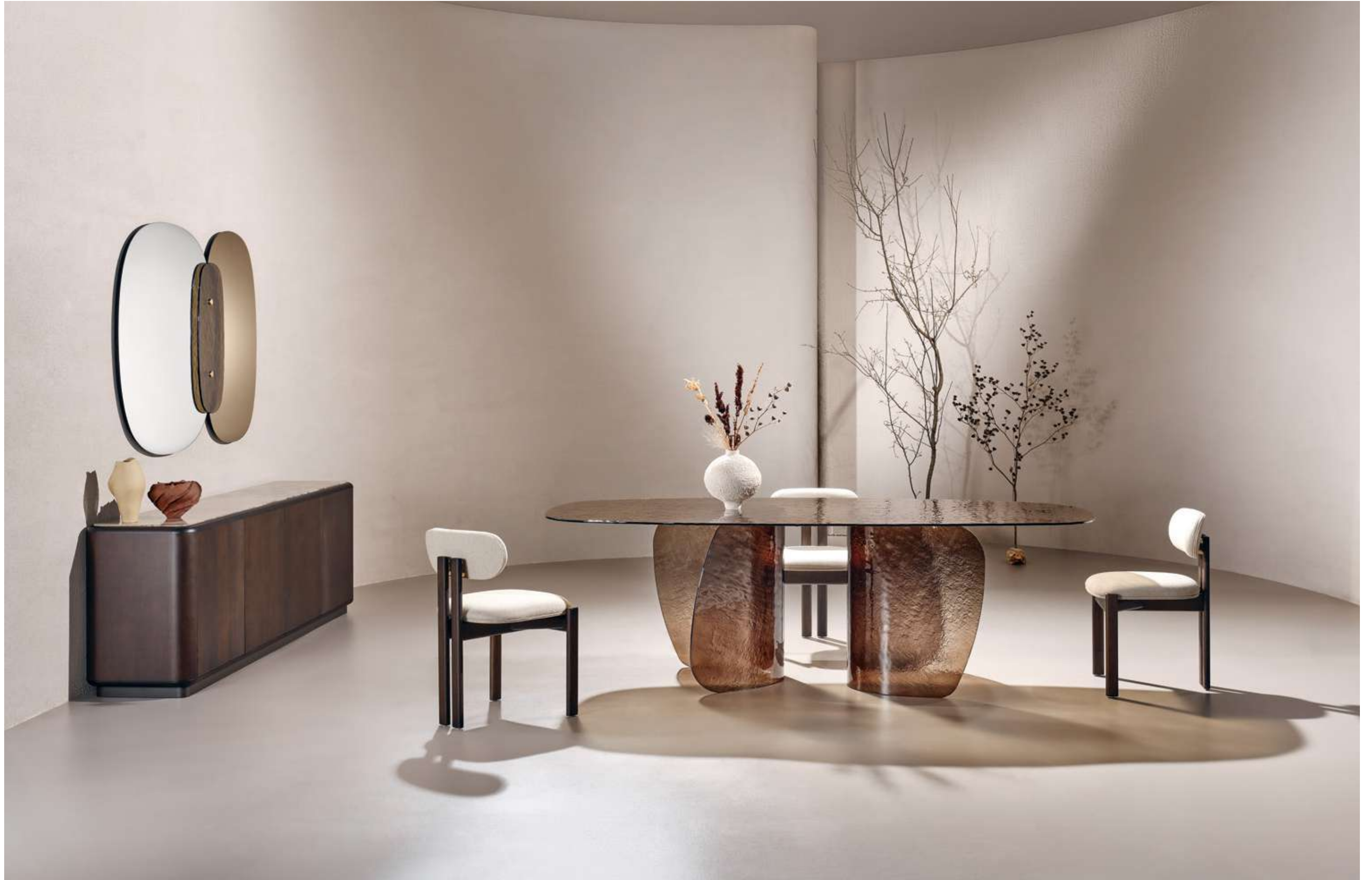
Blur Tavolo, Table ; Bay Wood Sedia, Seating Pod Madia, Sideboard ; Lagoon Complemento, Complement .