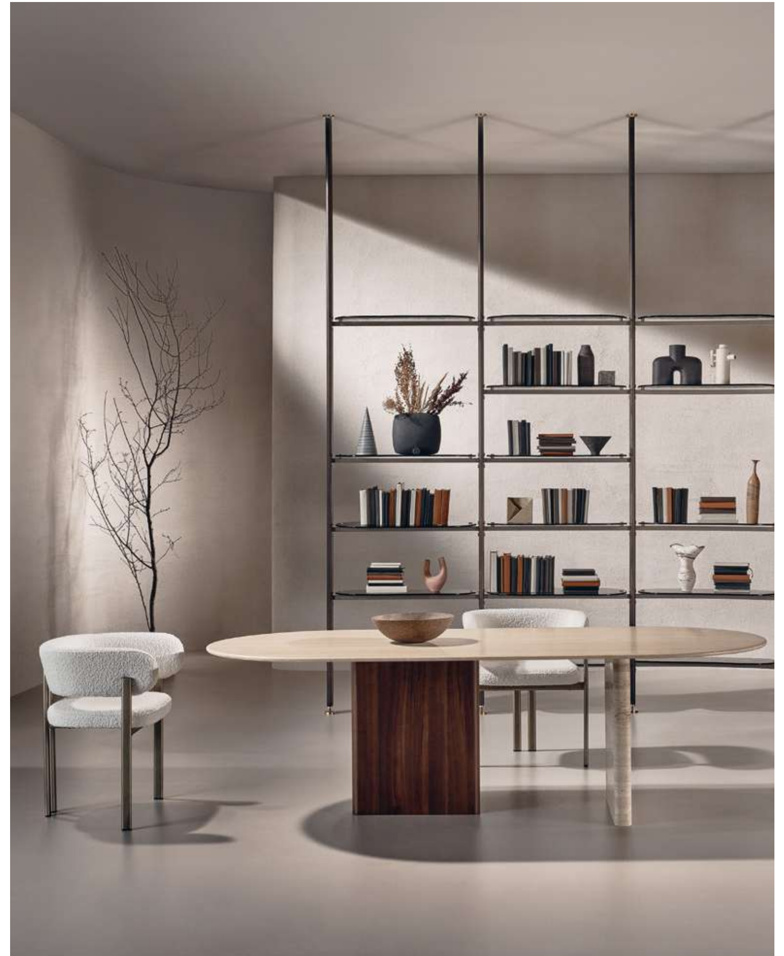
EN Monolith Table with Travertino marble top and base. Bay Metal Armchair Seating with luxor bronze metal base and bouclé B01 fabric. Stem Bookshelf with moka ash wood and champagne metal structure and smoked cast glass shelves.