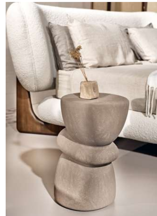
Lily Letto in tessuto bouclè B01 e struttura in legno frassino tinta noce. Ovoo Tavolino in ceramica fango.