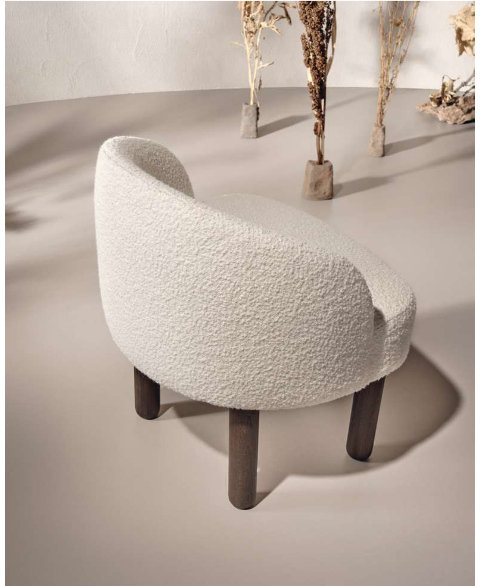
EN Pebble Seating with moka ash wood base and bouclé B01 fabric.