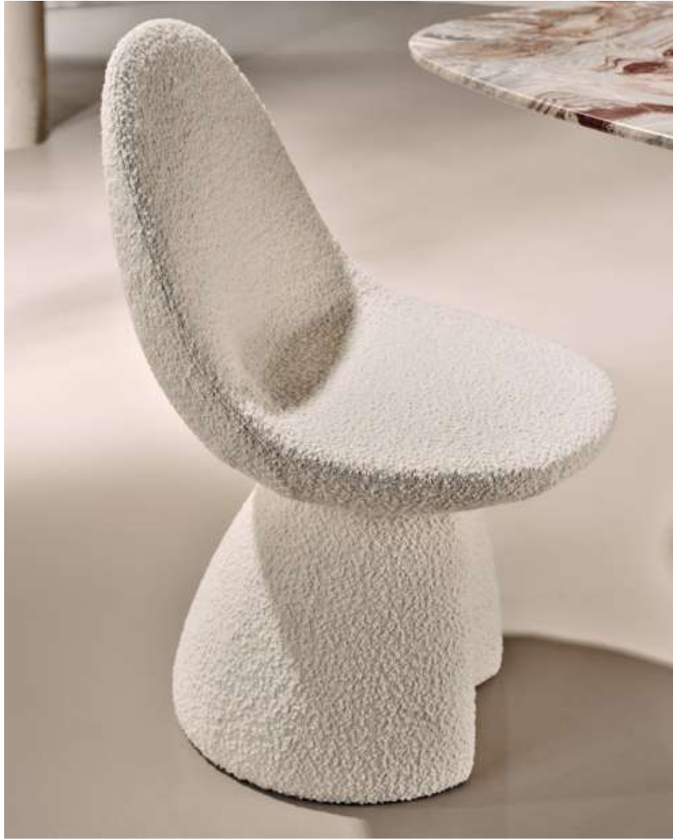
Nest Seduta in tessuto bouclé B01.