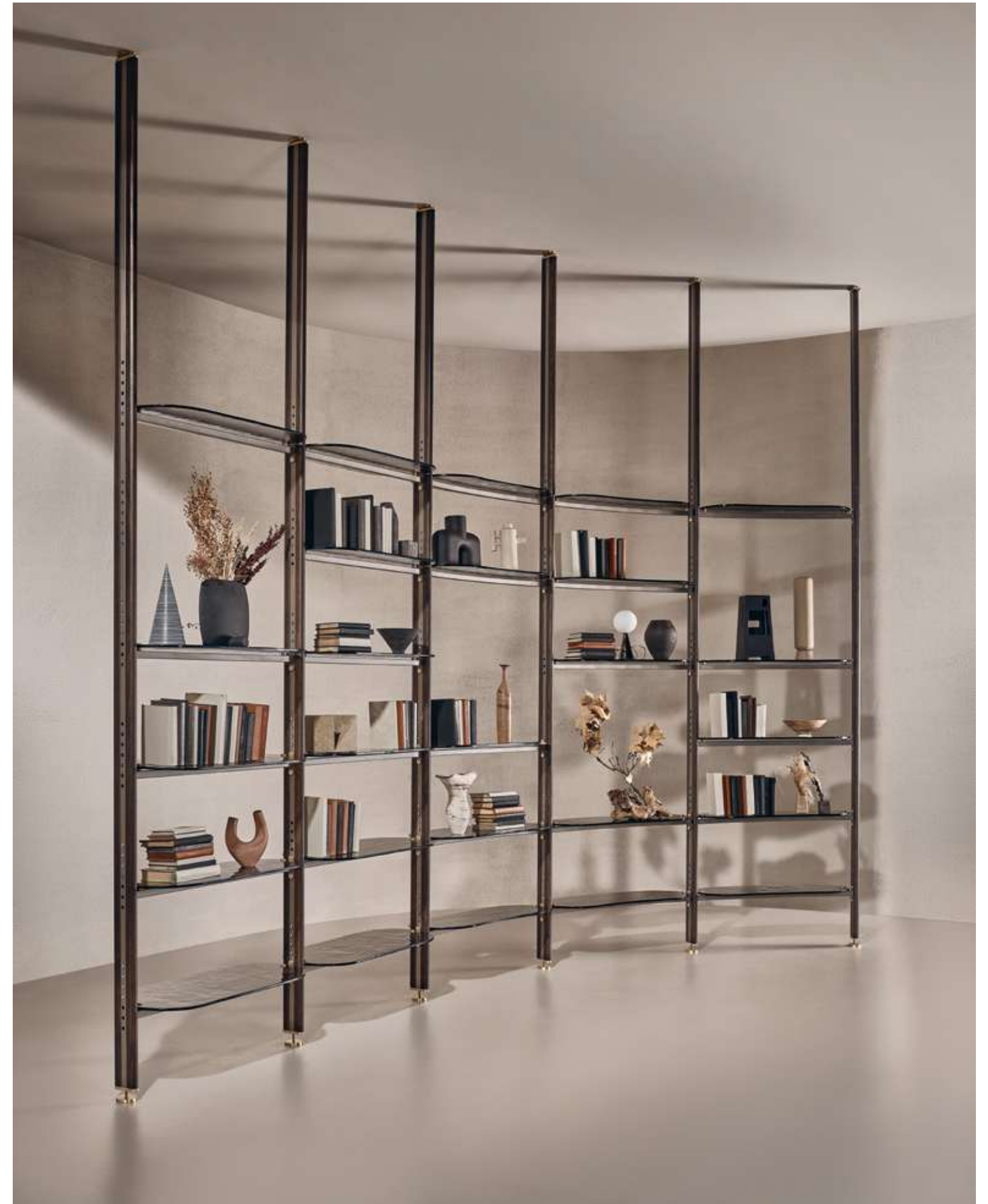
EN Stem Bookshelf with moka ash wood and champagne metal structure and bronze cast glass shelves.