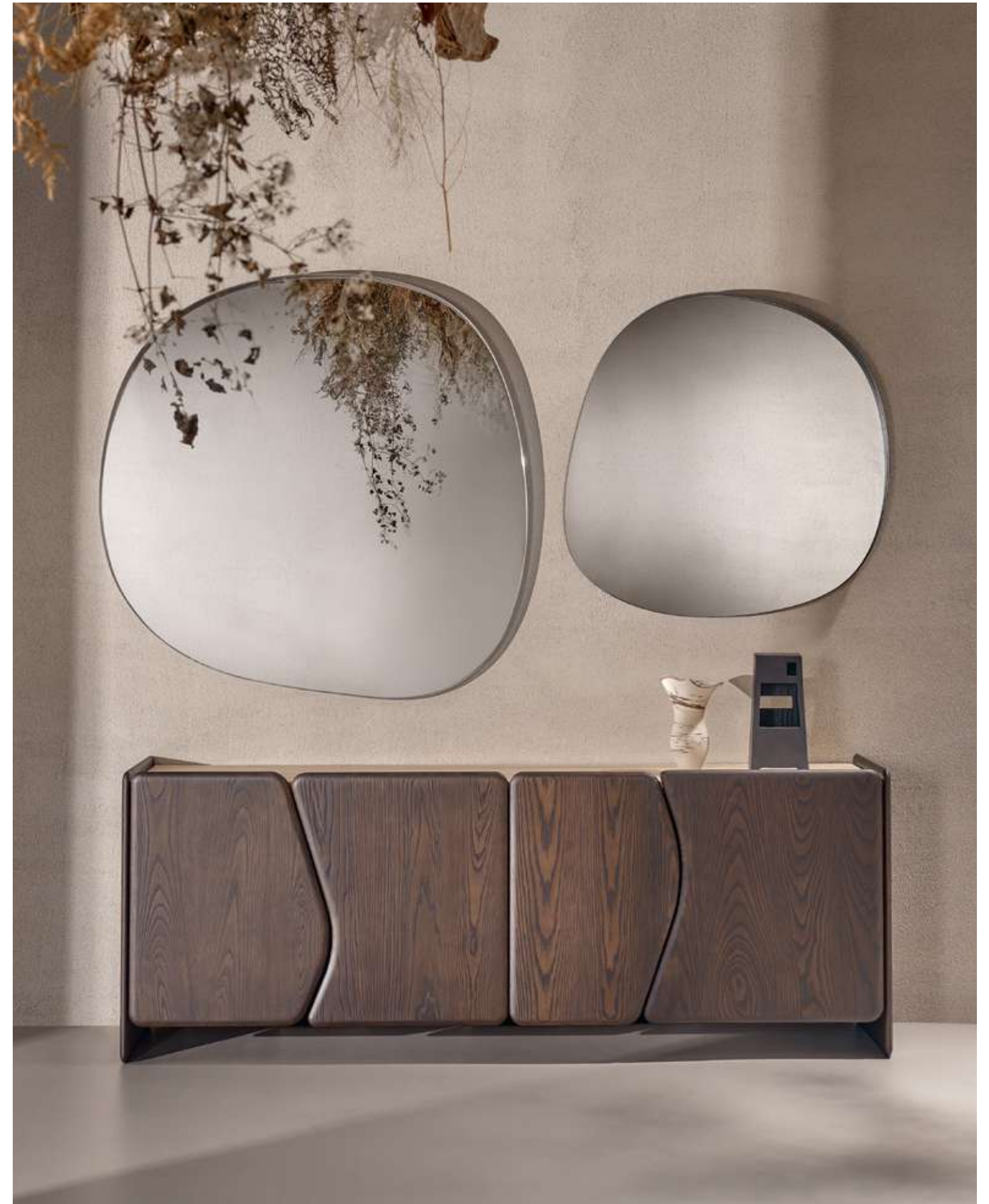
EN Dolmen Sideboard with moka ash wood structure and Travertino marble top. Dew Complements with mirror and champagne metal frame.