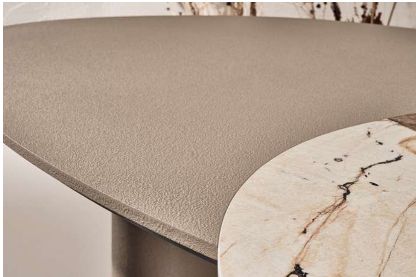
Lymph Large Tavolo con top in ceramica Patagonia e top e basi in materico fango.