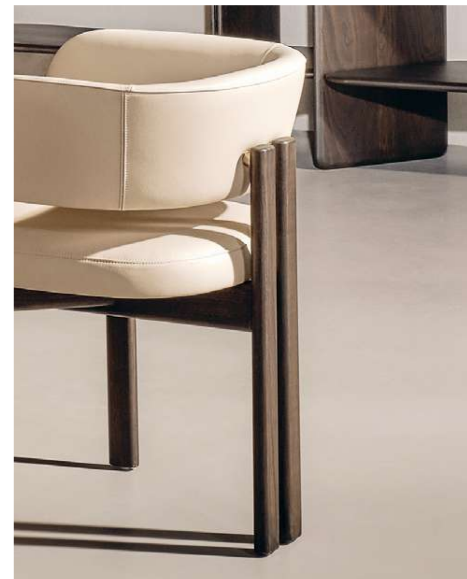
Bay Wood Armchair Seduta con struttura in legno frassino moka e pelle PL02. Blur Tavolo in vetro cotto ambra.