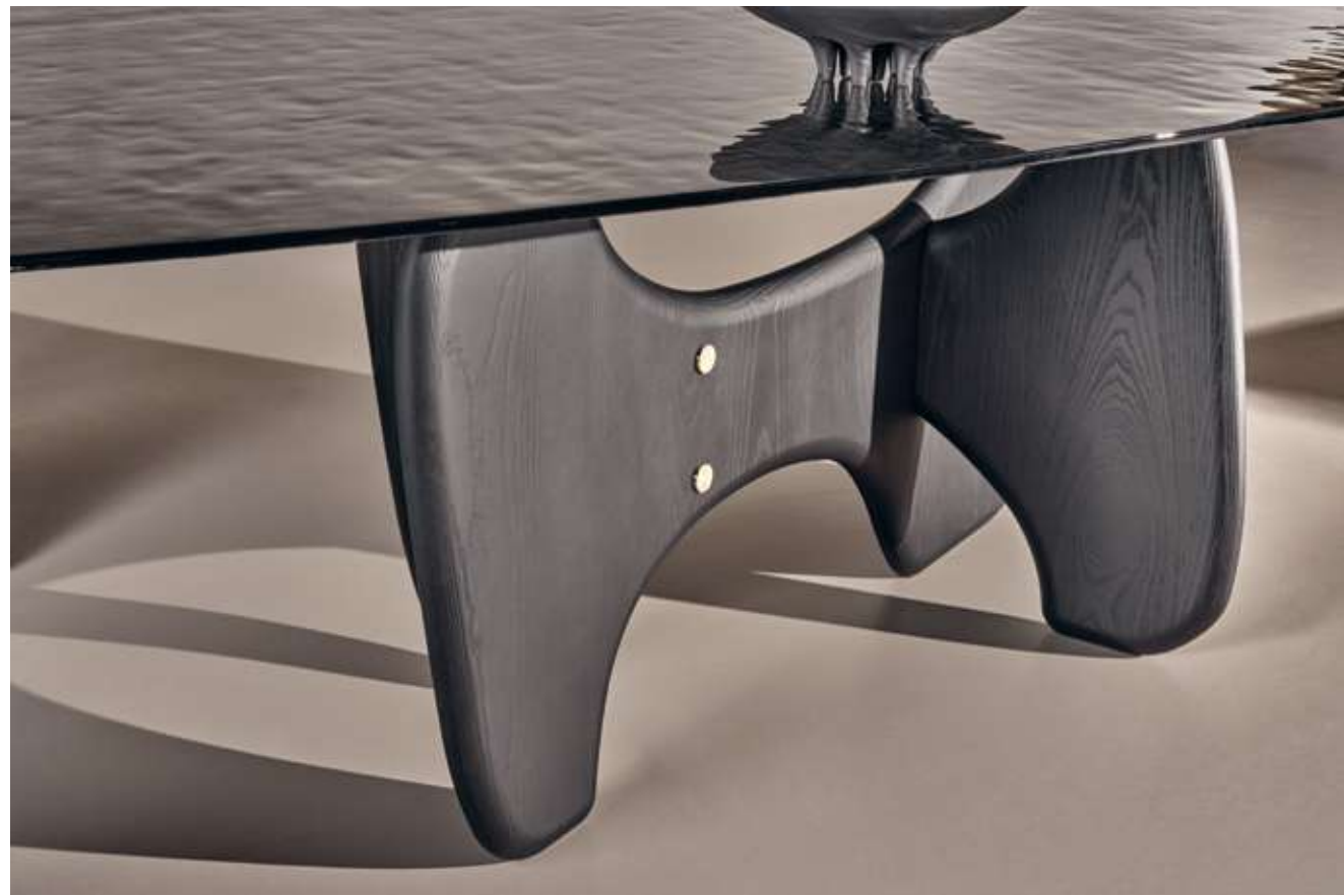
Tribe Tavolo con top in vetro cotto fumè e base in legno frassino nero assoluto.