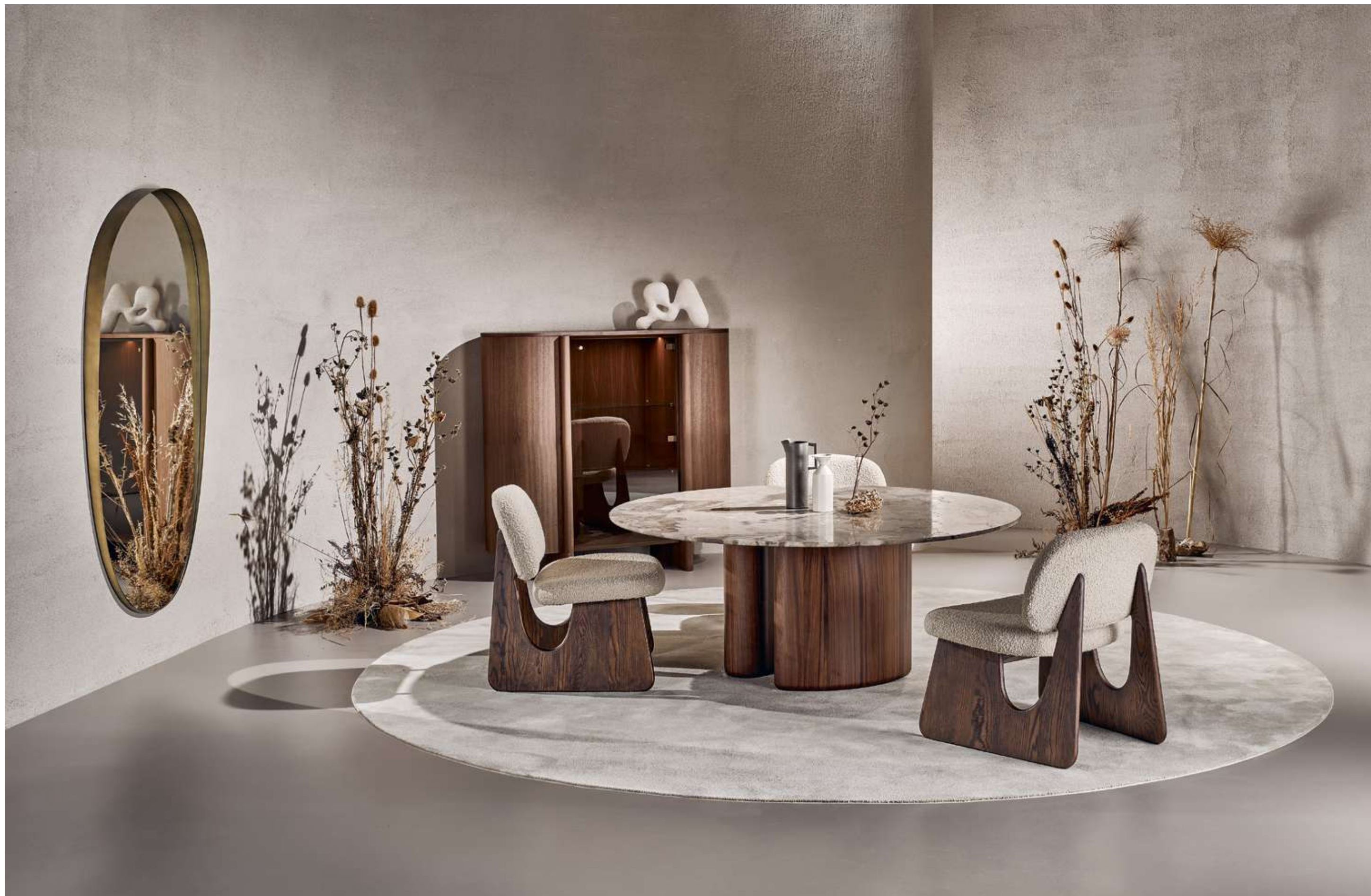
Tide Lounge Tavolo, Table ; Twig Lounge Poltrona, Armchair ; Dusk Contromobile Madia, Sideboard ; Dew Complemento, Complement .