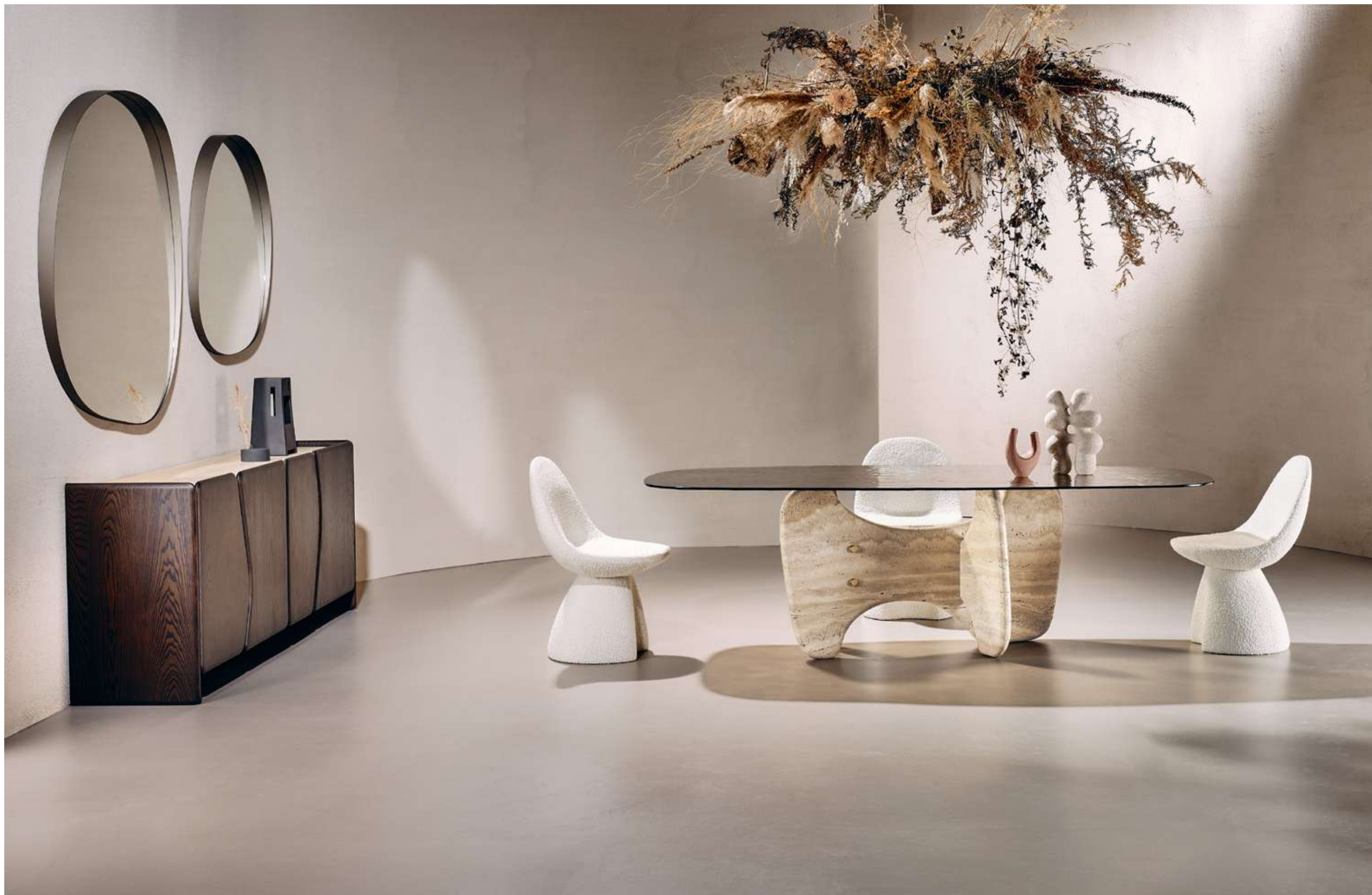
Tribe Stone Tavolo, Table ; Nest Seduta, Seating ; Dolmen Madia, Sideboard ; Dew Complemento, Complement .