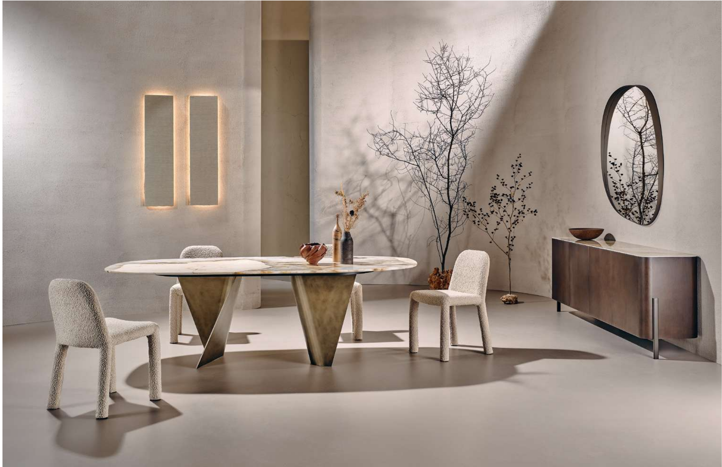
Blow Tavolo, Table ; Origin Seduta, Seating ; Shell Madia, Sideboard ; Dew Complemento, Complement .