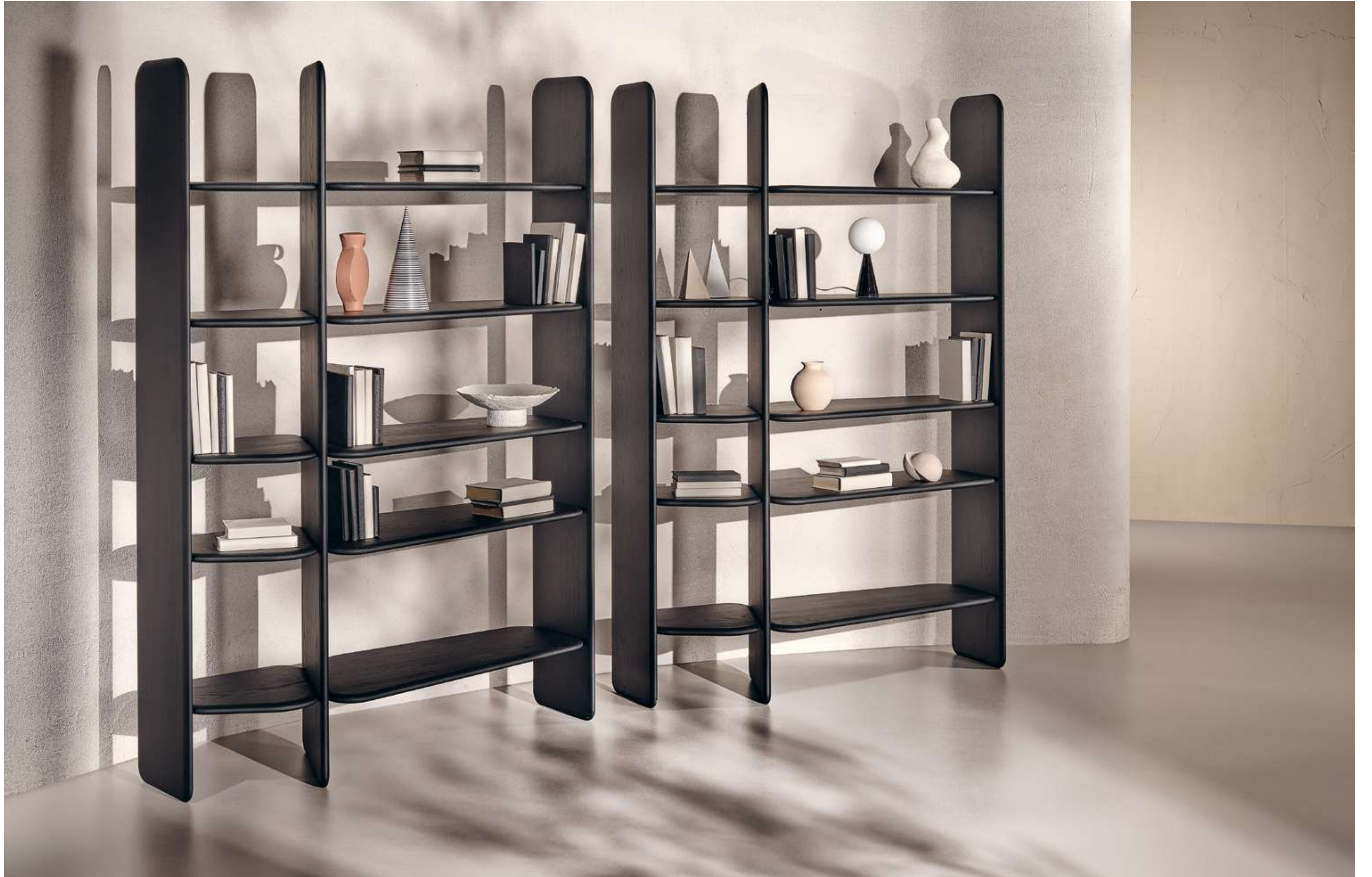
Nook Libreria, Bookshelf.