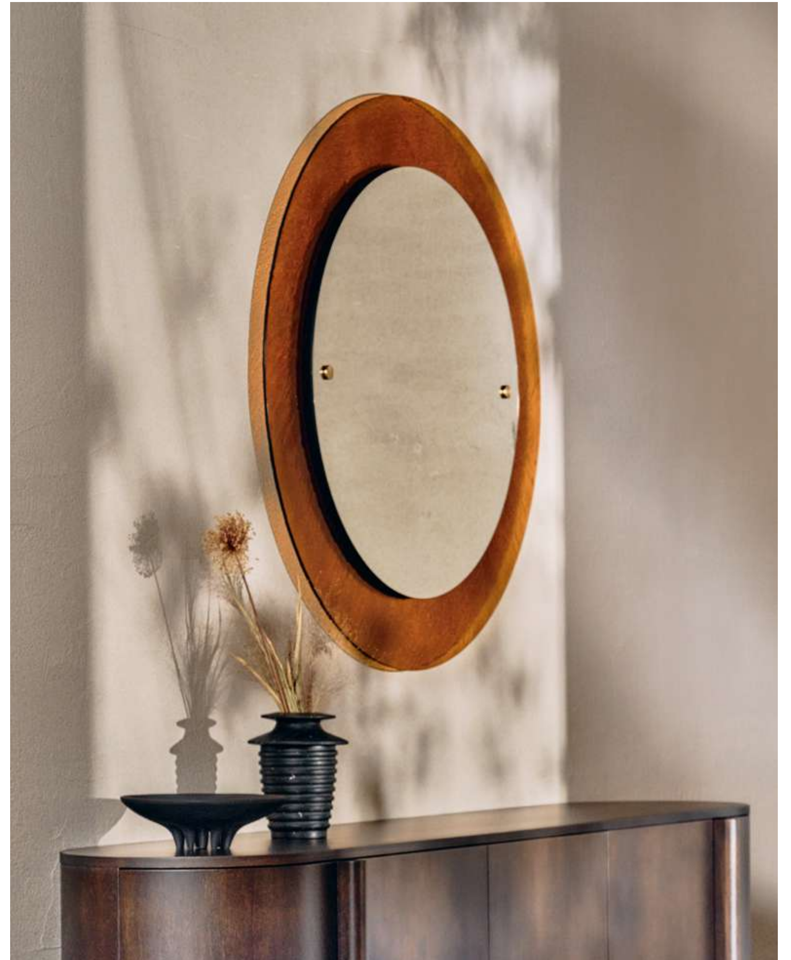
EN Eclipse Complement with mirror and amber cast glass.