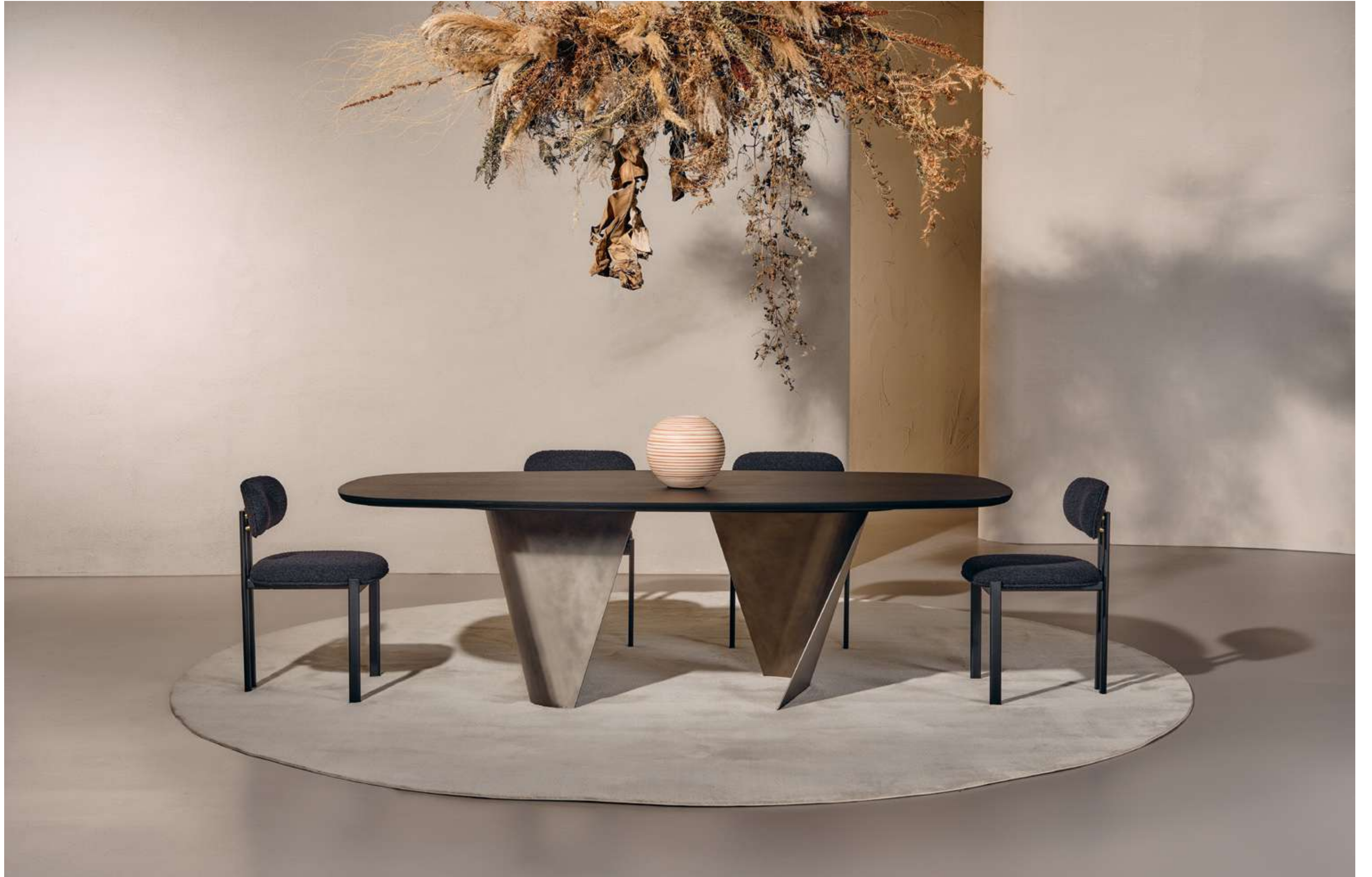
Blow Tavolo, Table ; Bay Metal Seduta, Seating .