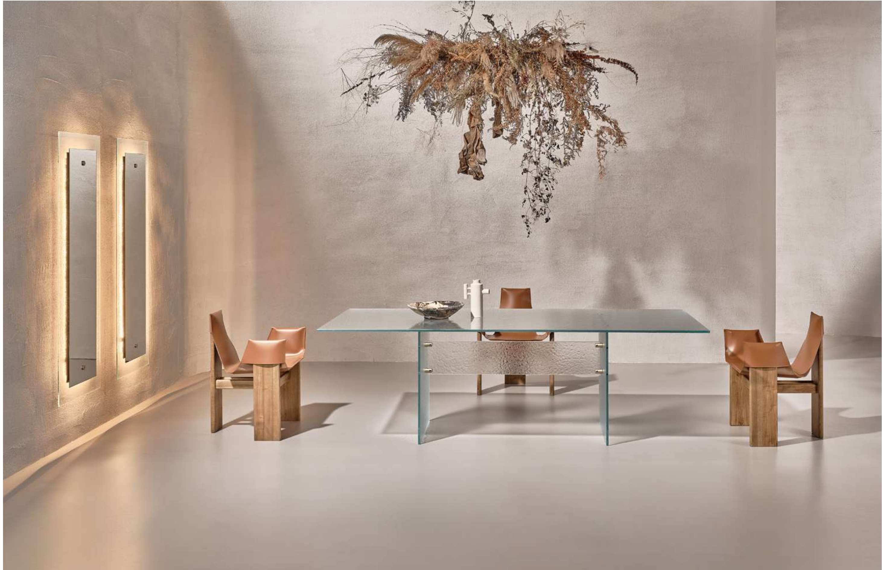
Waterfall Tavolo, Table ; Manta Low Seduta, Seating ; Eclipse Complemento, Complement .