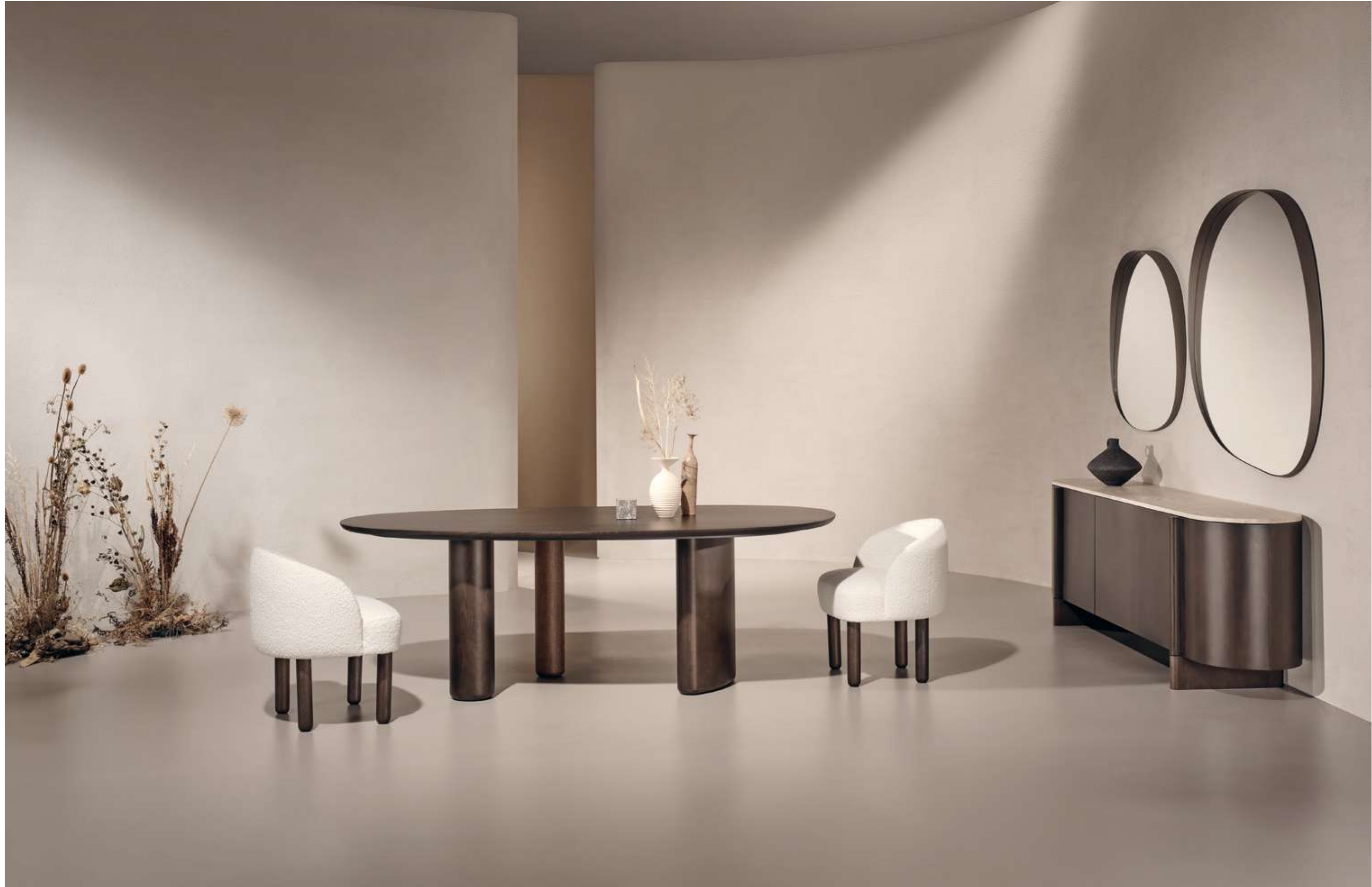
Lymph Medium Tavolo, Table ; Pebble Seduta, Seating ; Dusk Madia, Sideboard ; Dew Complemento, Complement .