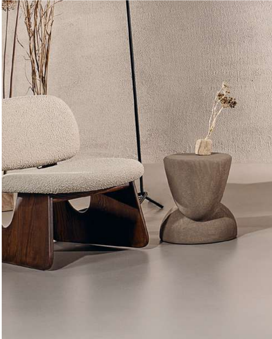
Ovoo Tavolino in ceramica fango.