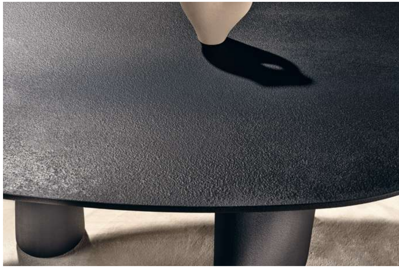
Lymph Small Tavolo con top e base in materico nero. Bay Metal Seduta con struttura in metallo nero opaco e tessuto bouclè B10.