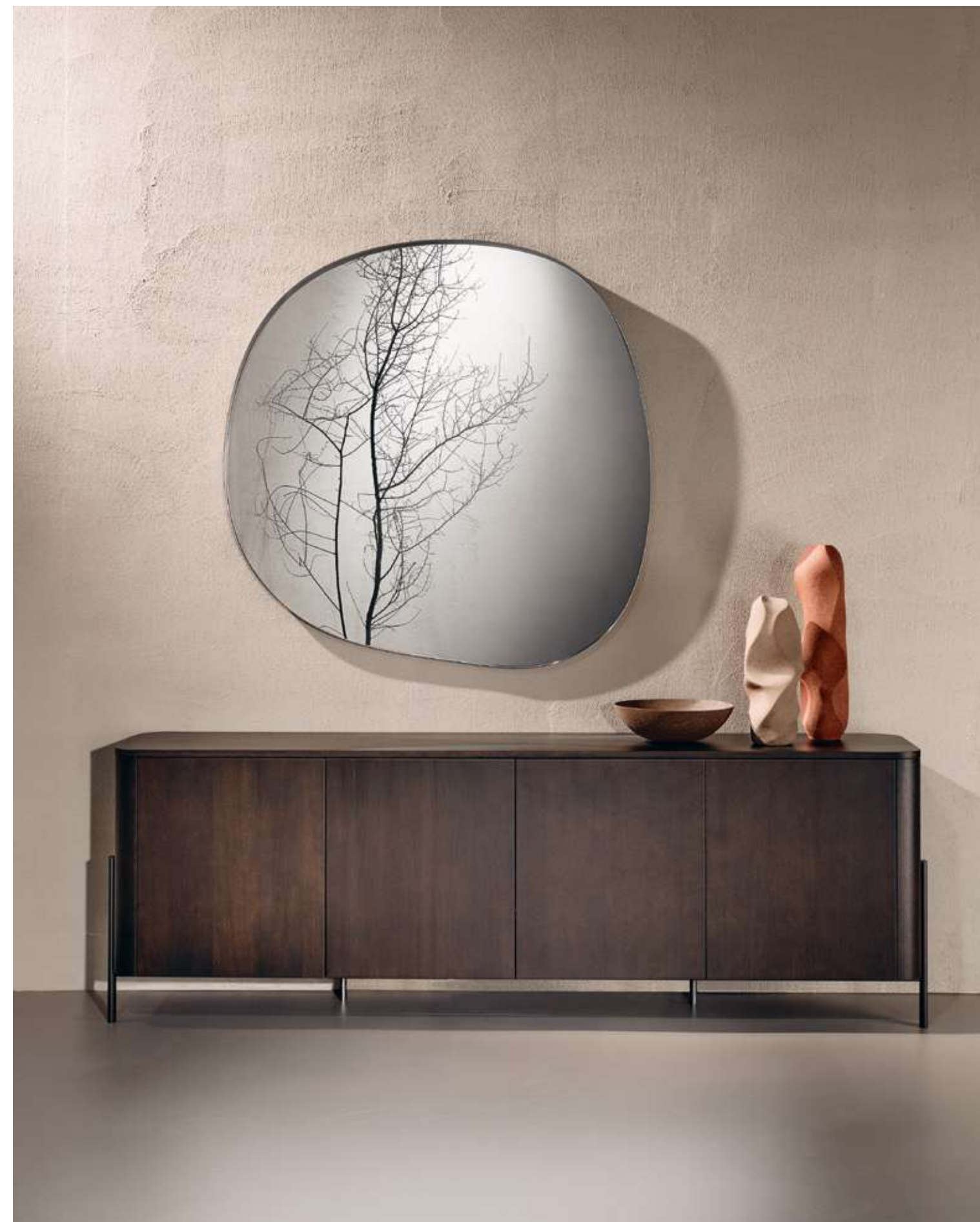
EN Shell Sideboard with moka ash wood structure and top and brown metal base. Dew Complement with mirror and champagne metal frame.