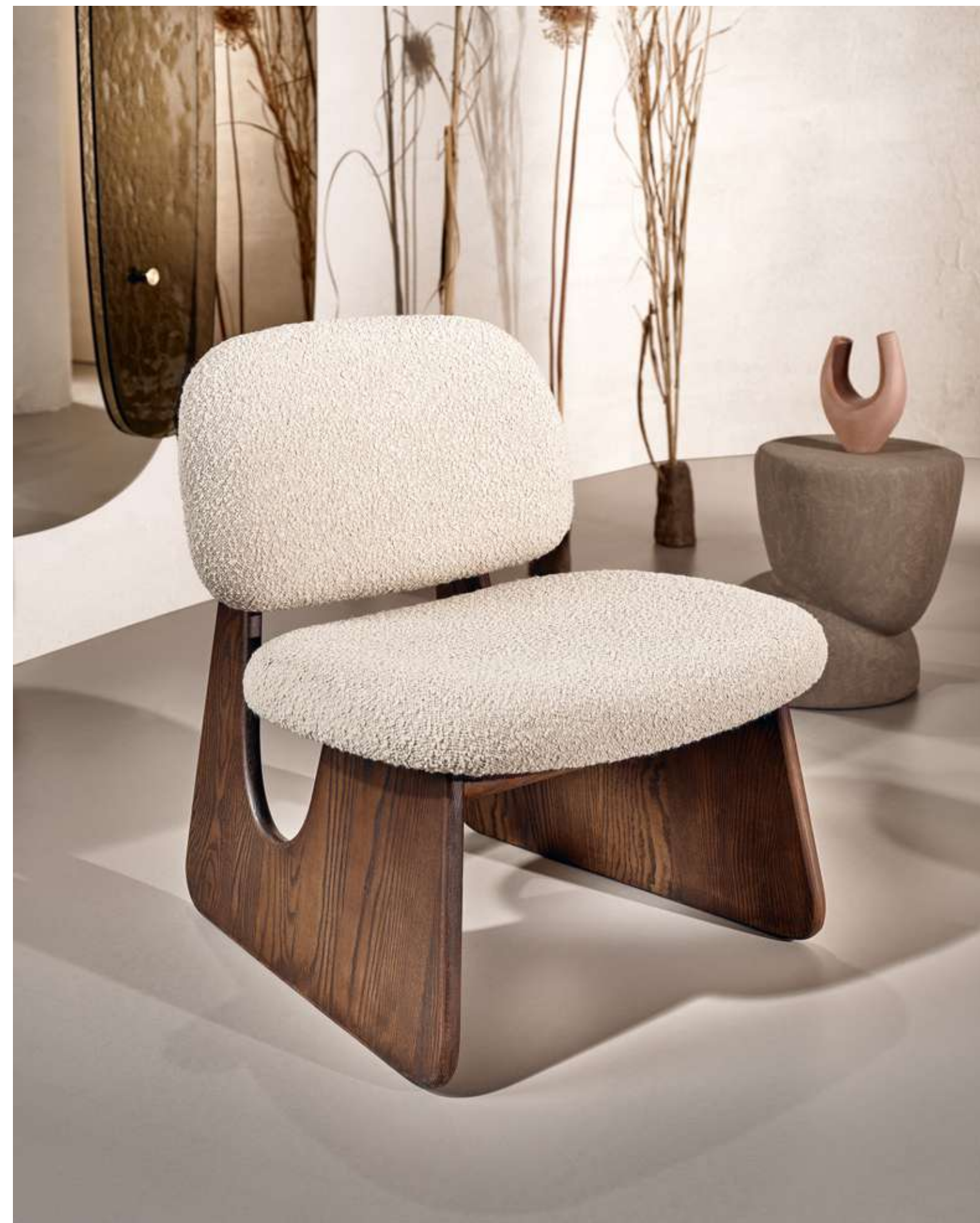
EN Twig Lounge Armchair with american walnut color ash wood base and bouclé B02 fabric.