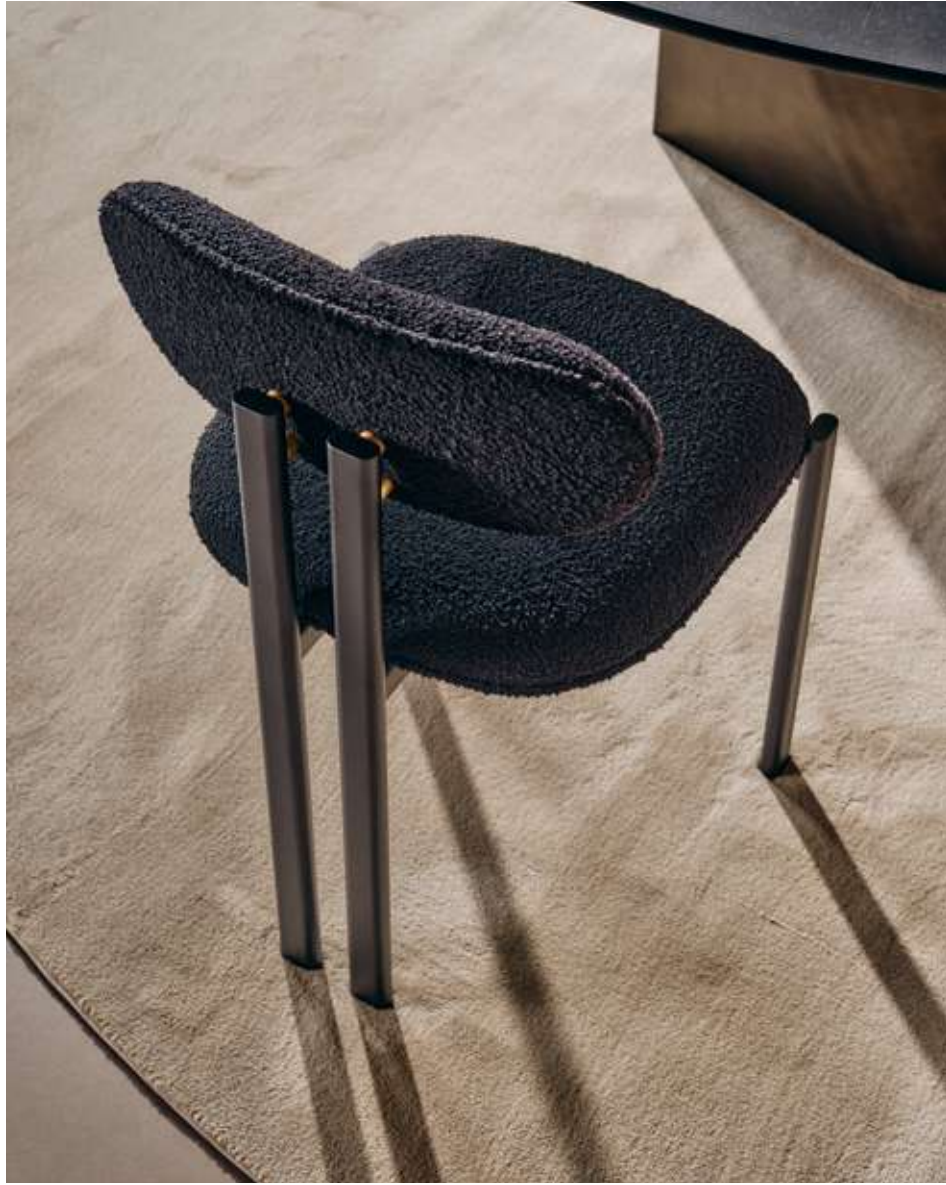
Bay Metal Seduta con struttura in metallo nero opaco e tessuto bouclé B10.