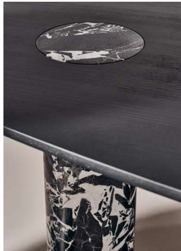
Lymph Big Tavolo con top e basi in legno frassino nero assoluto e marmo Nero antico.