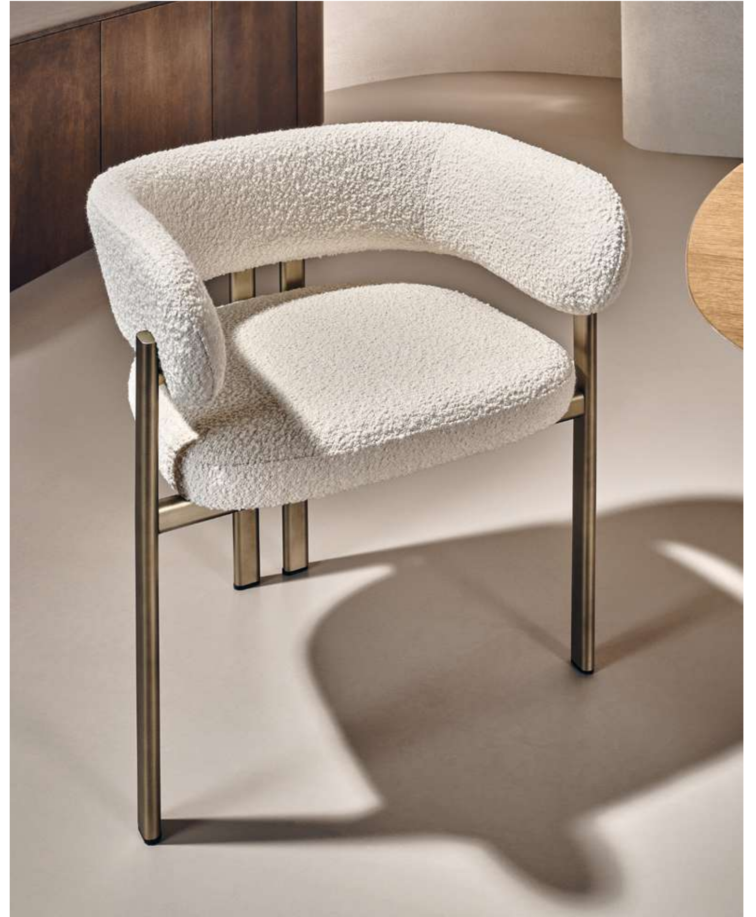
EN Bay Metal Armchair Seating with luxor bronze metal base and bouclé B01 fabric.