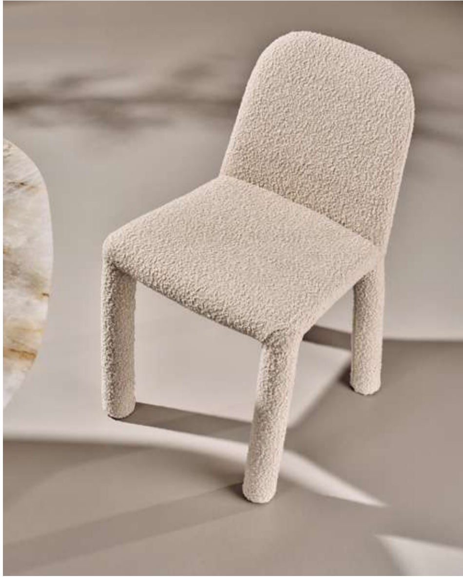
Origin Seduta in tessuto bouclè B02.