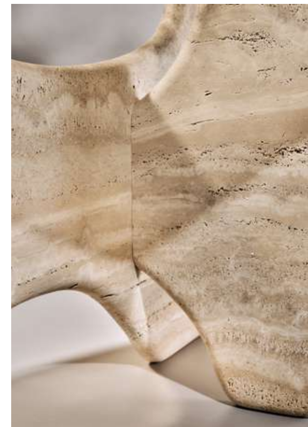
Tribe Stone Tavolo con top in vetro cotto bronzo e base in marmo Travertino. Nest Sedia in tessuto bouclè B01. Dolmen Madia in legno frassino moka e top in marmo Travertino. Dew Complemento con specchio argento e cornice in metallo champagne.