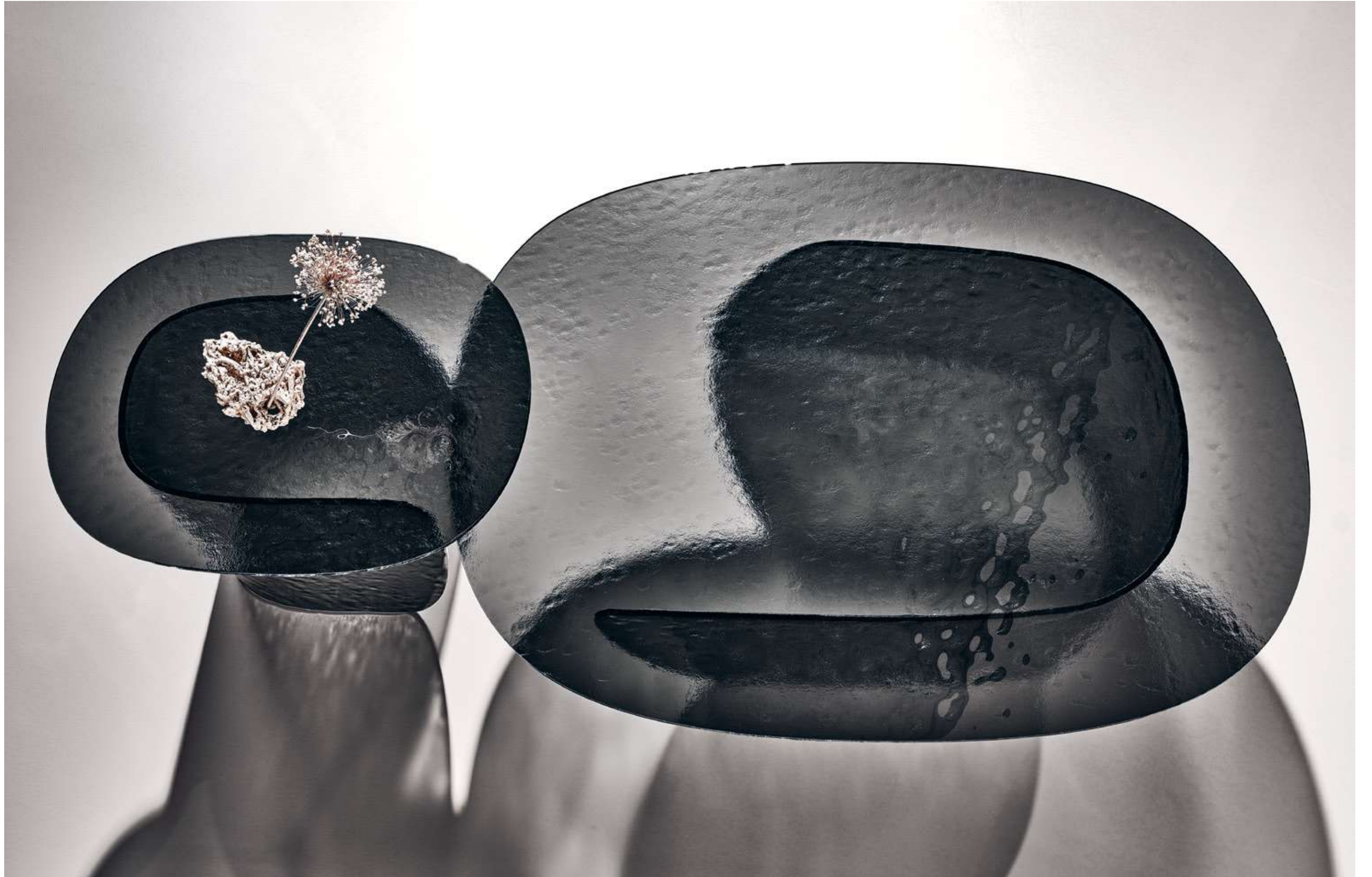
Blur Coffee Table Tavolini, Coffee Tables .