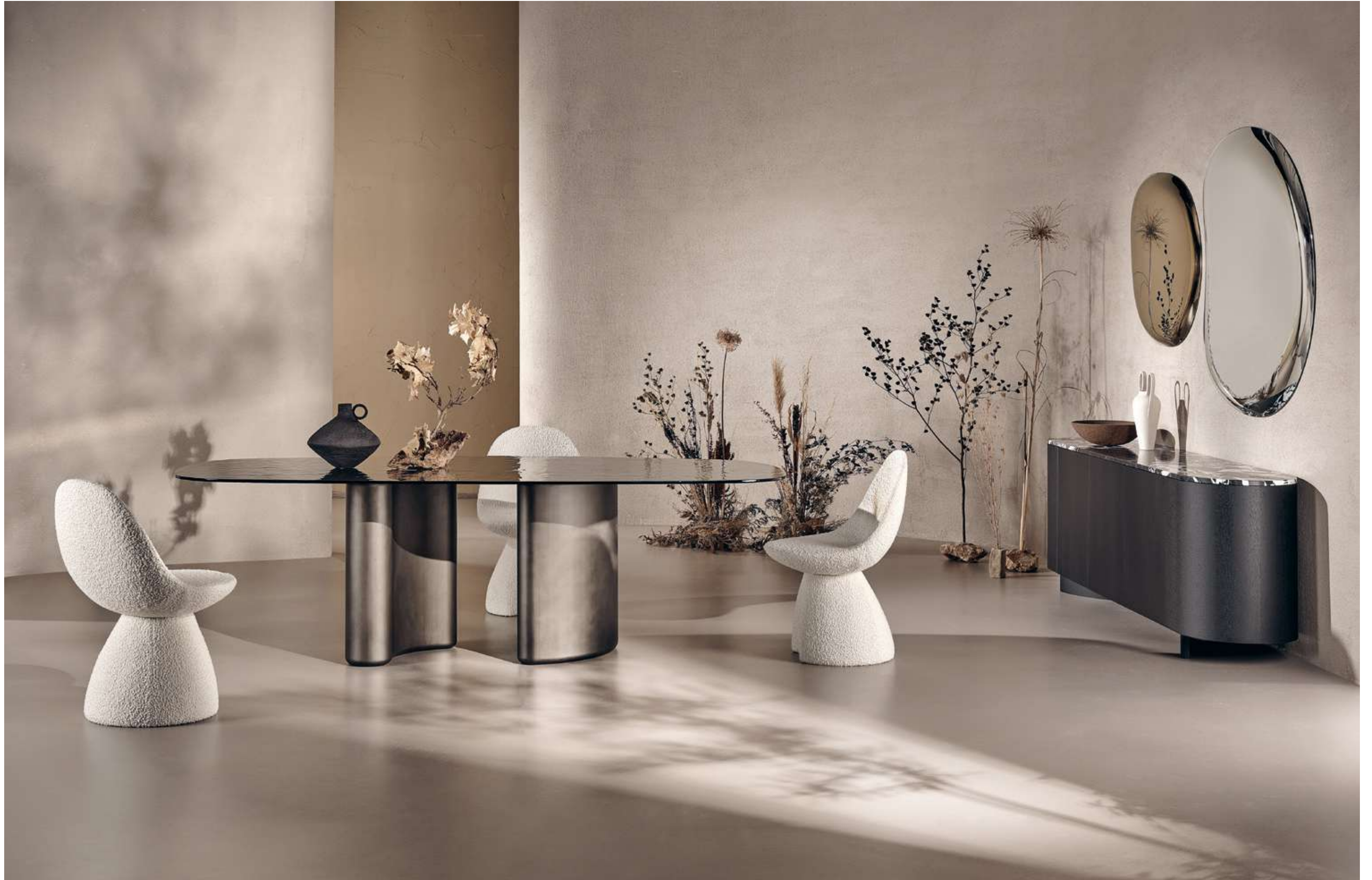
Tide Glass Tavolo, Table ; Nest Seduta, Seating ; Flow Madia, Sideboard ; Pangea Complemento, Complement .