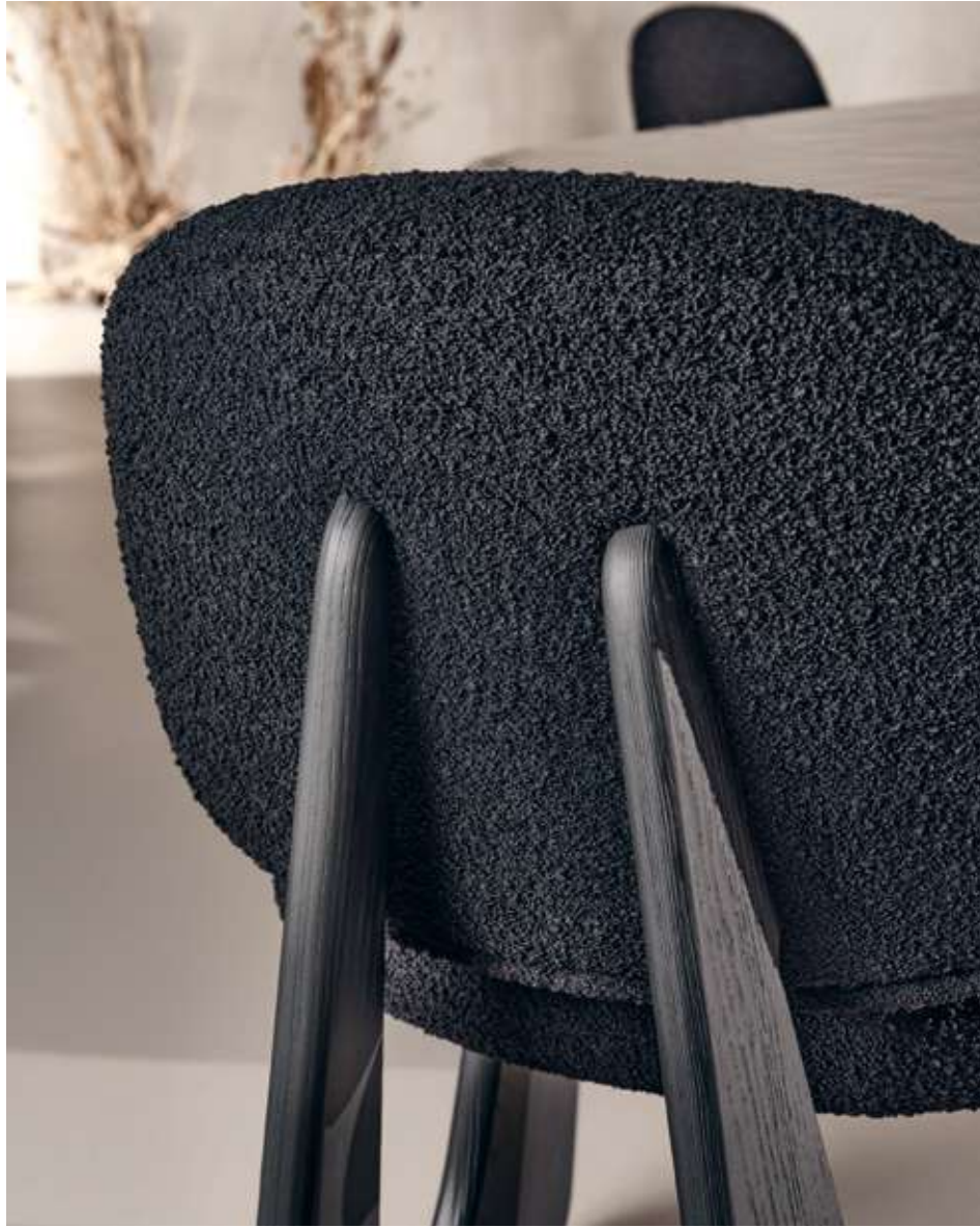
Twig Seduta con struttura in legno frassino nero assoluto e tessuto bouclé B10.