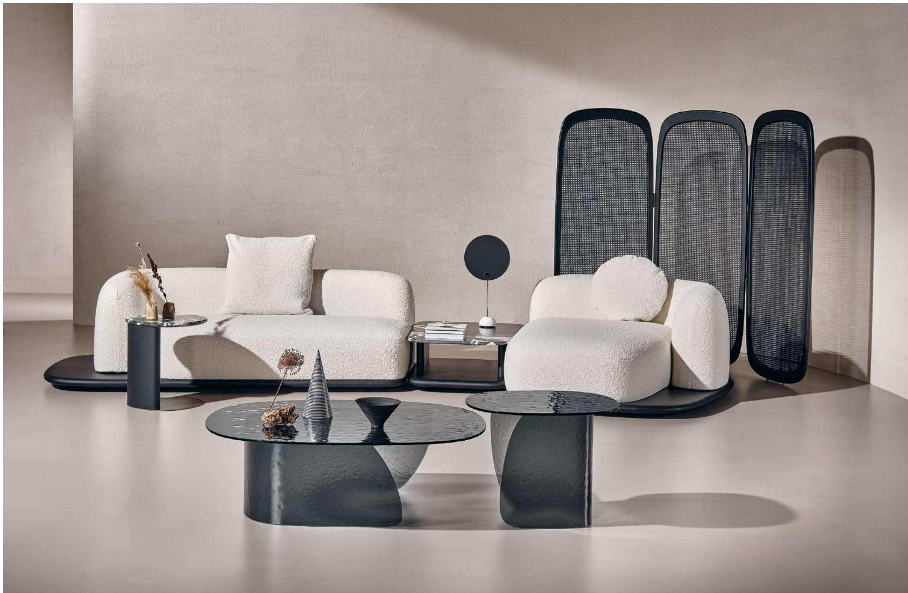
Dune Divano, Sofa ; Drop Tavolino, Coffee Table ; Blur Coffee Table Tavolini, Coffee Tables ; Cloud Complemento, Complement .