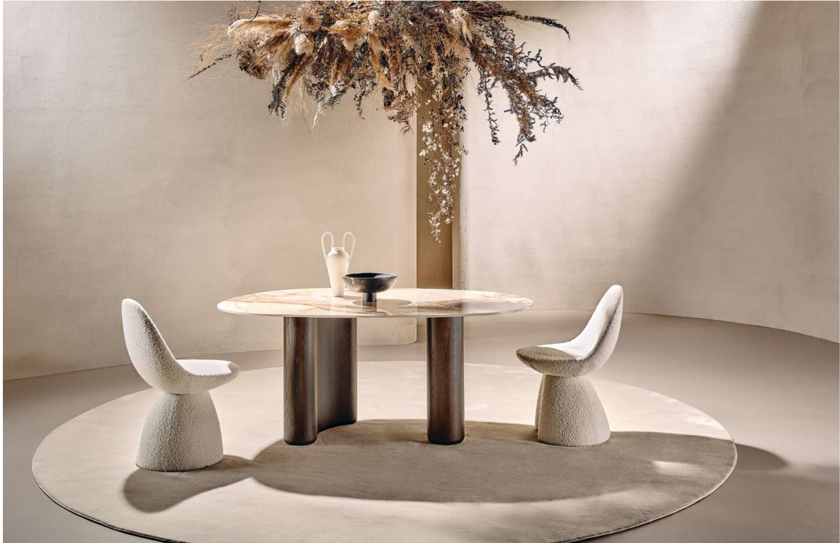
Lymph Small Tavolo, Table ; Nest Seduta, Seating .