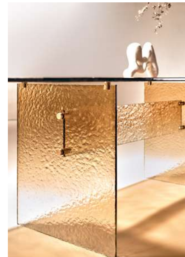
Waterfall Tavolo in vetro cotto extrachiario e sfumatura ambra. Manta Low Seduta con base in legno frassino caramello e cuoio cognac. Eclipse Complemento con specchio argento e vetro cotto extrachiario.