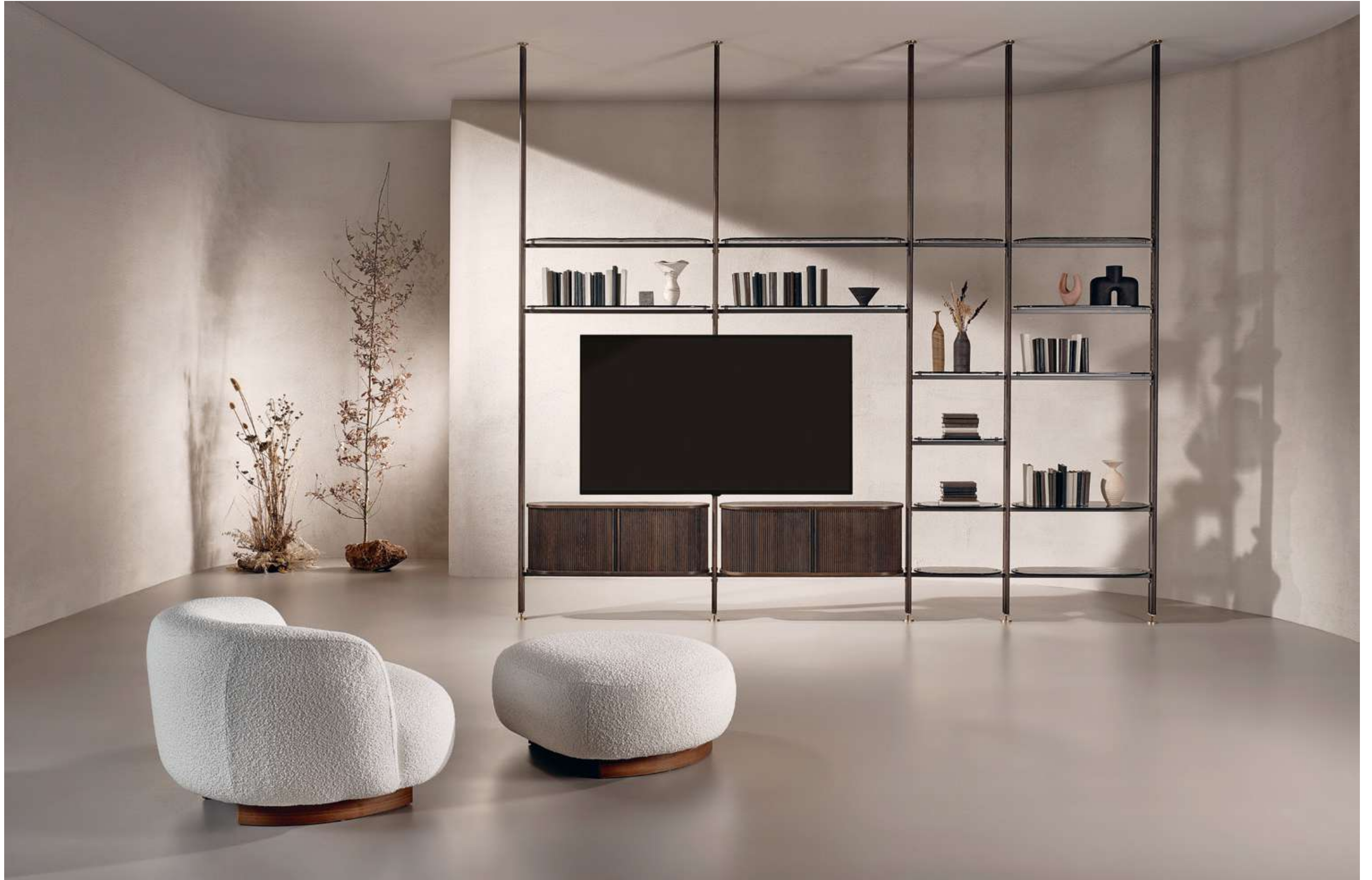
Stem Libreria, Bookshelf; Pebble Lounge Poltrona e pouf, Armchair and pouf.