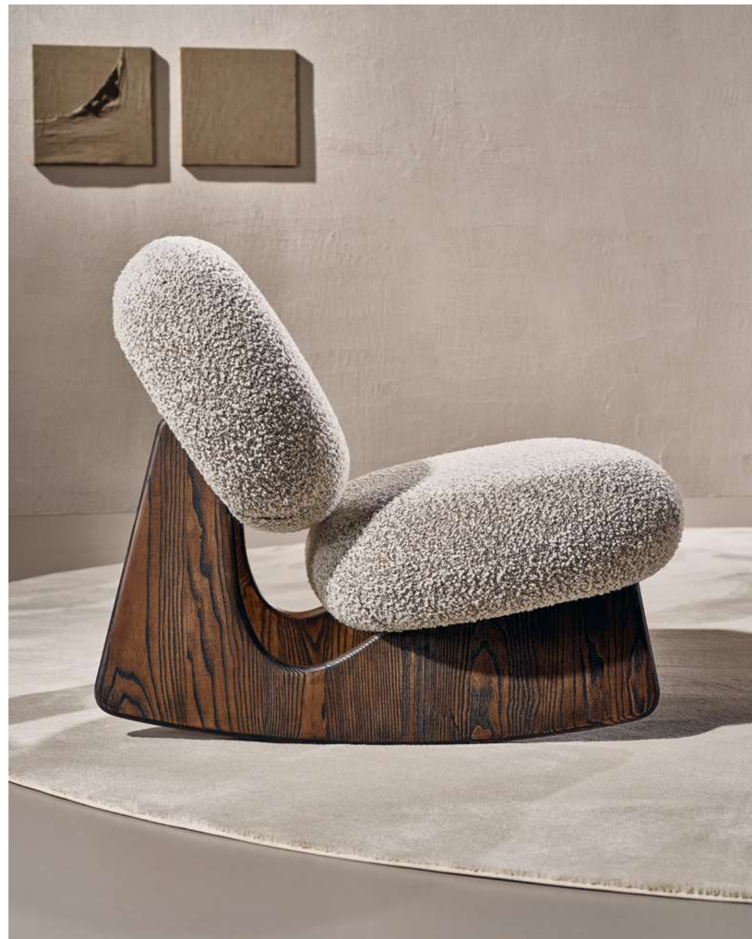
EN Twig Rocking Chair Armchair with walnut color ash wood base and bouclé B09 fabric.