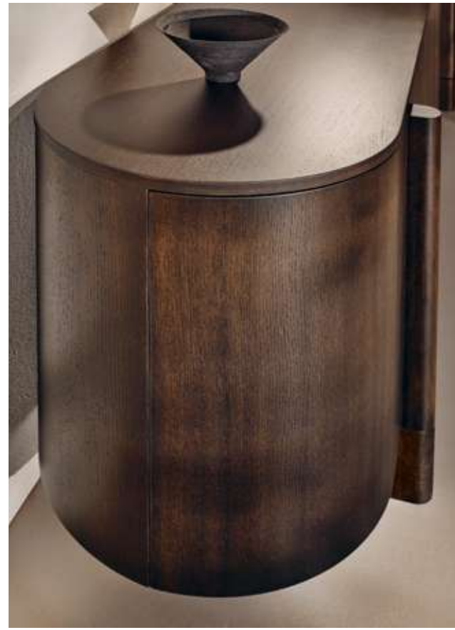
Dusk Madia in legno frassino moka. Eclipse Complemento con specchio e vetro cotto ambra.