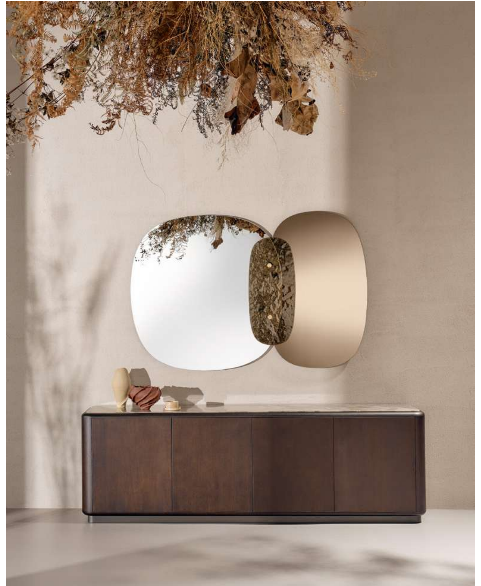
EN Pod Sideboard with moka ash wood structure, Camouflage marble top and brown metal base. Lagoon Complement with silver mirror, bronze mirror and bronze cast glass.