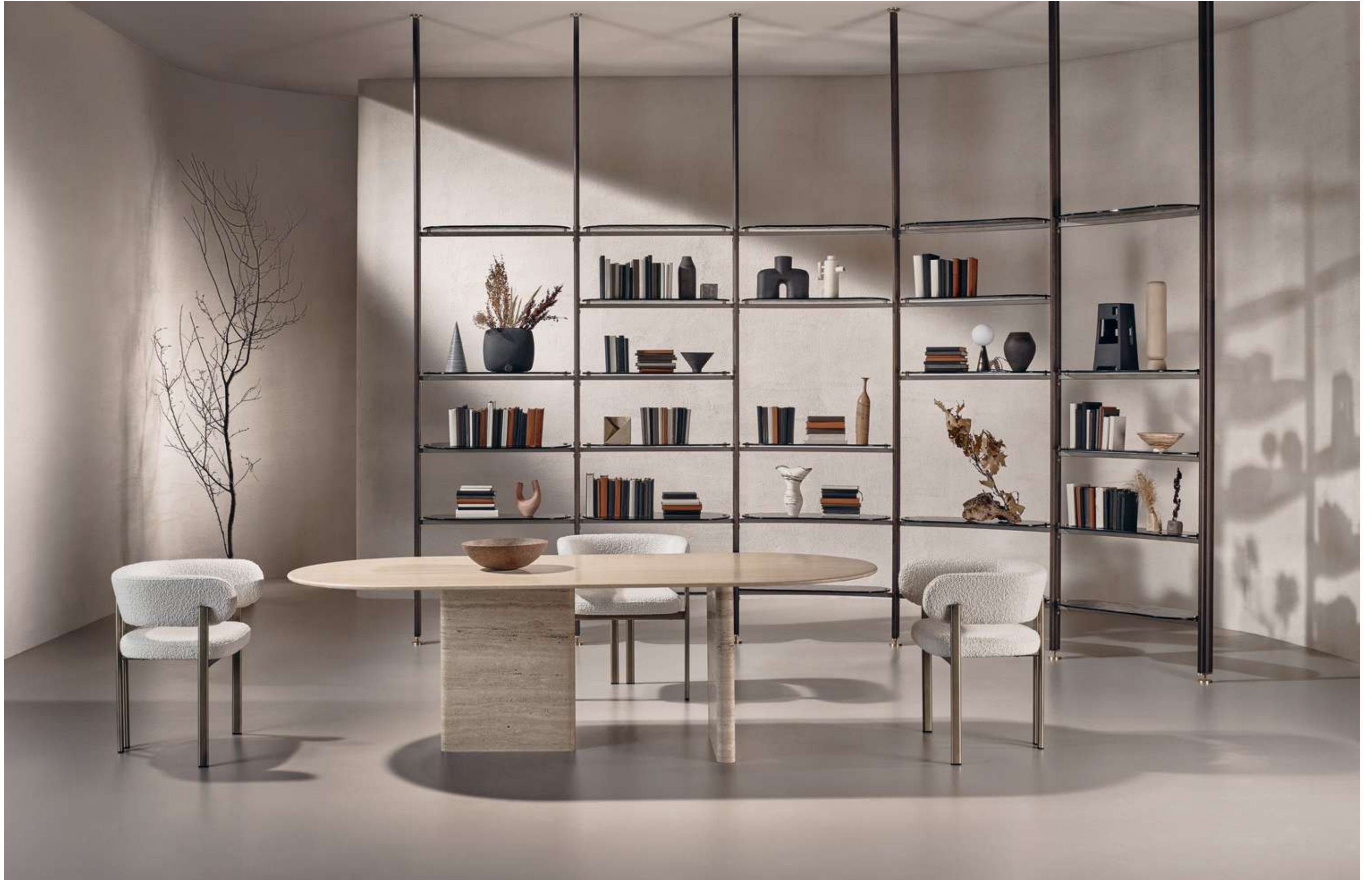
Monolith Tavolo, Table ; Bay Metal Armchair Seduta, Seating ; Stem Libreria, Bookshelf .