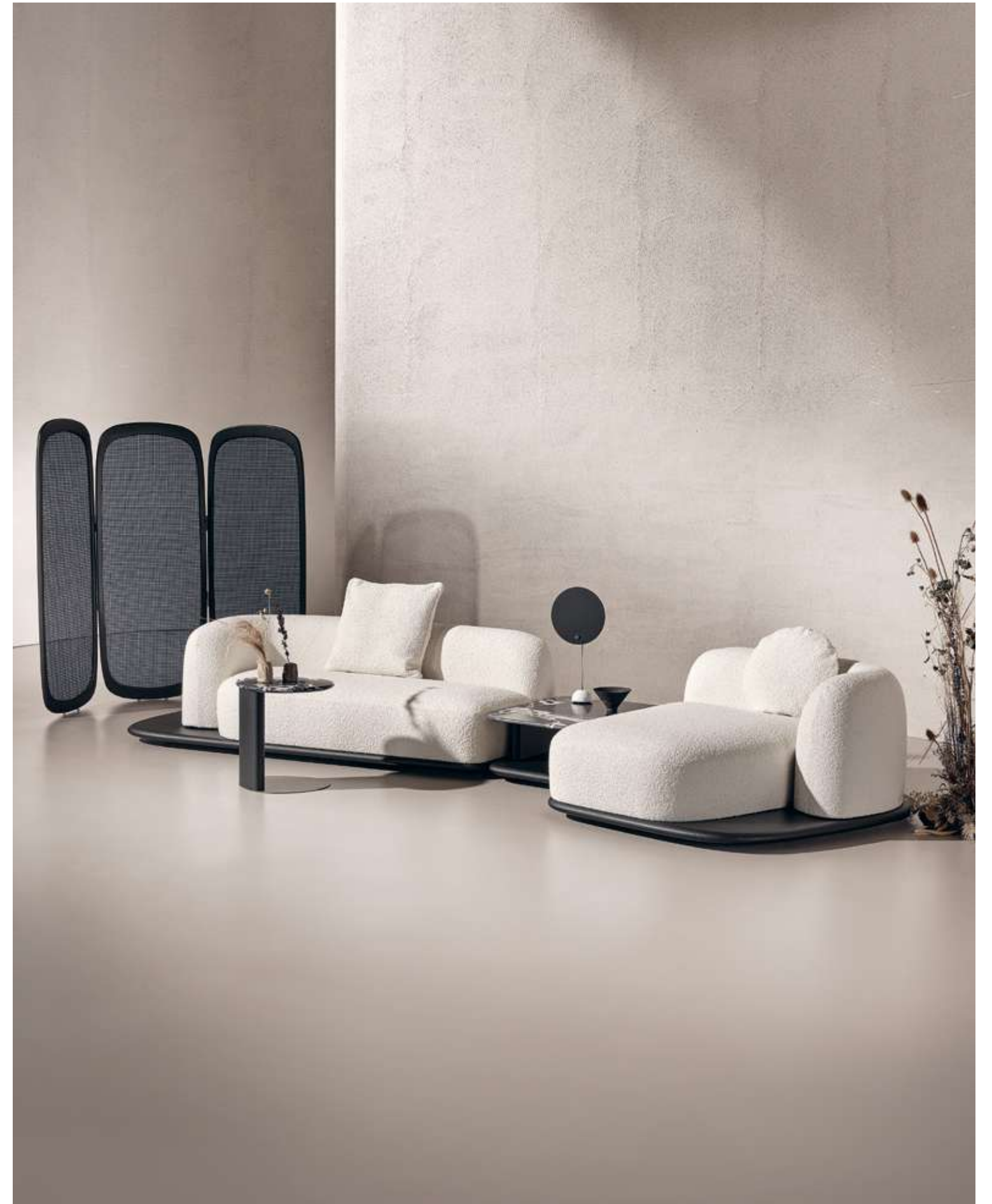
EN Dune Sofa in bouclè B01 fabric with absolute black ash wood base and coffee table and Nero antico marble top. Drop Coffee Table with absolute black ash wood structure, Nero antico marble top and luxor titanium metal base. Cloud Complement with absolute black ash wood structure and black Vienna straw.