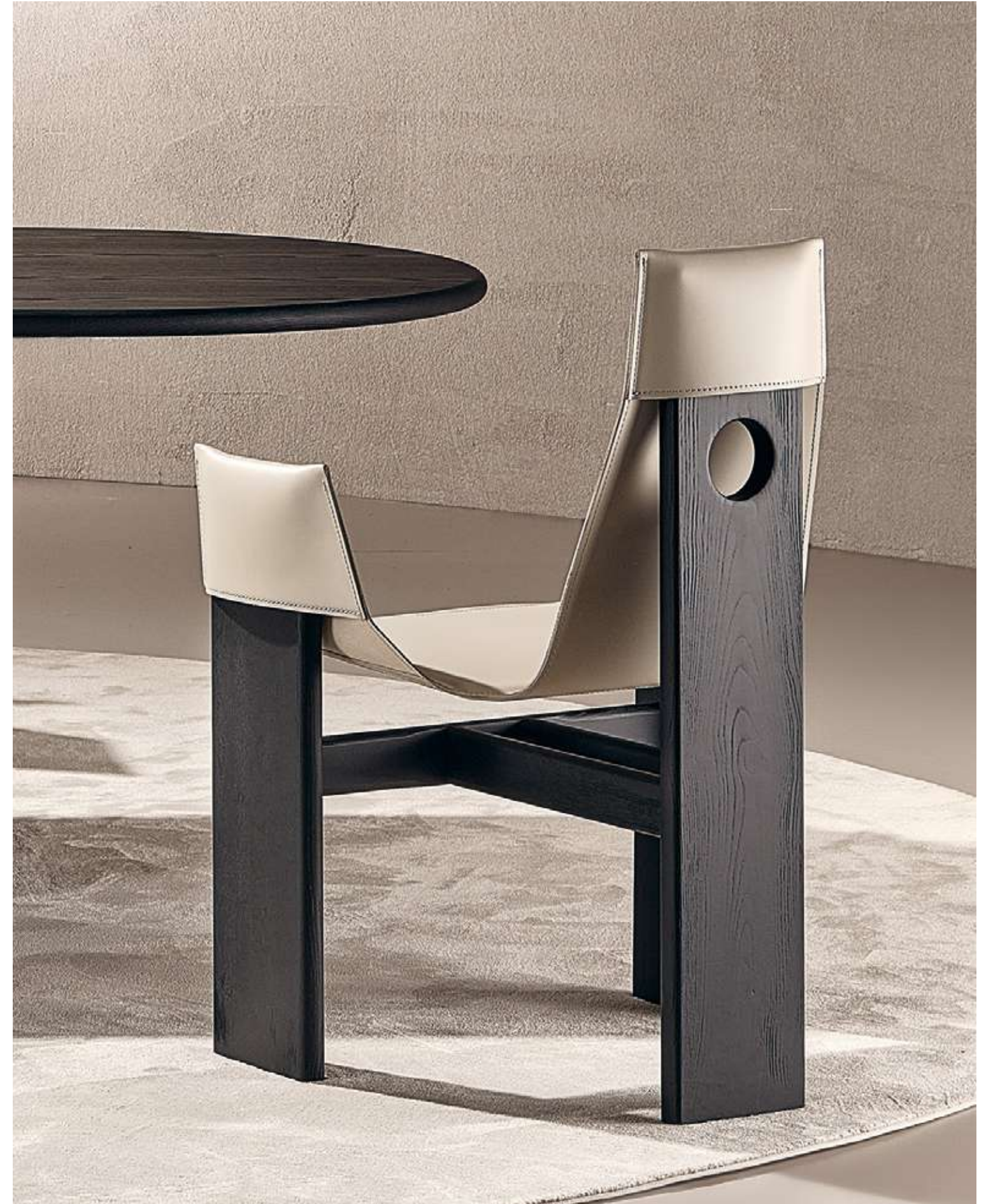
EN Manta Seating with absolute black ash wood structure and beige leather.