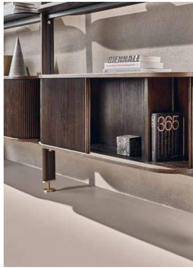
Stem Libreria con struttura in legno frassino moka e metallo brunito, contenitori in legno frassino moka e ripiani in vetro cotto bronzo e legno frassino moka.