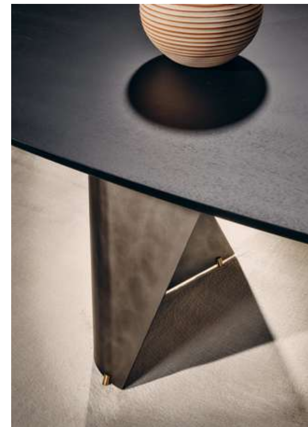
Blow Tavolo con top in legno frassino nero assoluto e base in metallo titanio luxor. Piedini in ottone opzionali. Bay Metal Seduta con struttura in metallo nero opaco e tessuto bouclé B10.