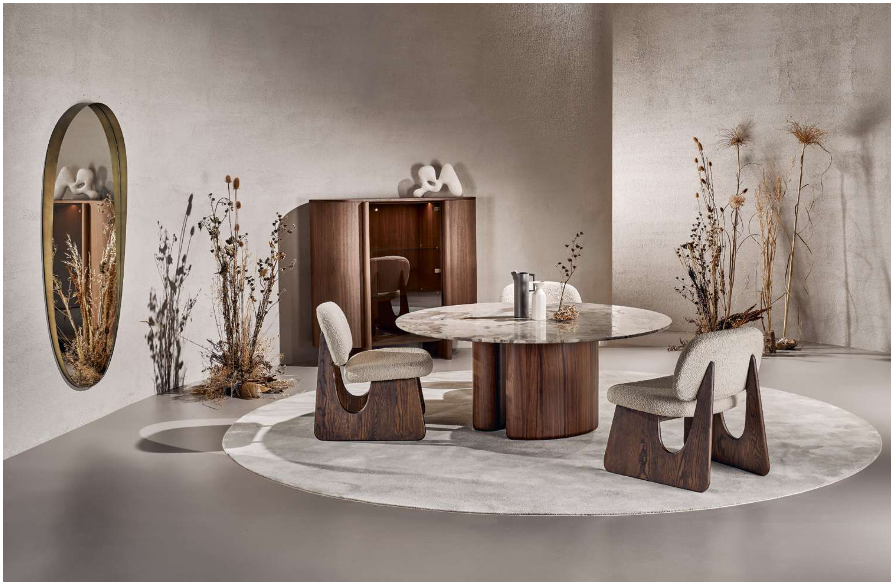
Twig Lounge Poltrona, Armchair ; Tide Lounge Tavolo, Table ; Dusk contromobile Madia, Sideboard ; Dew Complemento, Complement .