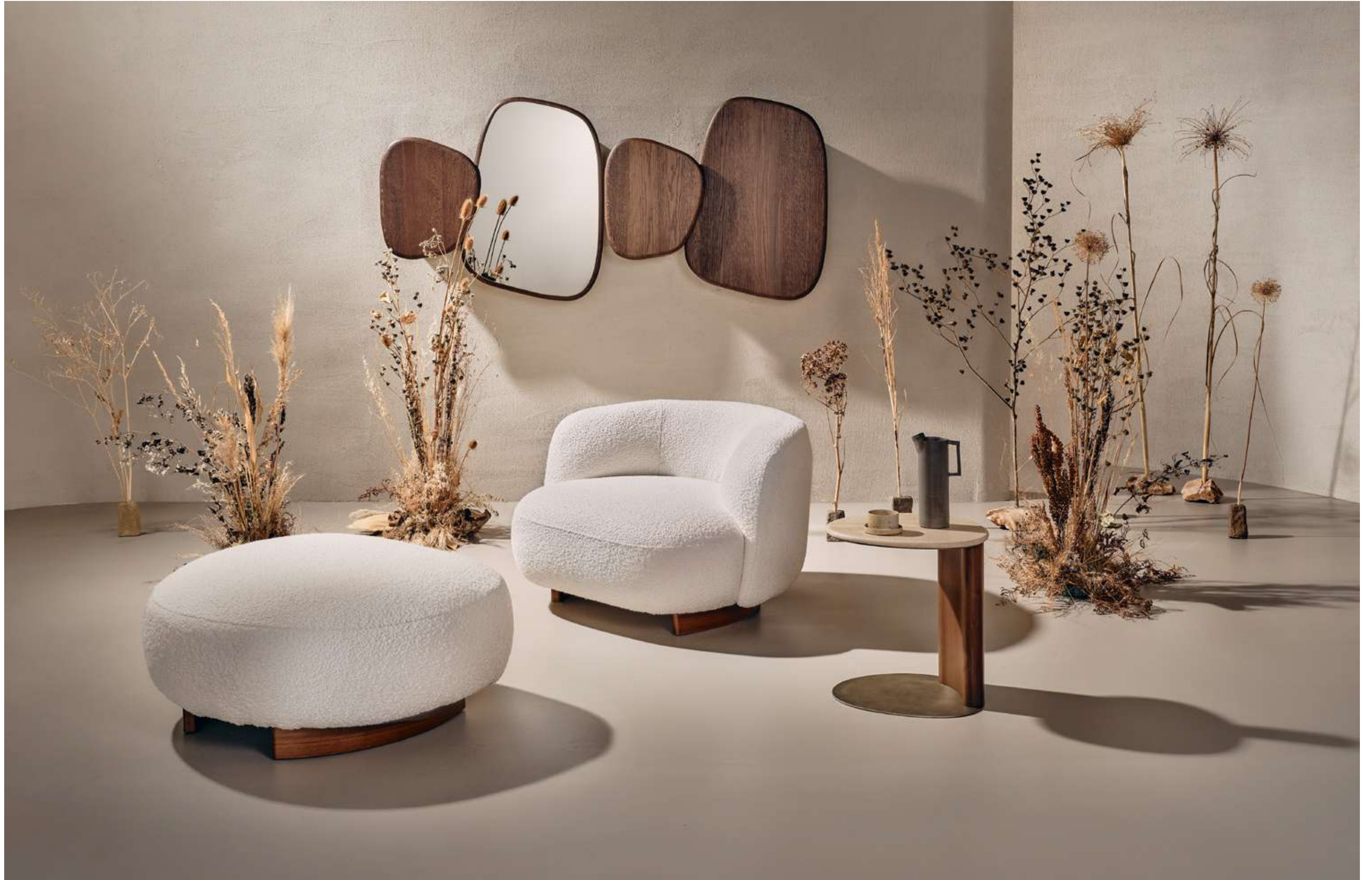
Soil Complemento, Complement ; Pebble Lounge Poltrone, Sofas; Drop Tavolino, Coffee Table .