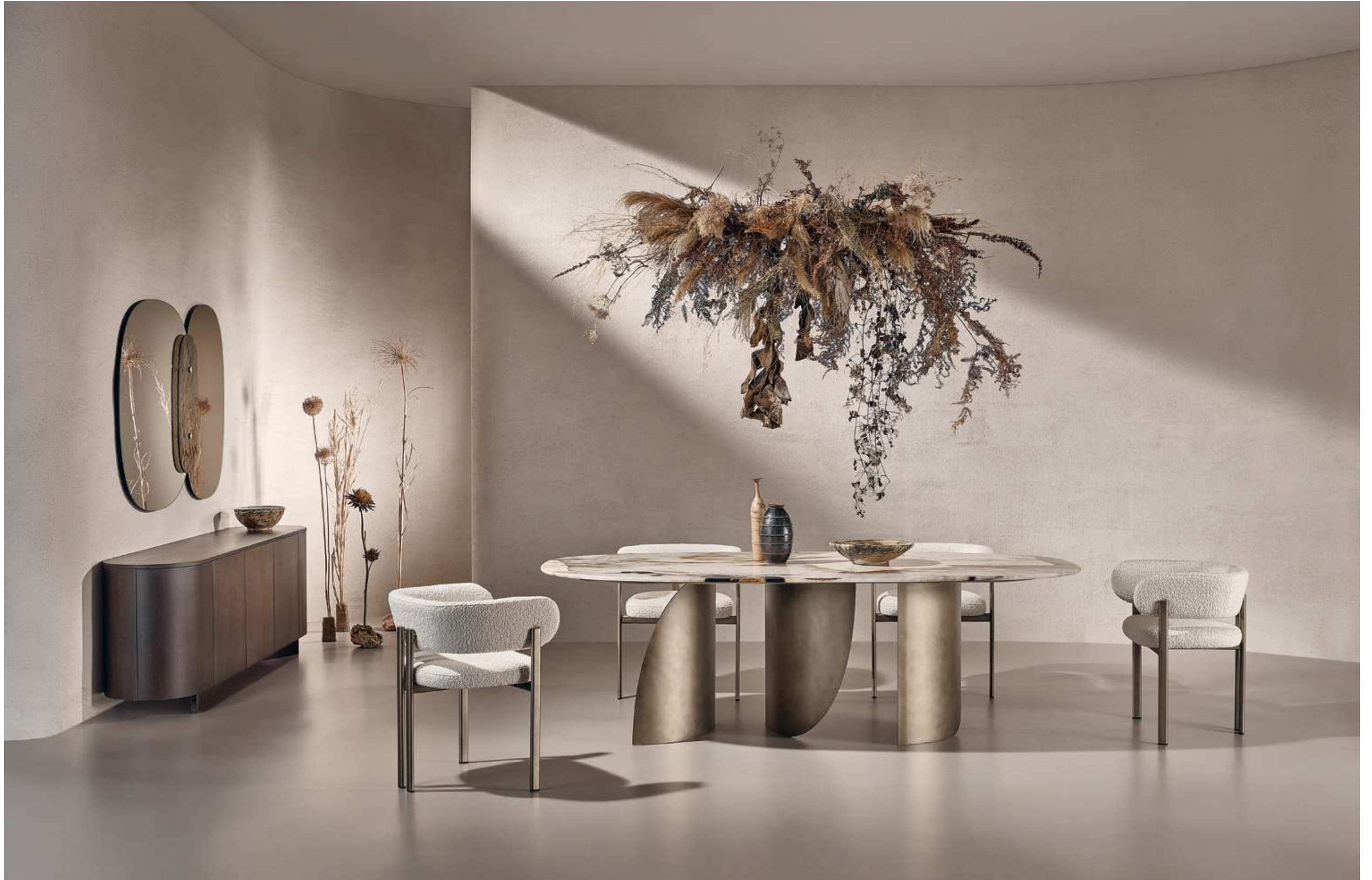
Sail Tavolo, Table ; Bay Metal Armchair Seduta, Seating ; Flow Madia, Sideboard ; Lagoon Complemento, Complement .