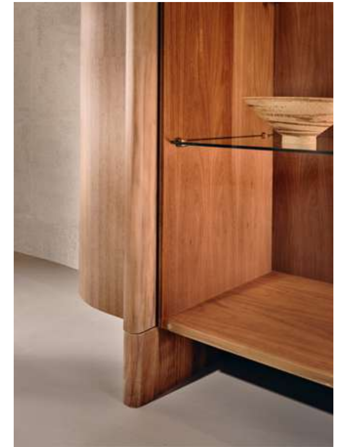
Dusk Contromobile Madia con struttura in noce americano e anta in vetro bronzo.