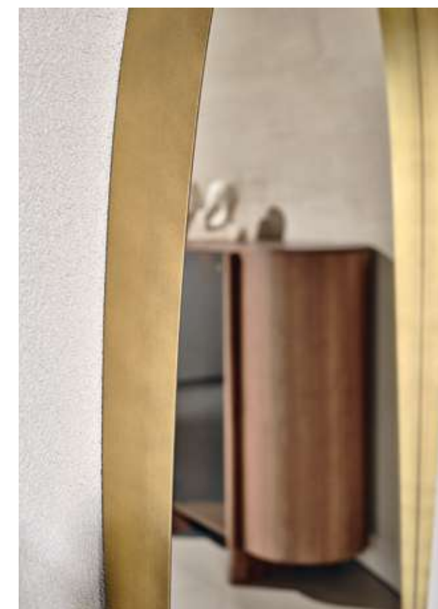
Dew Complemento con specchio e cornice in metallo oro luxor.