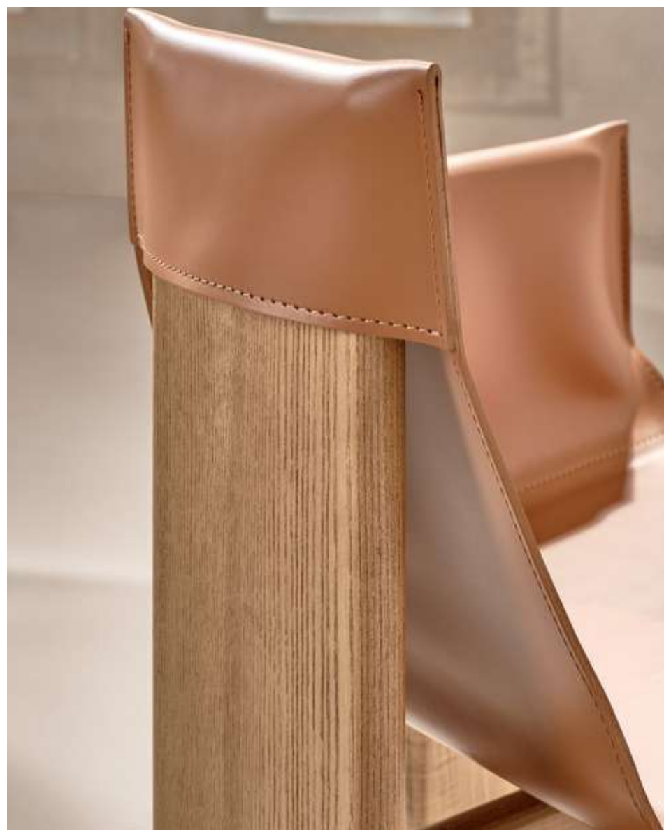
Manta Low Seduta con base in legno frassino caramello e cuoio cognac.