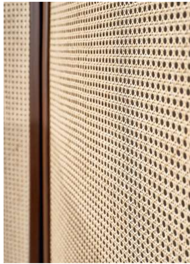
Cloud Complemento con struttura in legno frassino nero assoluto e tinta noce, inserti in paglia di Vienna nera e naturale.