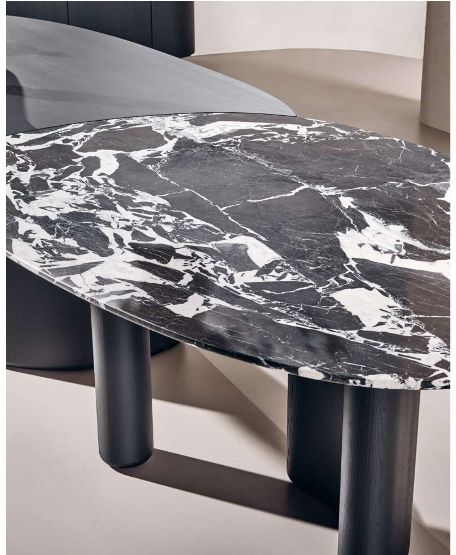
EN Lymph Big Table with absolute black ash wood and Nero antico marble top and bases.