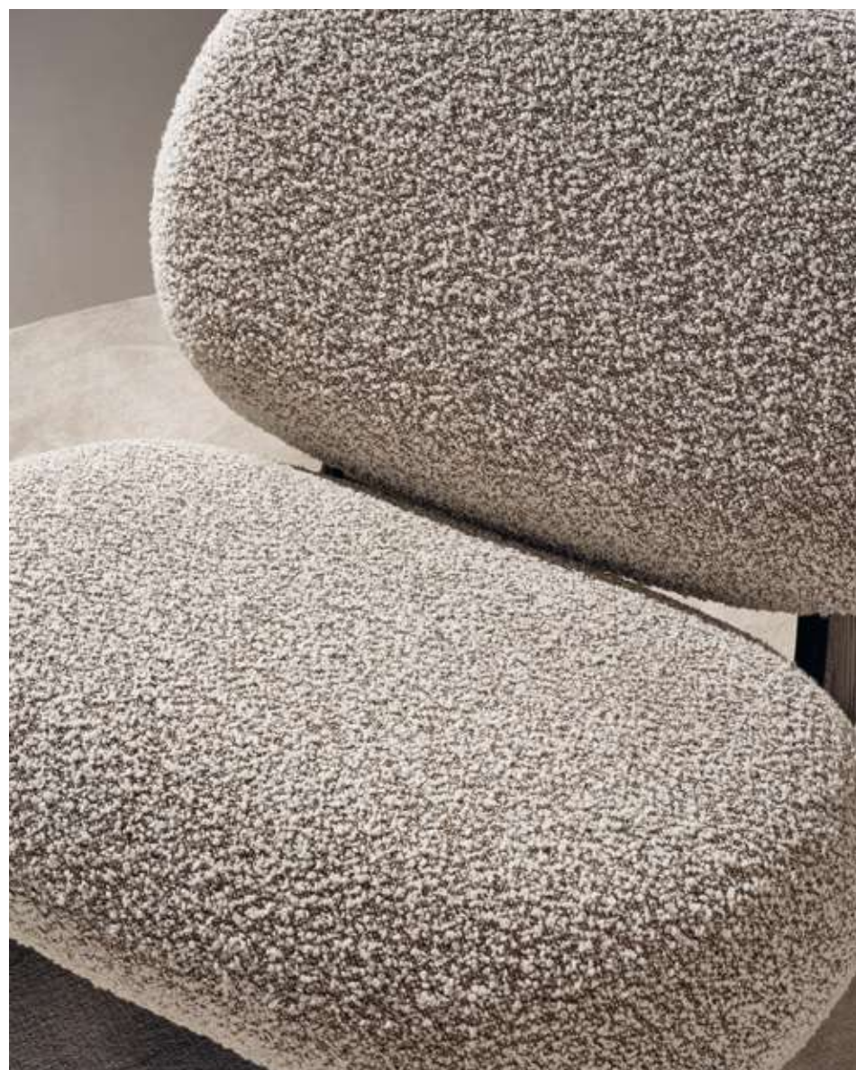
Twig Rocking Chair Poltrona con base in legno frassino tinta noce e tessuto bouclé B09.