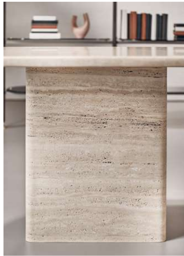
Monolith Tavolo con top e base in marmo Travertino. Bay Metal Armchair Seduta con base in metallo bronzo luxor e tessuto bouclé B01. Stem Libreria con struttura in legno frassino moka e metallo champagne e ripiani in vetro cotto fumè.