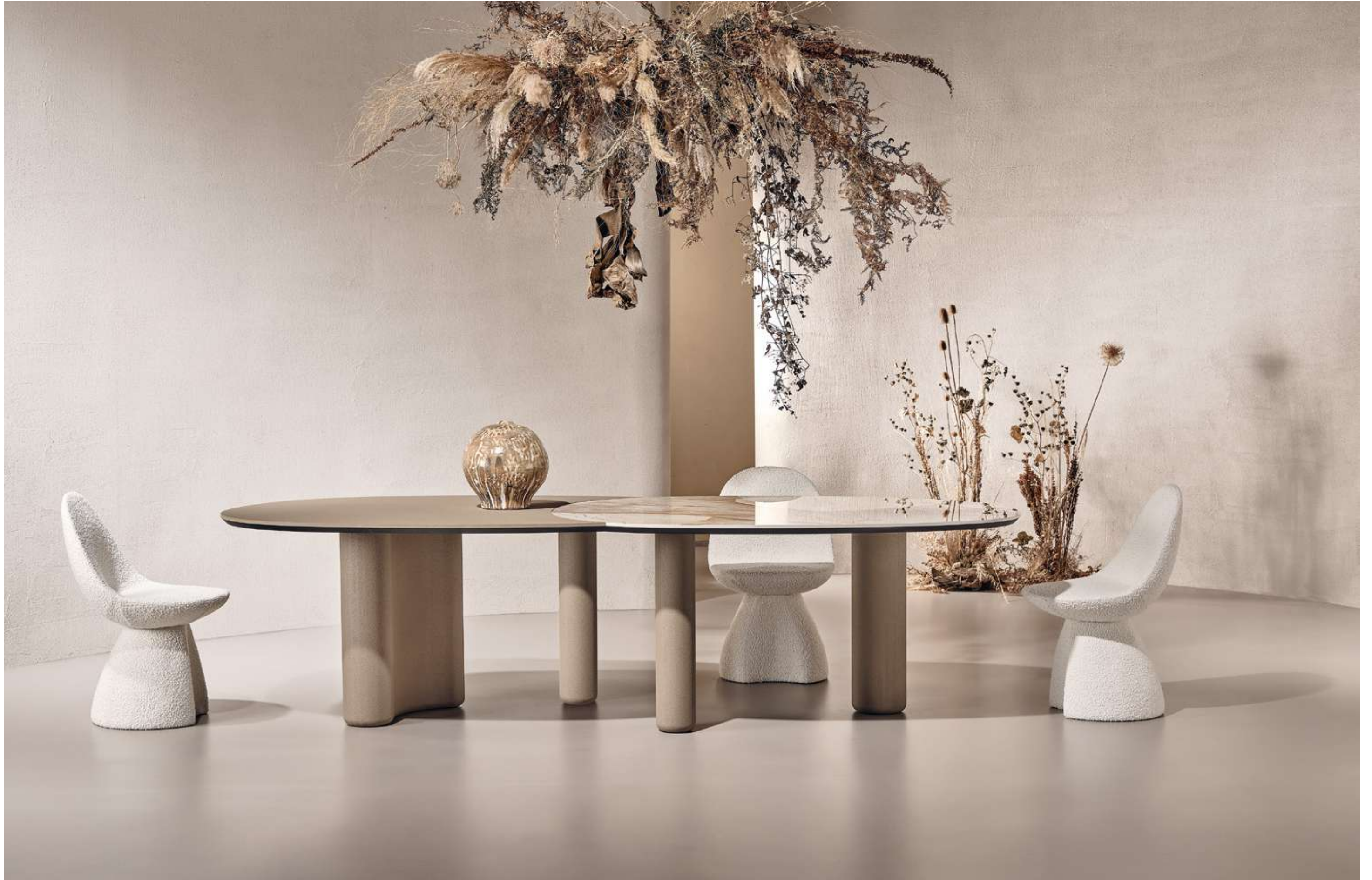
Lymph Large Tavolo, Table ; Nest Seduta, Seating .