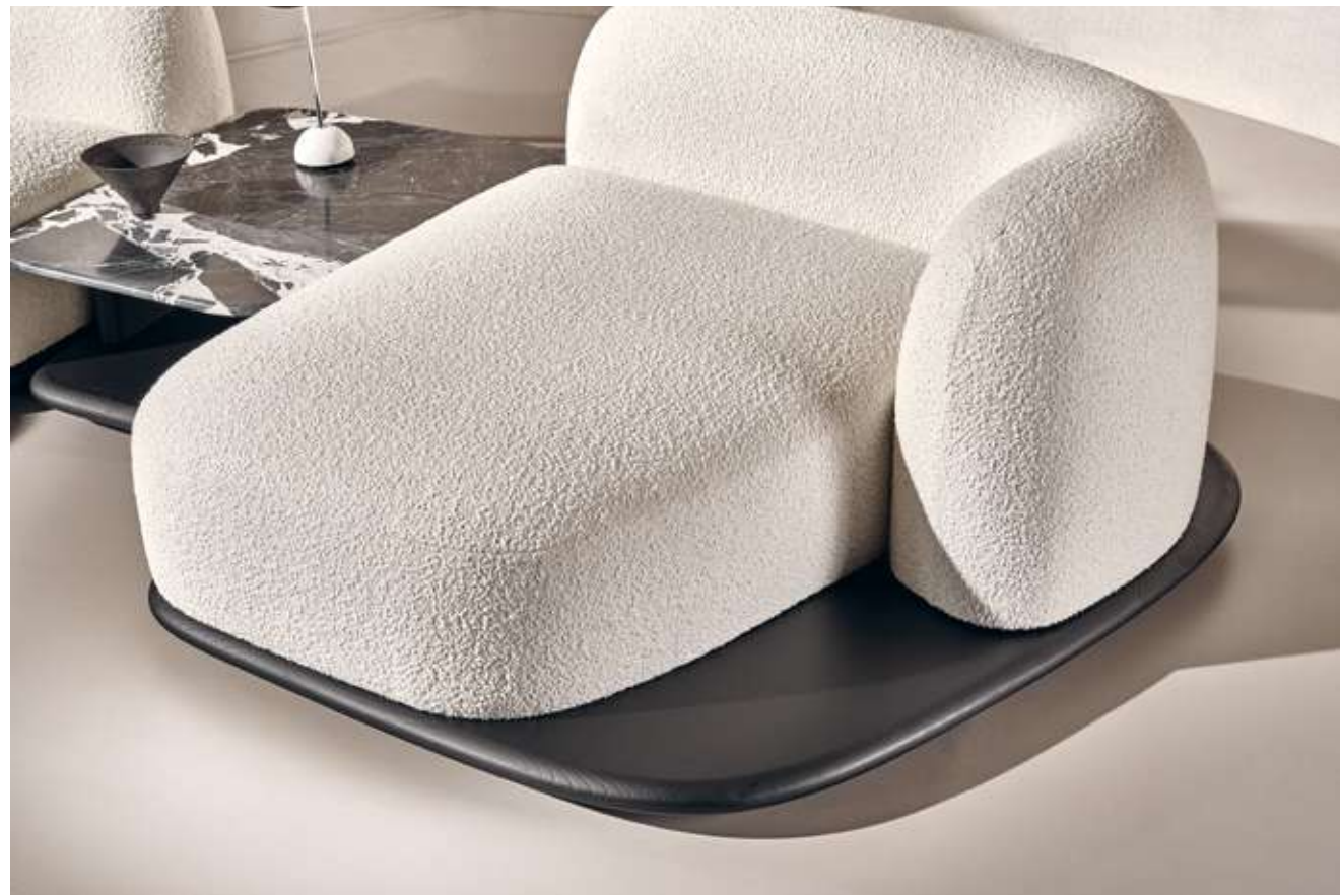
Dune Divano in tessuto bouclè B01, base e tavolino in legno frassino nero assoluto e top in marmo Nero antico. Drop Tavolino con struttura in legno frassino nero assoluto, top in marmo Nero antico e base in metallo titanio luxor. Cloud Complemento con struttura in legno frassino nero assoluto e paglia di Vienna nera.