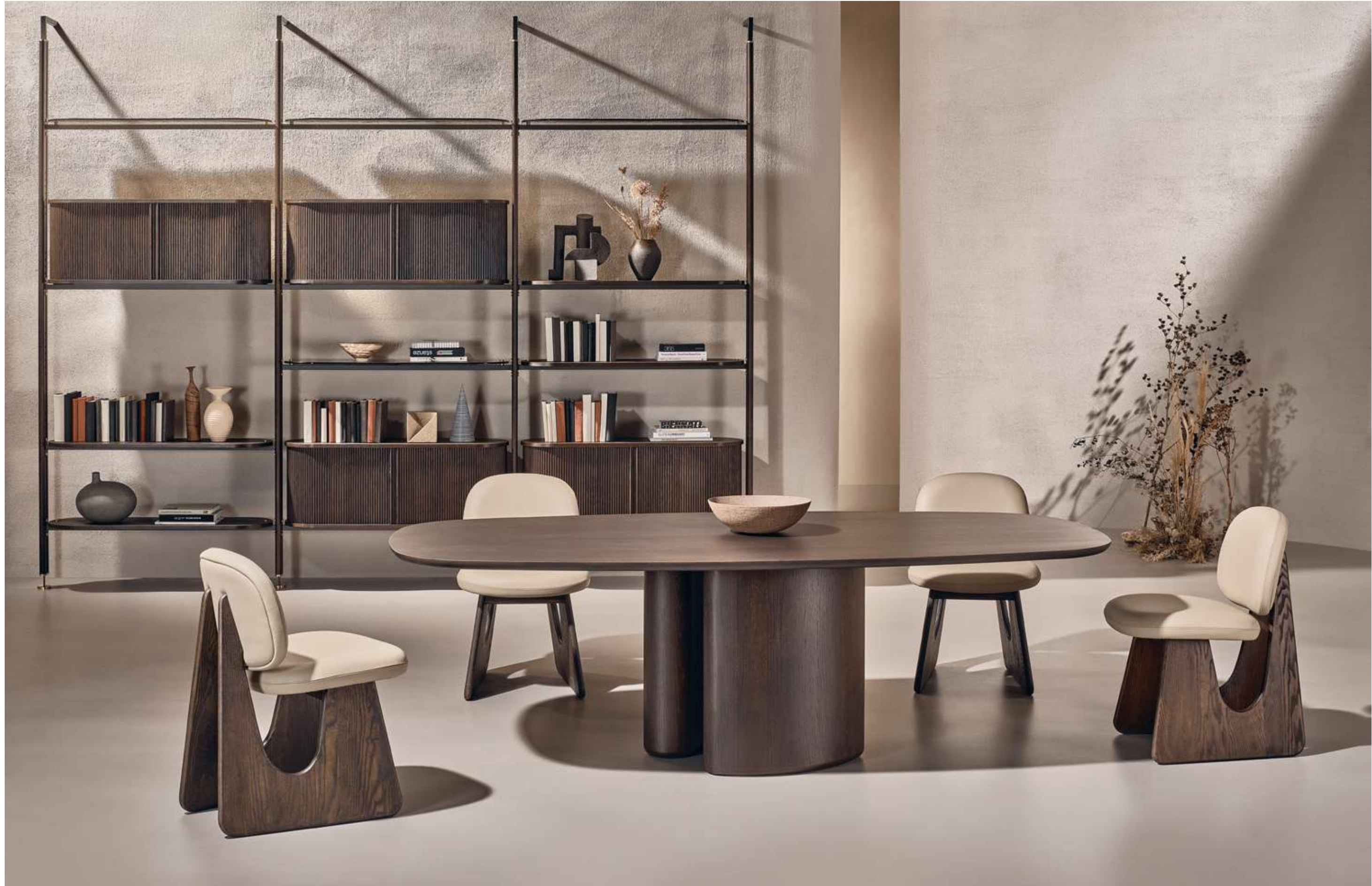
Tide Tavolo, Table ; Twig Seduta, Seating Stem Libreria, Bookshelf .