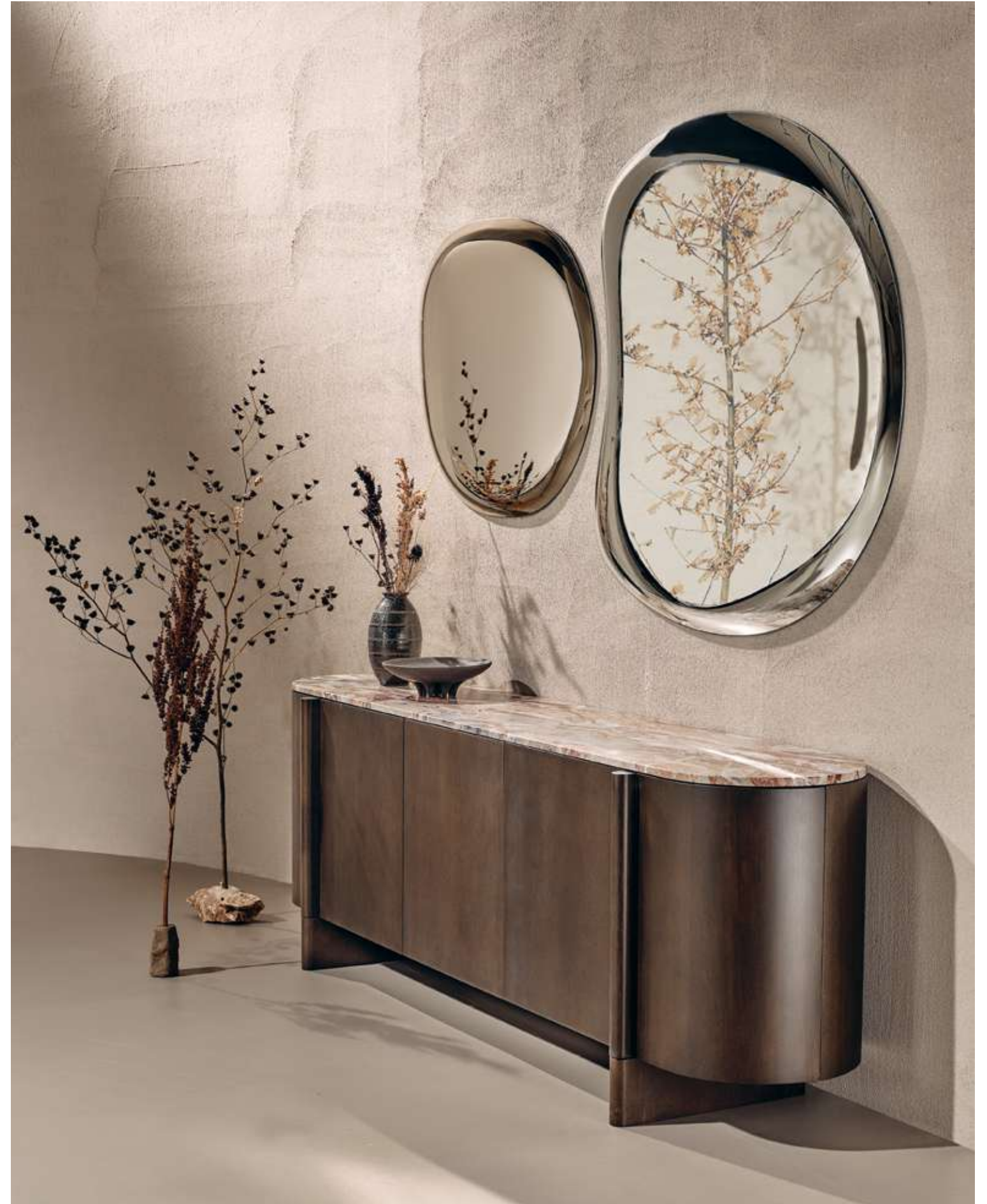
EN Dusk Sideboard in moka ash wood. Eclipse Complement with mirror and amber cast glass.