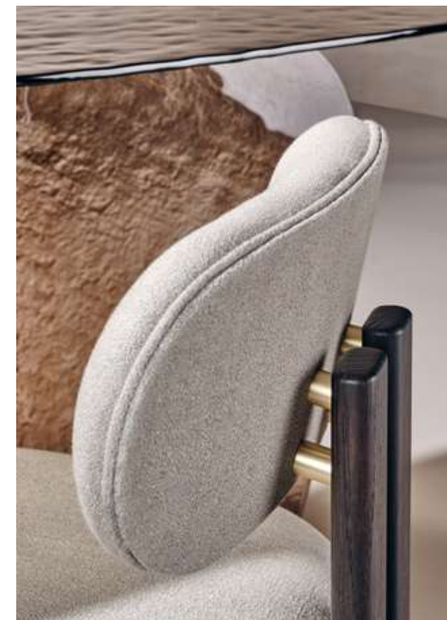
Bay Wood Seduta con struttura in legno frassino moka e tessuto Twill TW01. Blur Tavolo con top e base in vetro cotto bronzo.