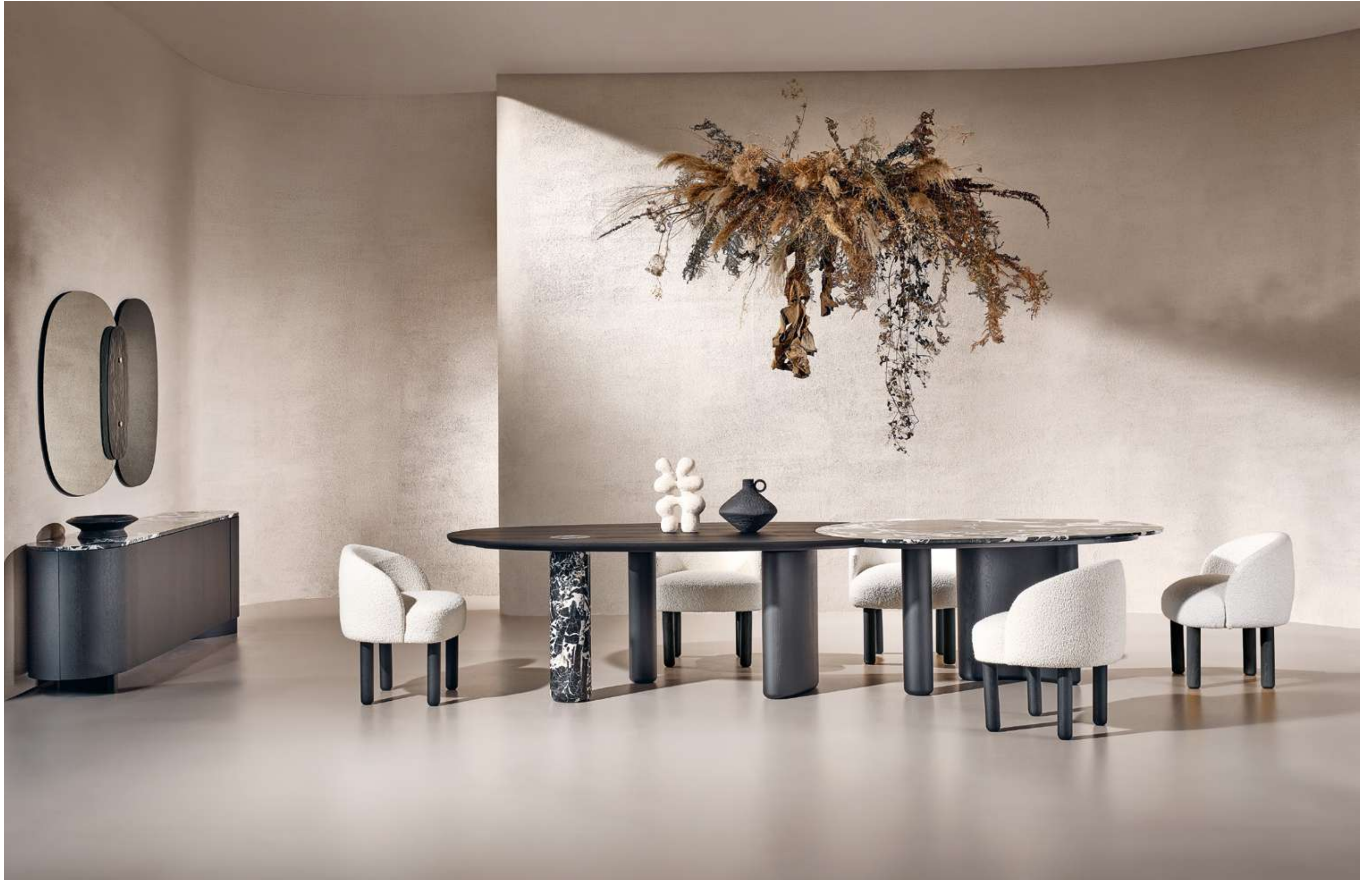
Lymph Big Tavolo, Table ; Pebble Seduta, Seating ; Flow Madia, Sideboard ; Lagoon Complemento, Complement .