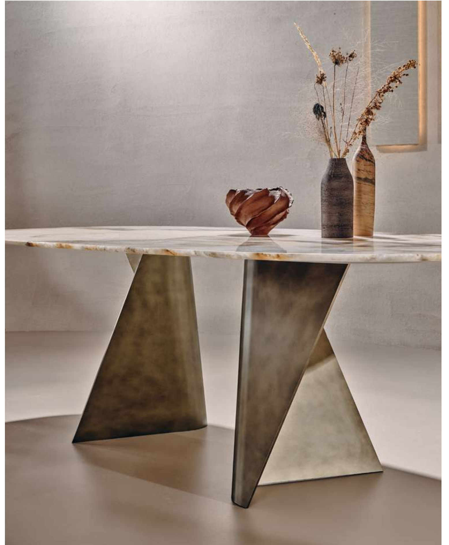
EN Blow Table with Patagonia marble top and luxor bronze metal base.