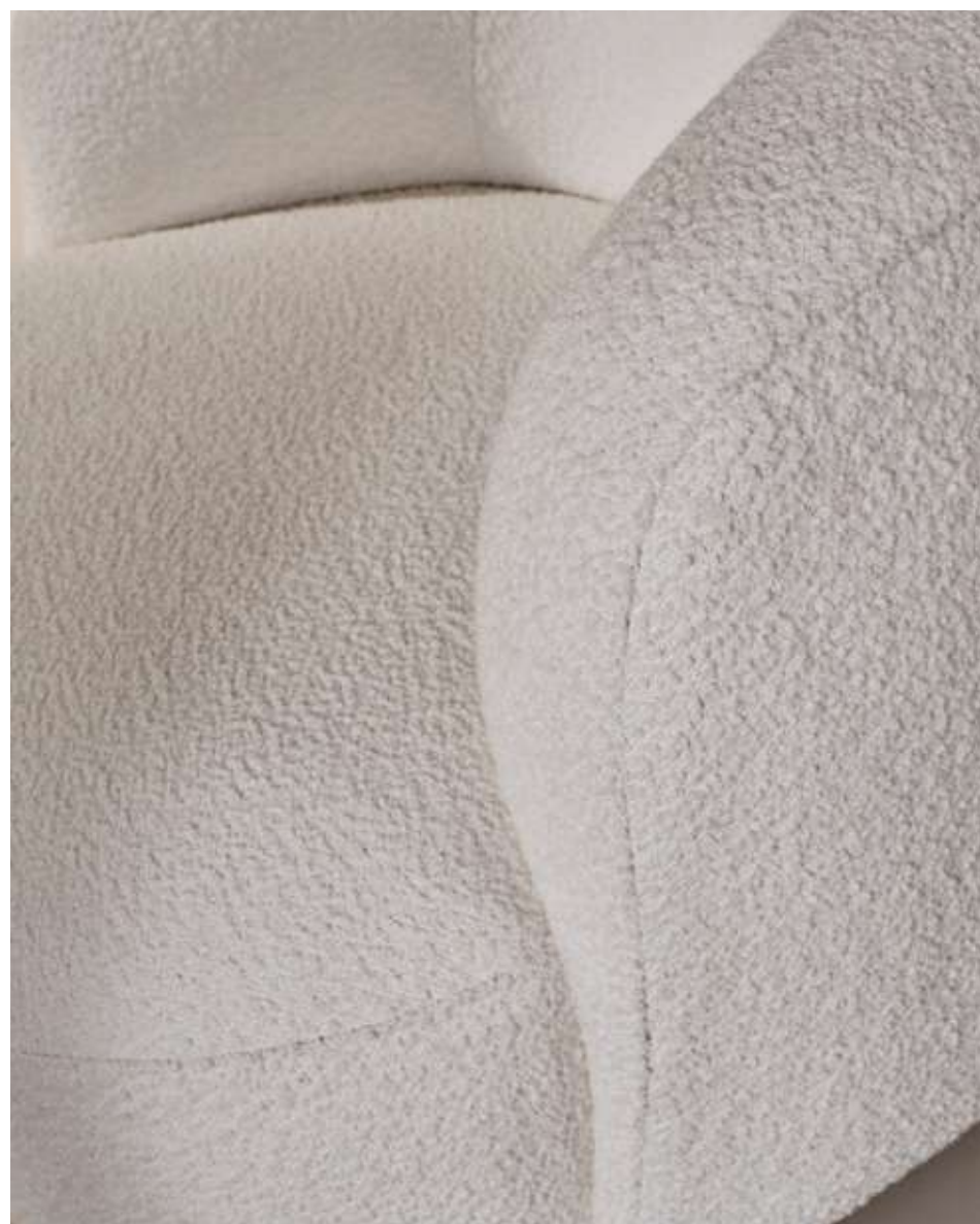
Pebble Lounge Poltrona in tessuto bouclé B01 e base in noce americano.