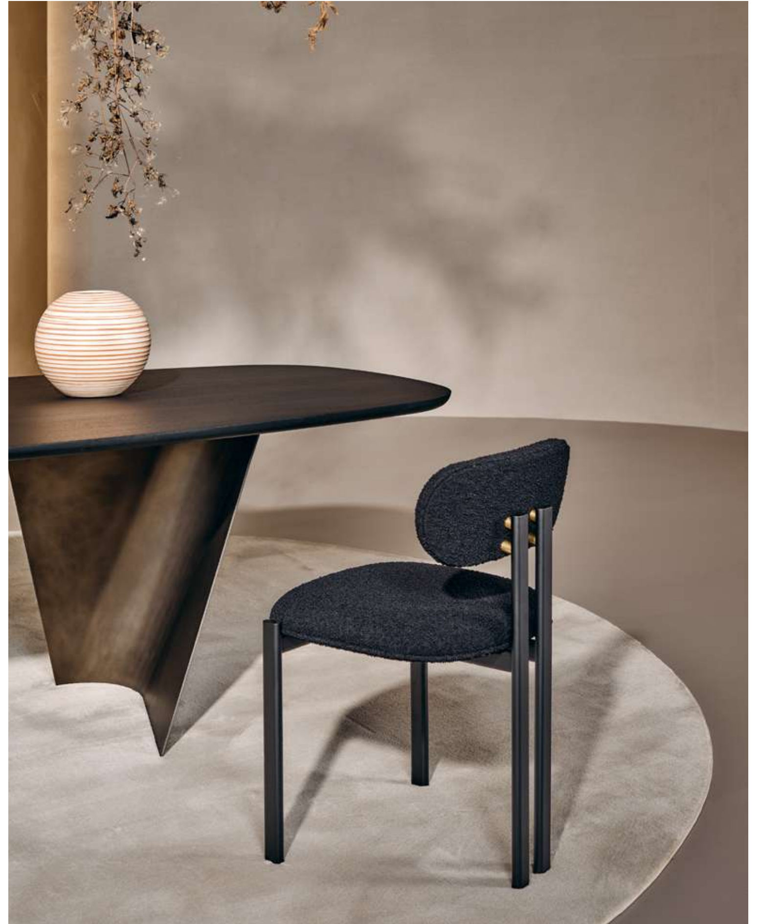
EN Bay Metal Seating with matt black metal structure and bouclé B10 fabric.