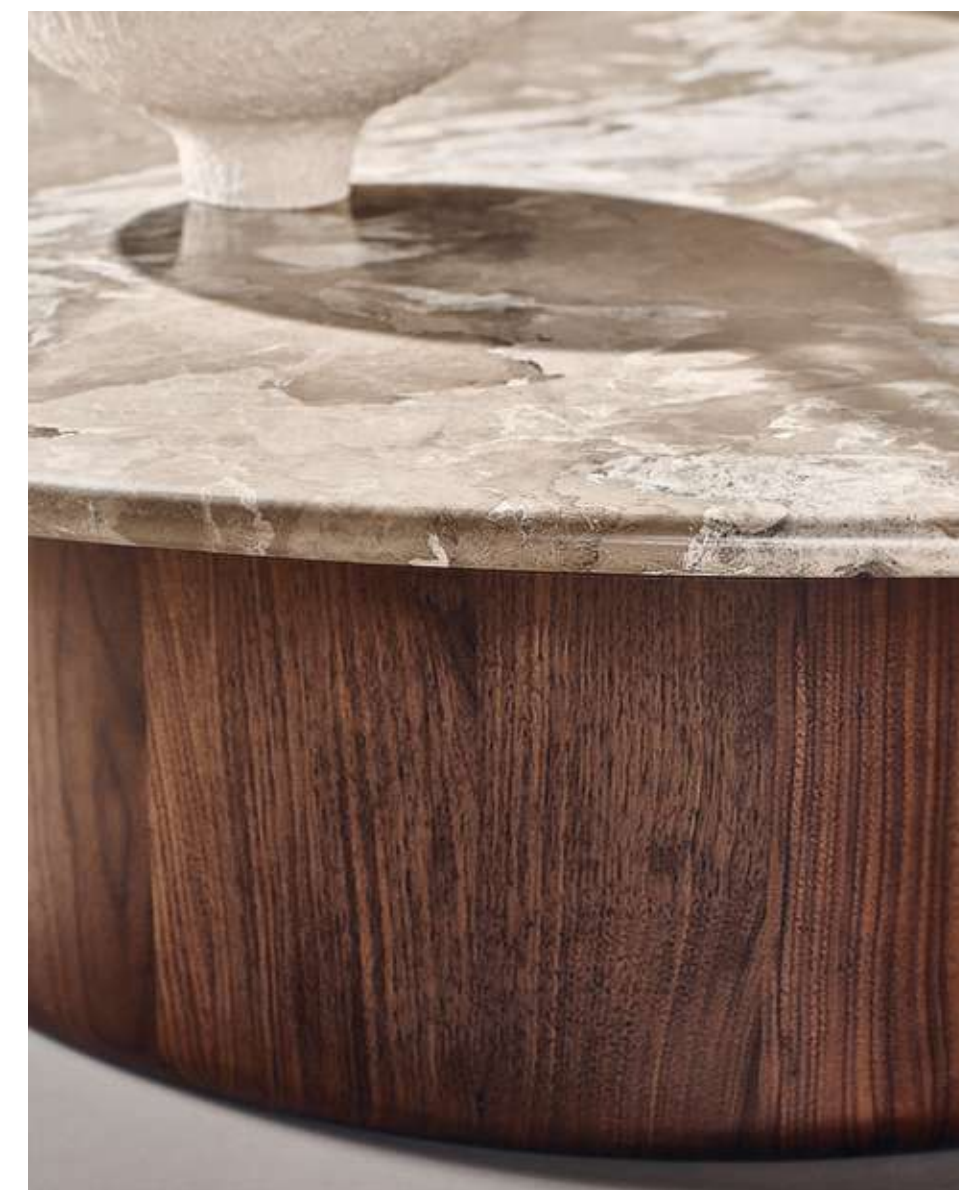
Lake Tavolino con top in marmo Camouflage e base in noce americano. Dune Divano in tessuto bouclè B01 e base in legno frassino tinta noce.