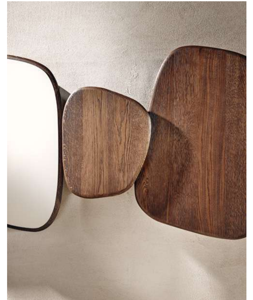
Soil Complemento con struttura in legno frassino moka e specchio bronzo.