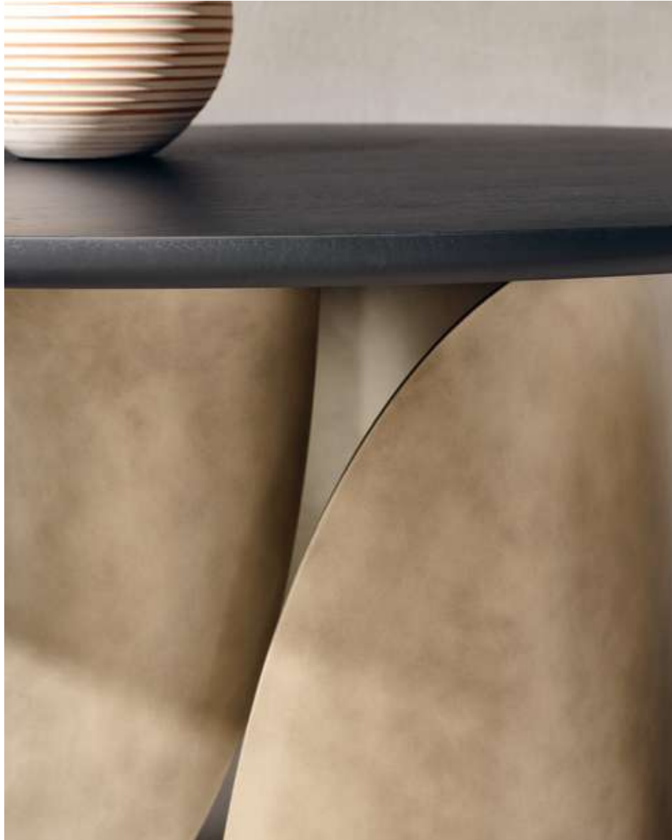
Sail Round Tavolo con top in legno frassino nero assoluto e base in metallo titanio luxor. Origin Seduta in tessuto bouclé B02.