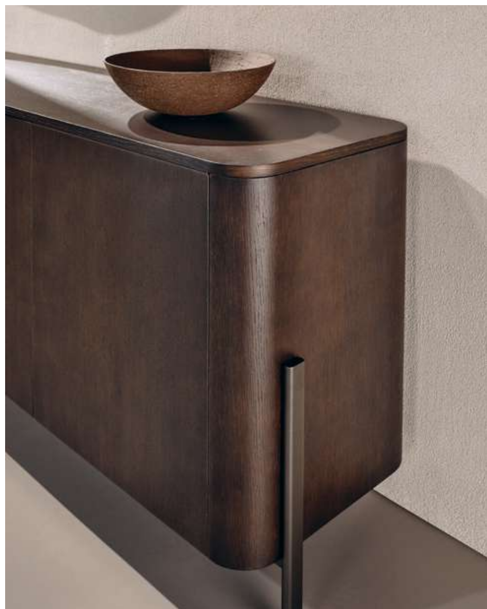
Shell Madia con struttura e top in legno frassino moka e base in metallo brunito. Dew Complemento con specchio e cornice in metallo champagne.