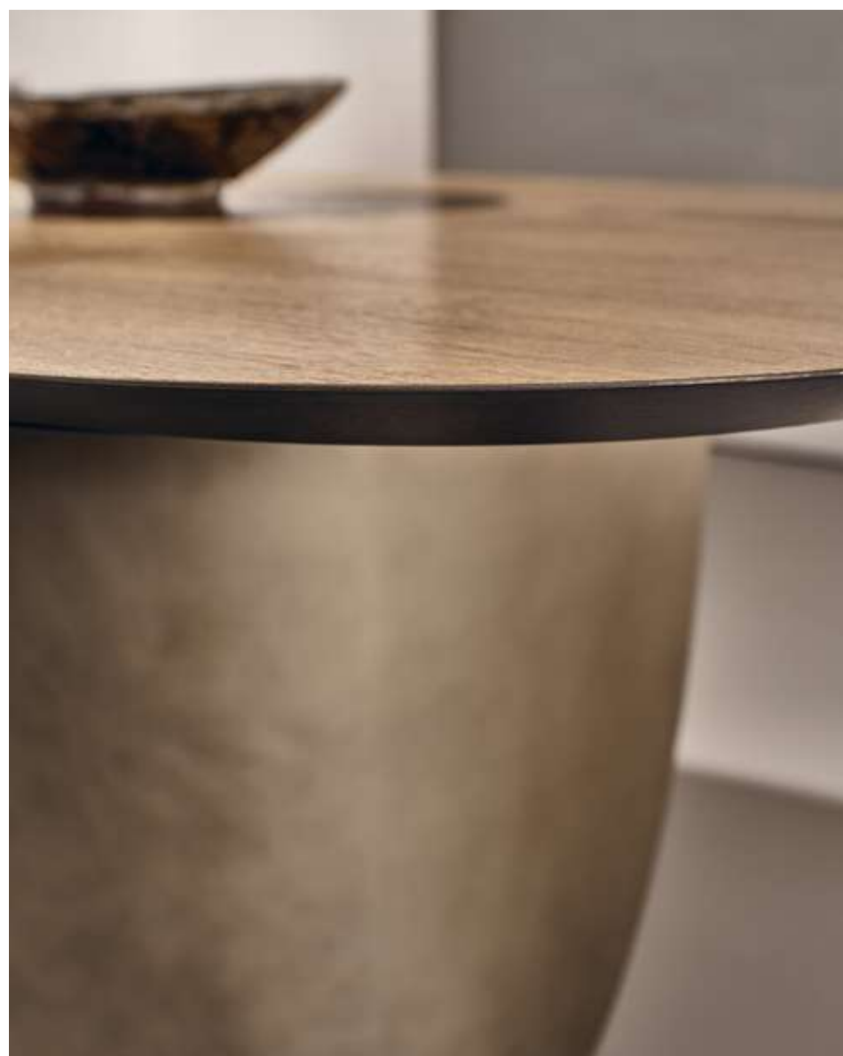
Sail Tavolo con top in frassino caramello e base in metallo bronzo luxor.