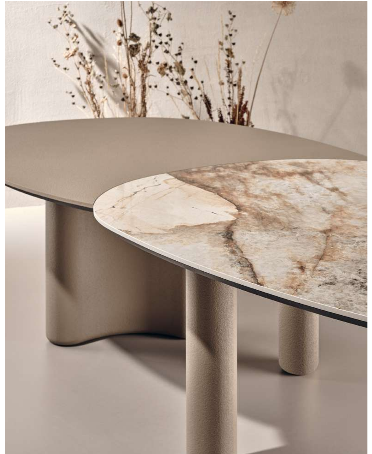
Lymph Large Table with Patagonia ceramic top and mud material finish top and bases.