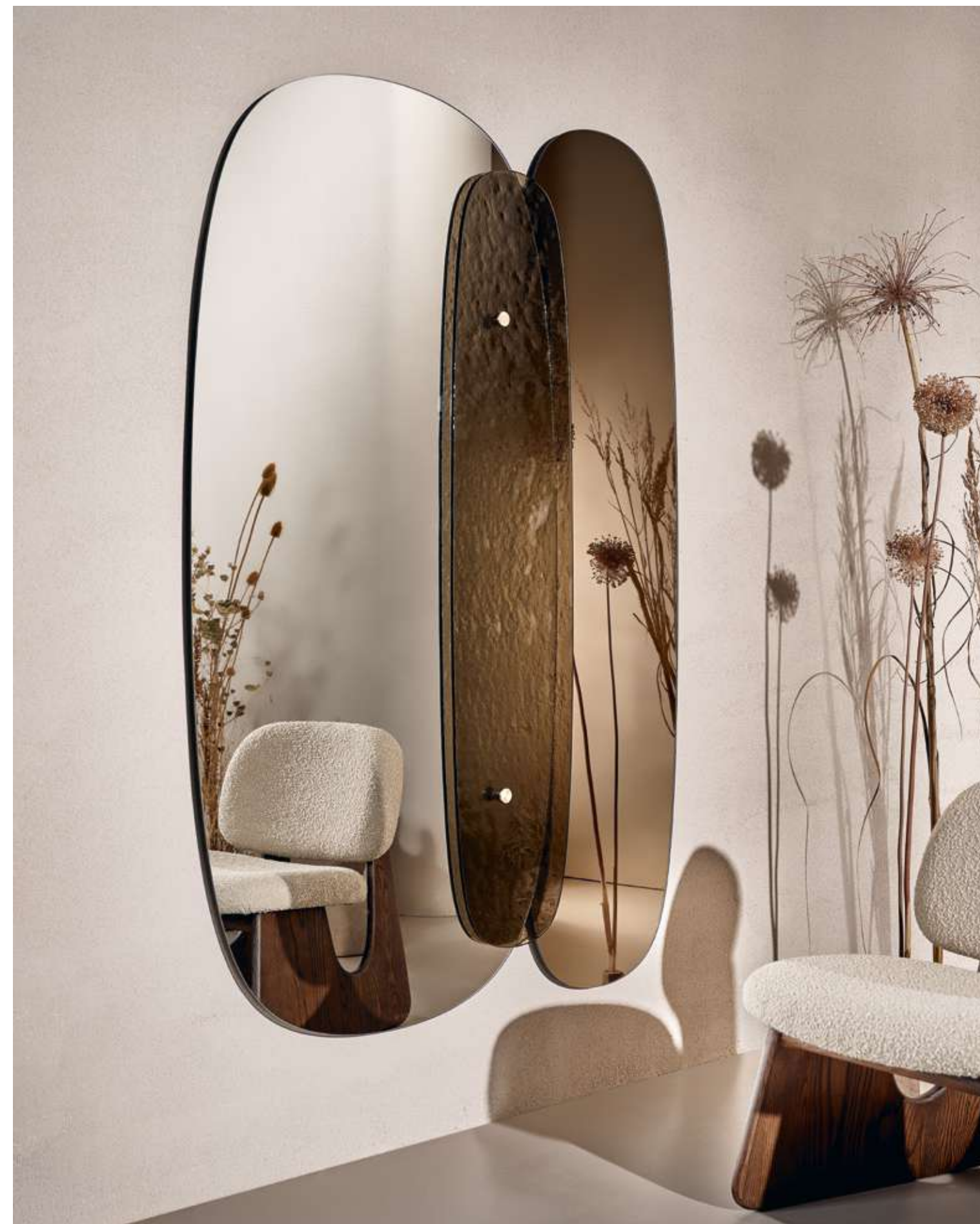
EN Lagoon Complement with silver mirror, bronze mirror and bronze cast glass.