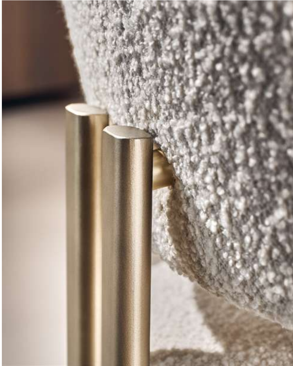
Bay Metal Armchair Seduta con base in metallo bronzo luxor e tessuto bouclé B01.