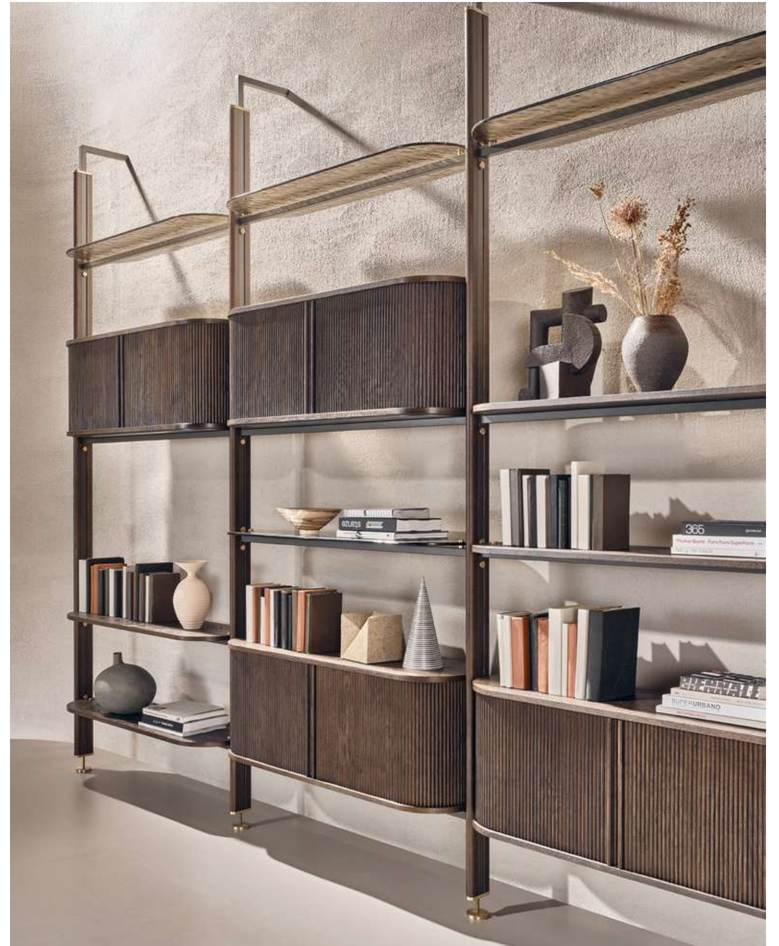
EN Stem Bookshelf with moka ash wood and brown metal structure, moka ash wood boxes and bronze cast glass and moka ash wood shelves.