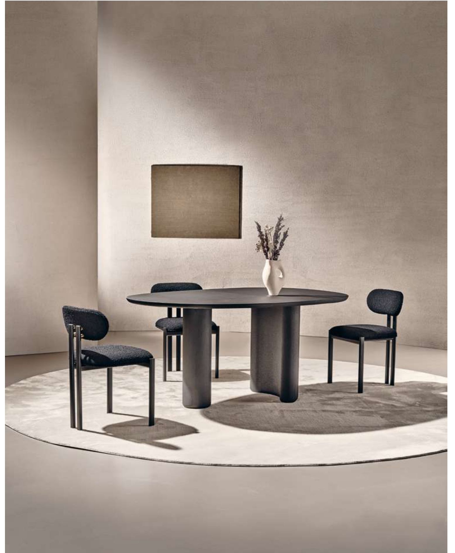
EN Lymph Small Table with black material finish top and base. Bay Metal Seating with matt black metal structure and bouclè B10 fabric.