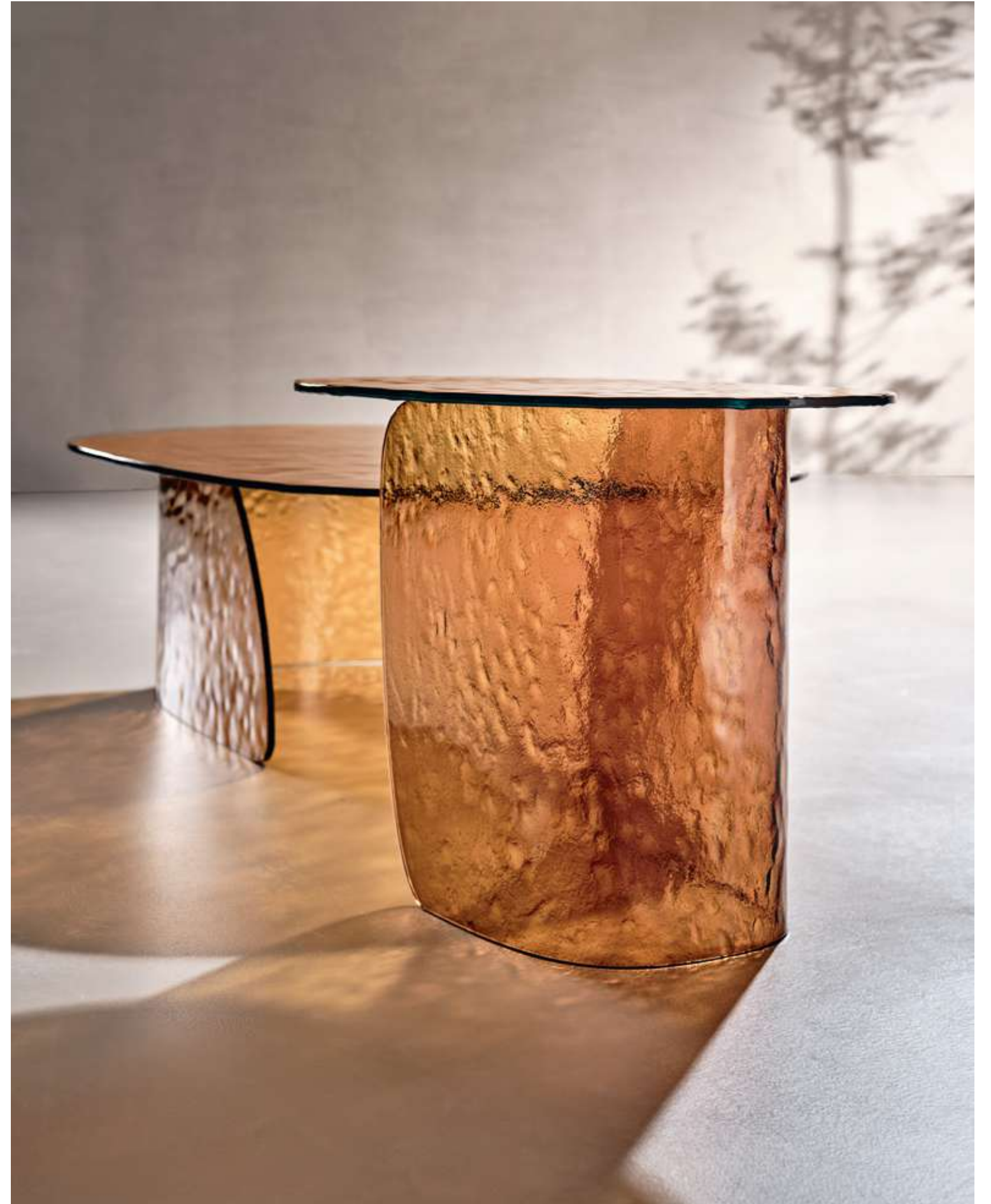
EN Blur Coffee Table Coffee Tables in amber cast glass.