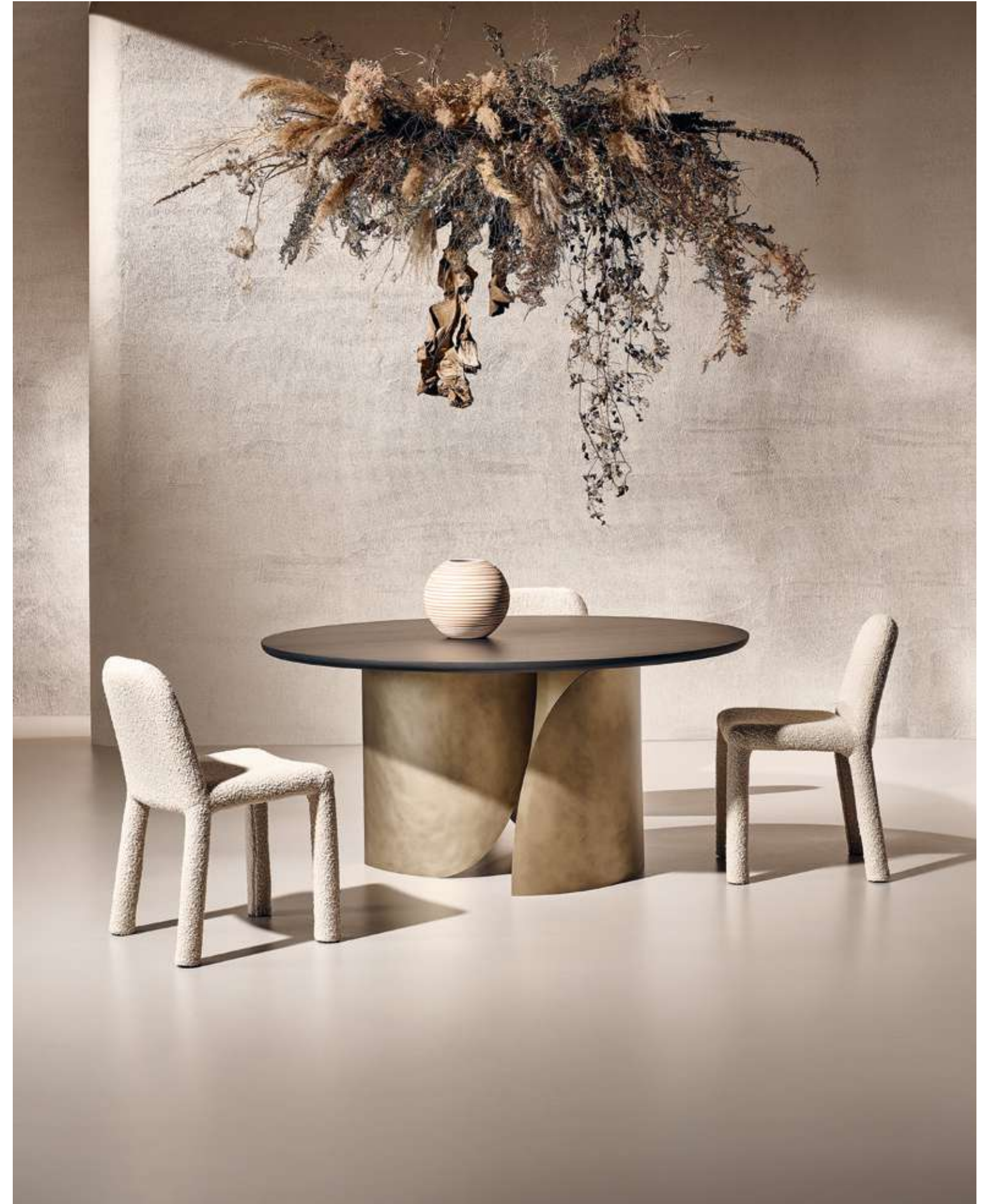
EN Sail Round Table with absolute black ash wood top and luxor titanium metal base. Origin Seating in bouclé B02 fabric.