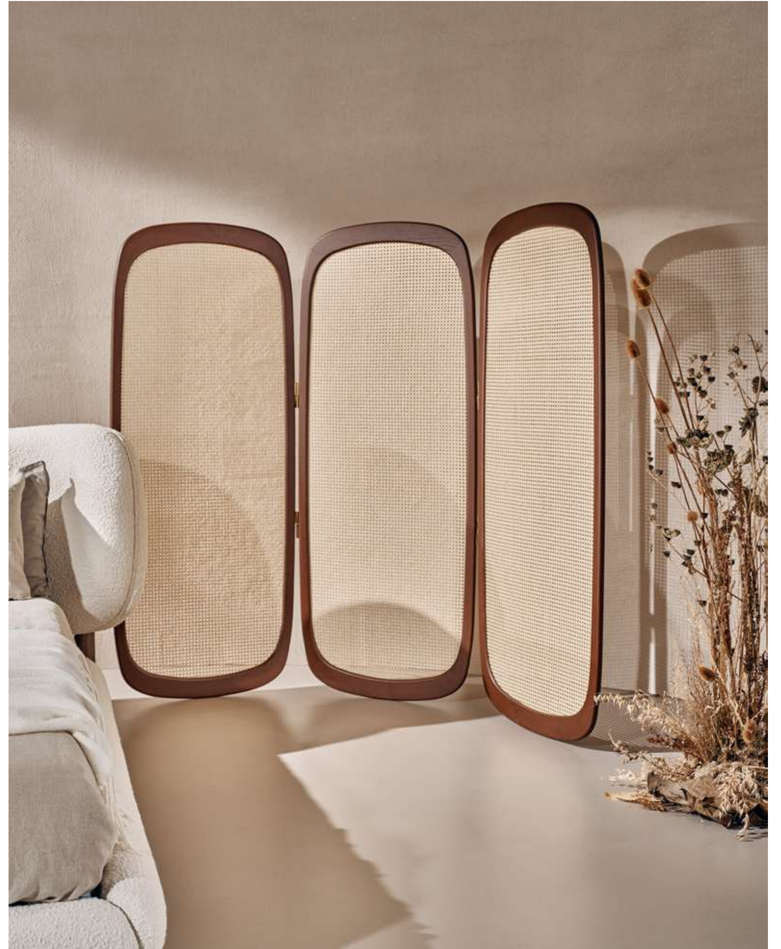
EN Cloud Complement with absolute black and walnut color ash wood, insert in black and natural Vienna straw.