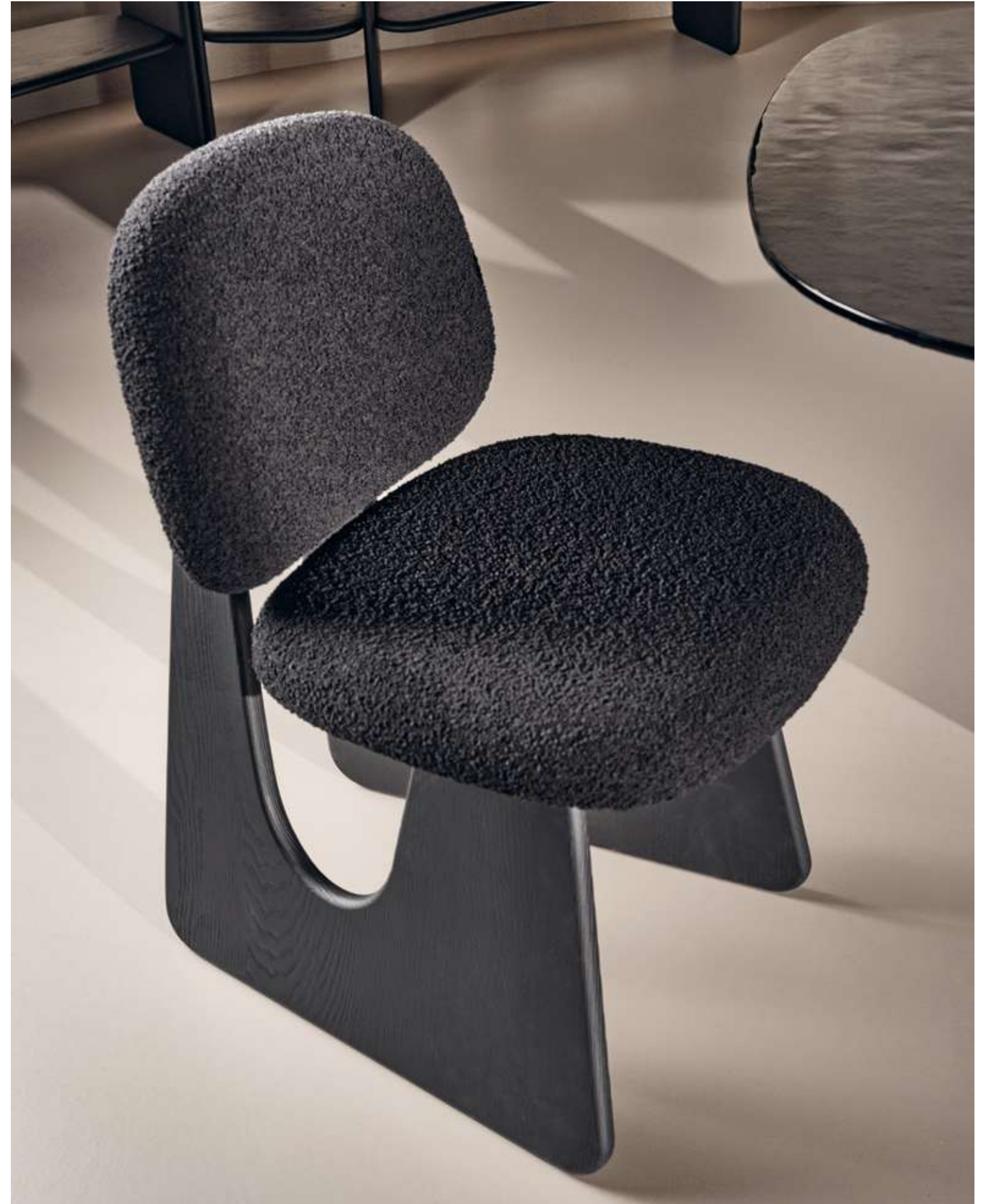
EN Twig Seating with absolute black ash wood structure and bouclé B10 fabric.