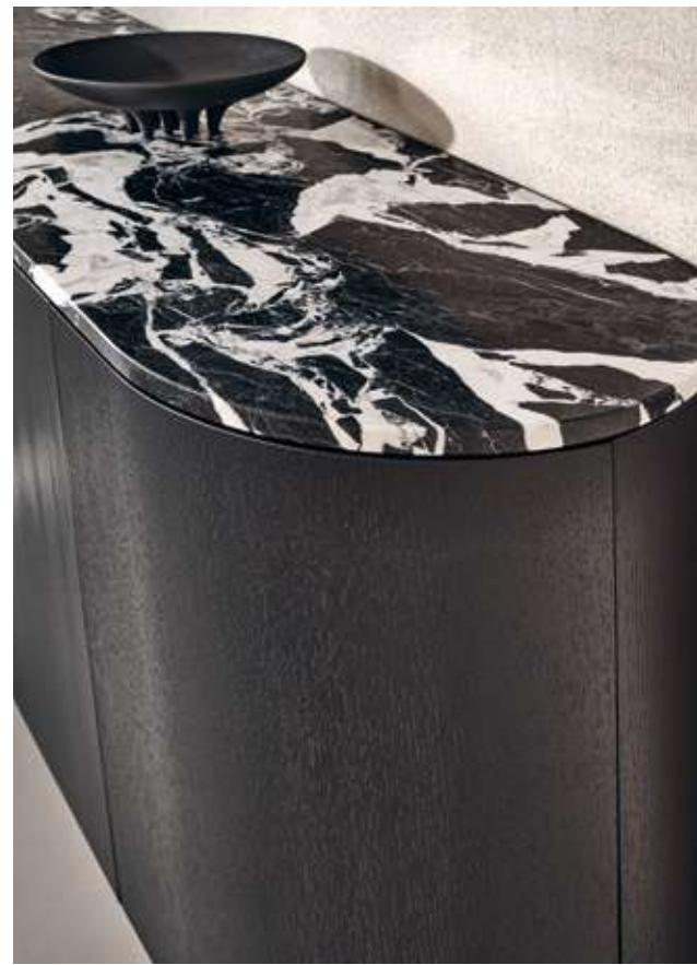
Flow Madia con struttura e base in legno frassino nero assoluto e top in marmo Nero antico. Lagoon Complemento con specchio argento, specchio fumè e vetro cotto fumè.