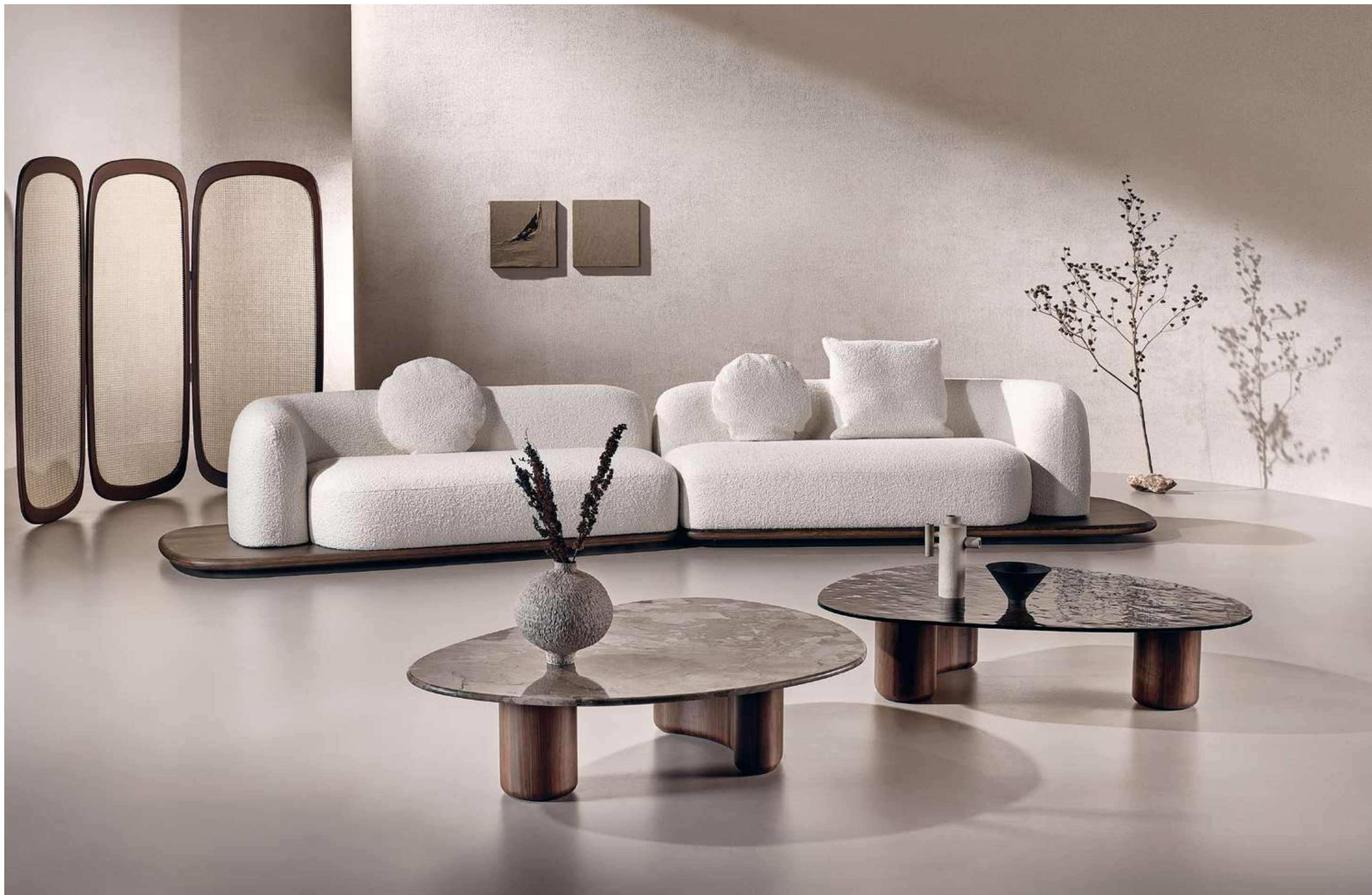
Dune Divano, Sofa; Lake Tavolini, Coffee Tables; Cloud Complento, Complement.