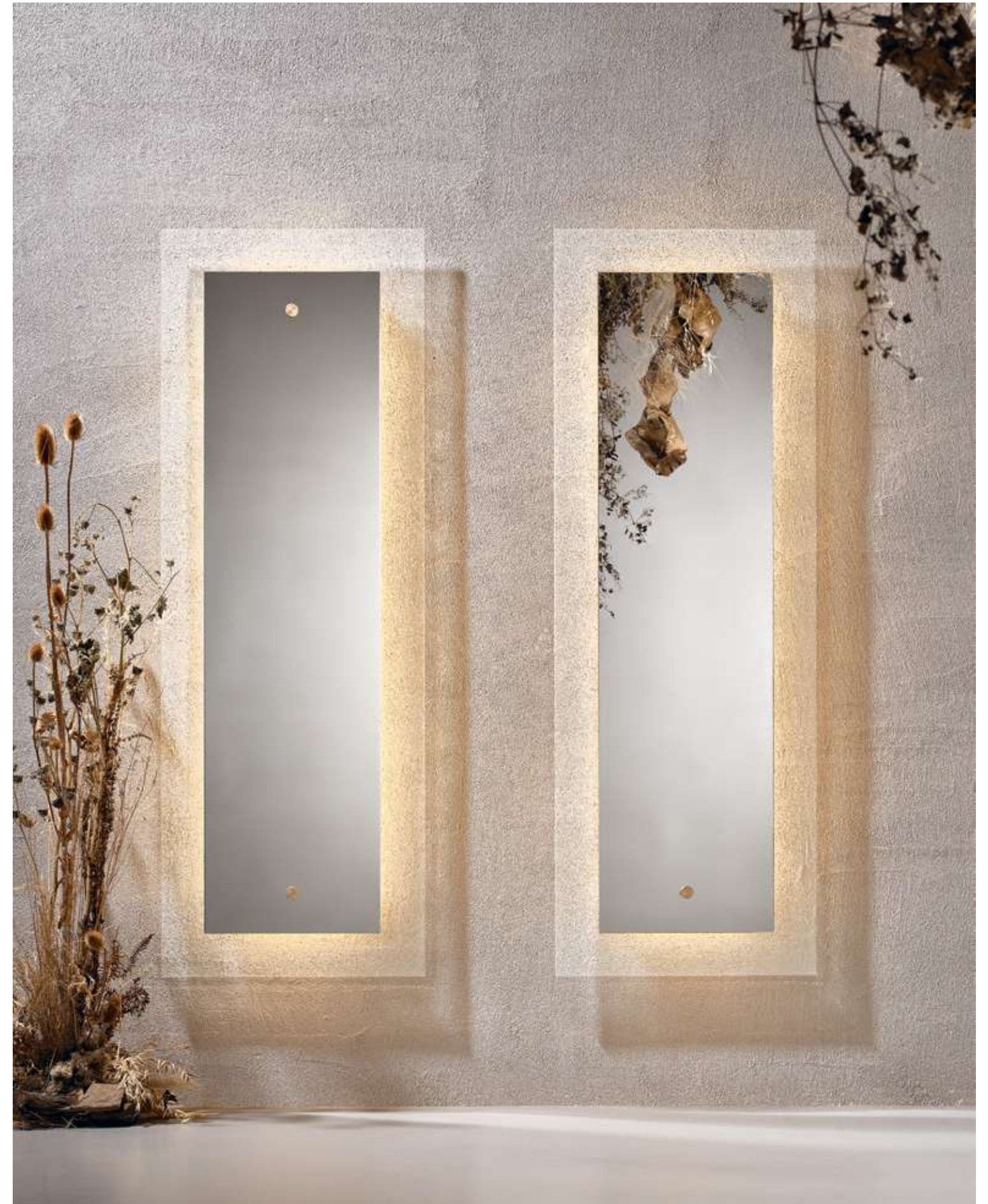
EN Eclipse Complement with mirror and extra-clear cast glass.