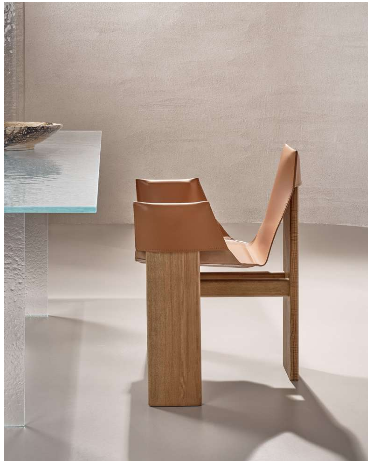
EN Manta Low Seating with caramel ash wood base and cognac leather.