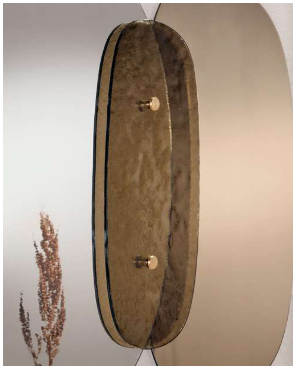
Lagoon Complemento con specchio argento, specchio bronzo e vetro cotto bronzo.