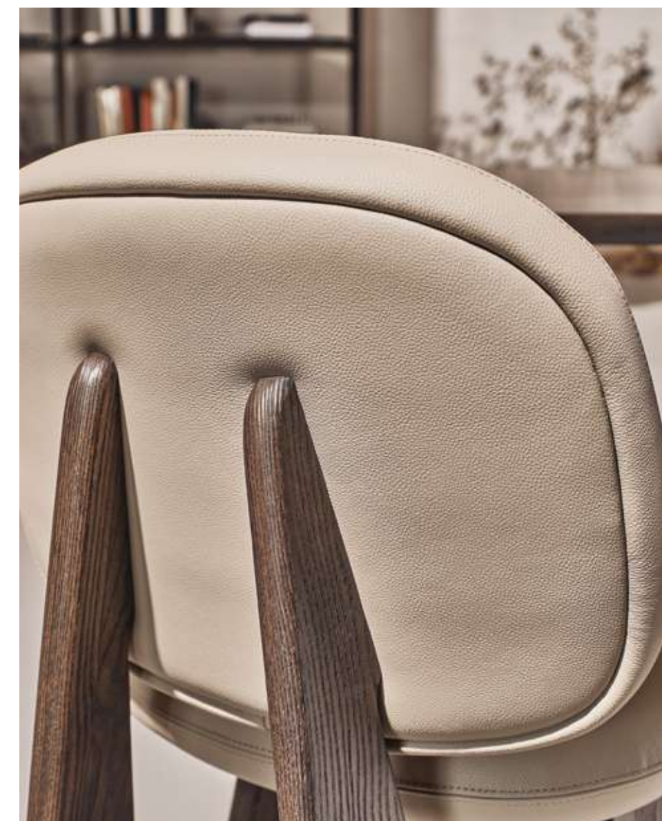
Twig Seduta con struttura in legno frassino moka e pelle PL03.