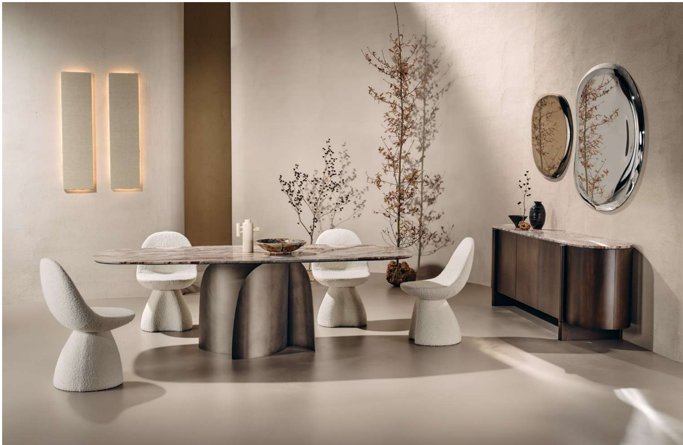
Bloom Tavolo, Table ; Nest Seduta, Seating ; Dusk Madia, Sideboard ; Pangea Complemento, Complement .