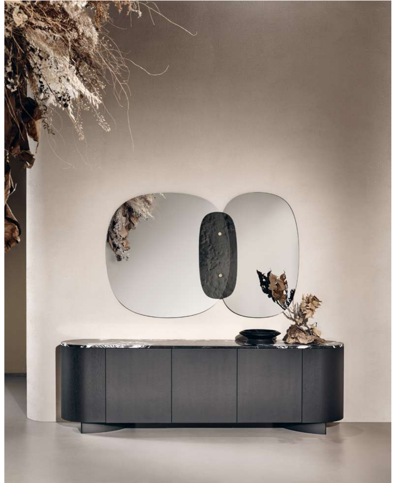
EN Flow Sideboard with absolute black ash wood structure and base and Nero antico marble top. Lagoon Complement with silver mirror, smoked mirror and smoked cast glass.