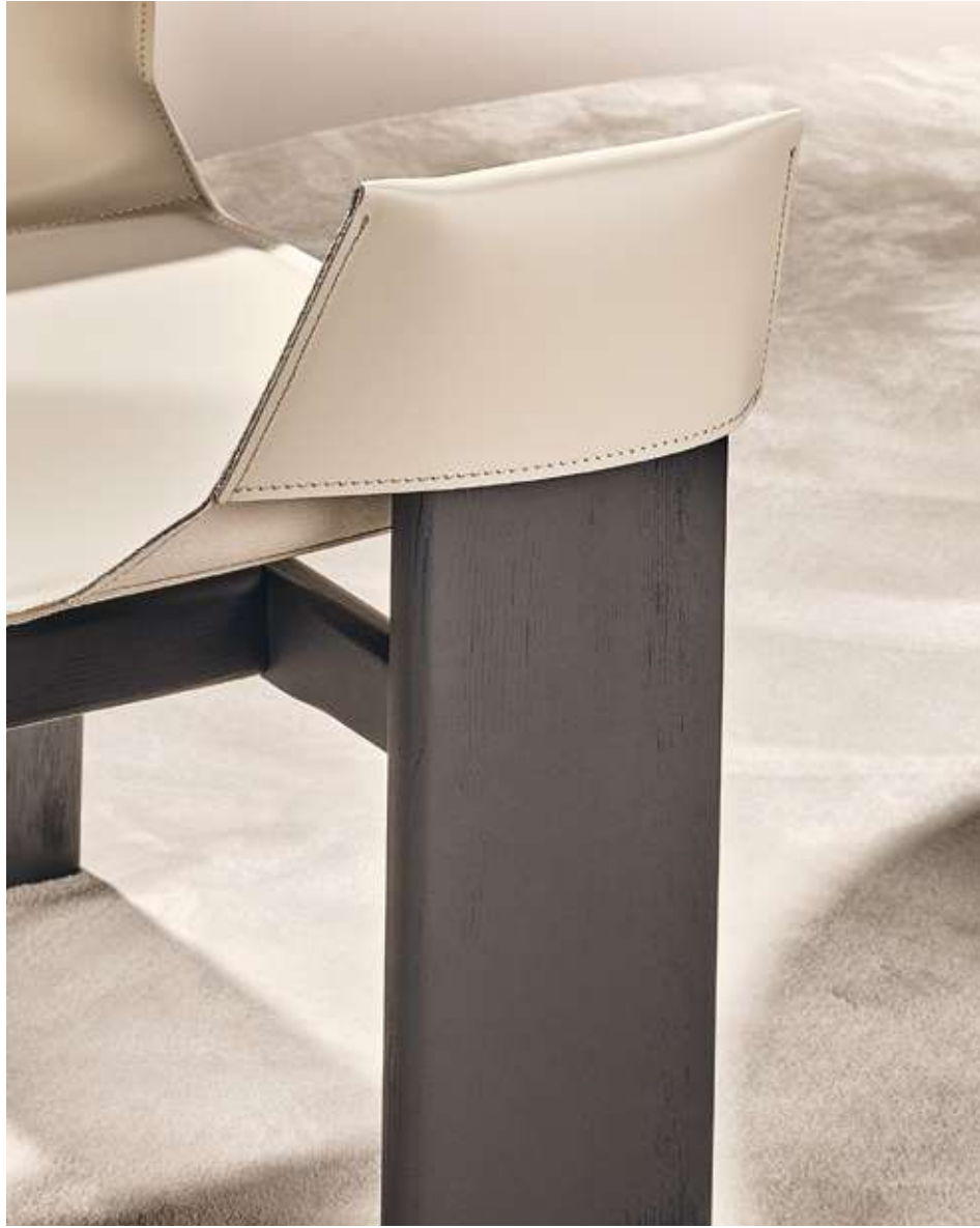
Manta Seduta con base in legno frassino nero assoluto e cuoio beige.