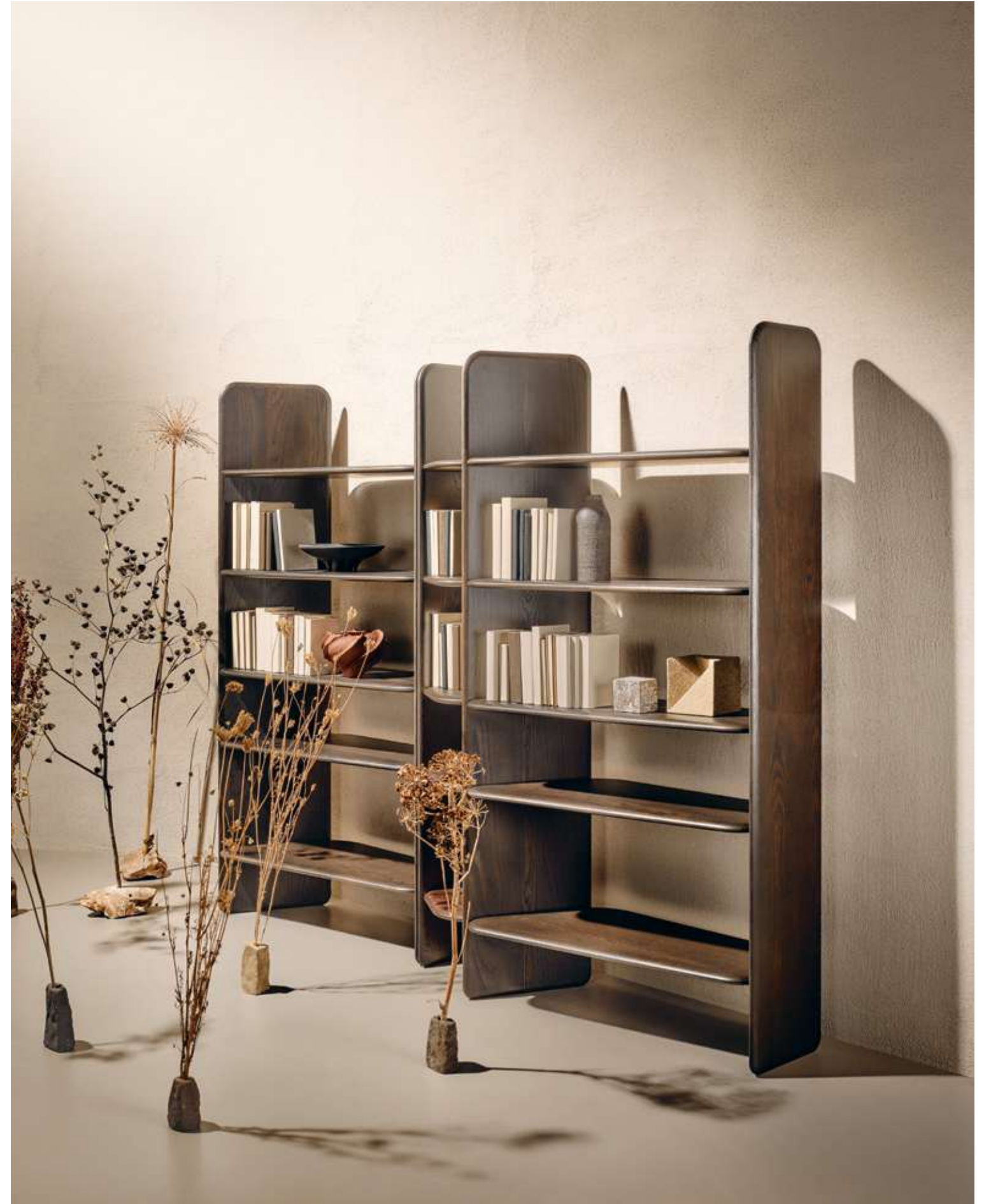
EN Nook Bookshelf in moka ash wood.