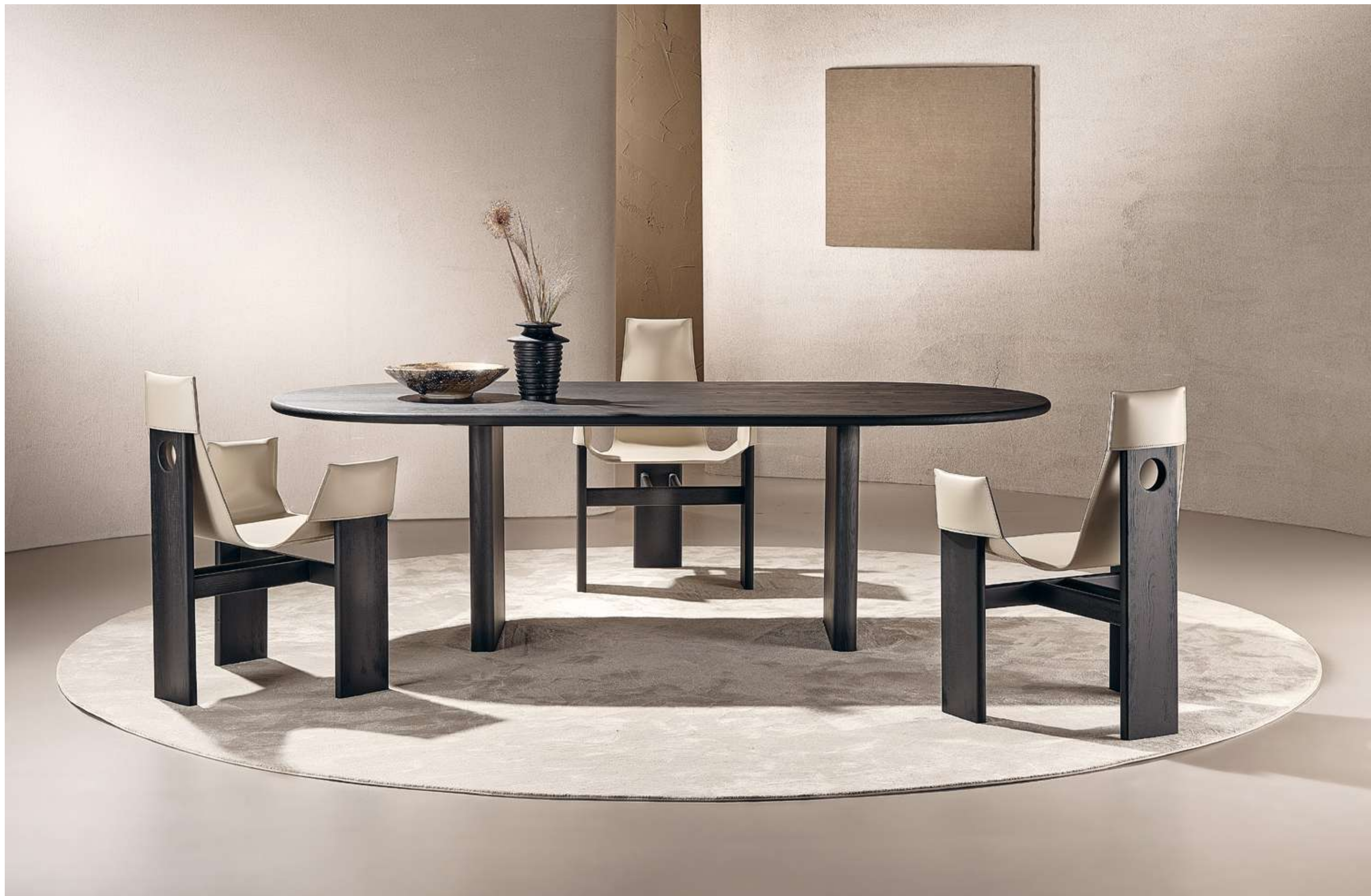
Monolith Tavolo, Table ; Manta Seduta, Seating .