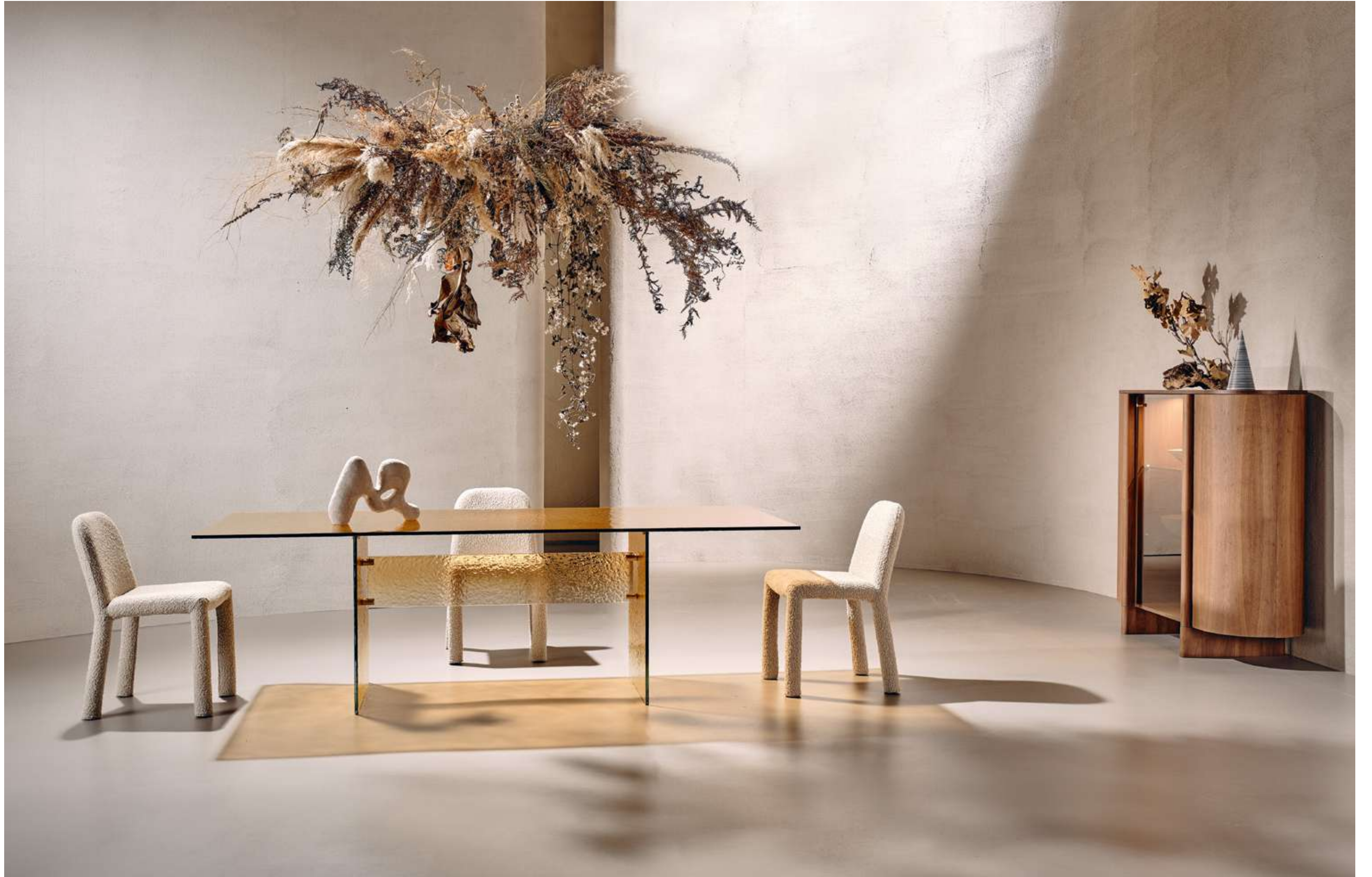
Waterfall Tavolo, Table ; Origin Seduta, Seating ; Dusk contromobile Madia, Sideboard .