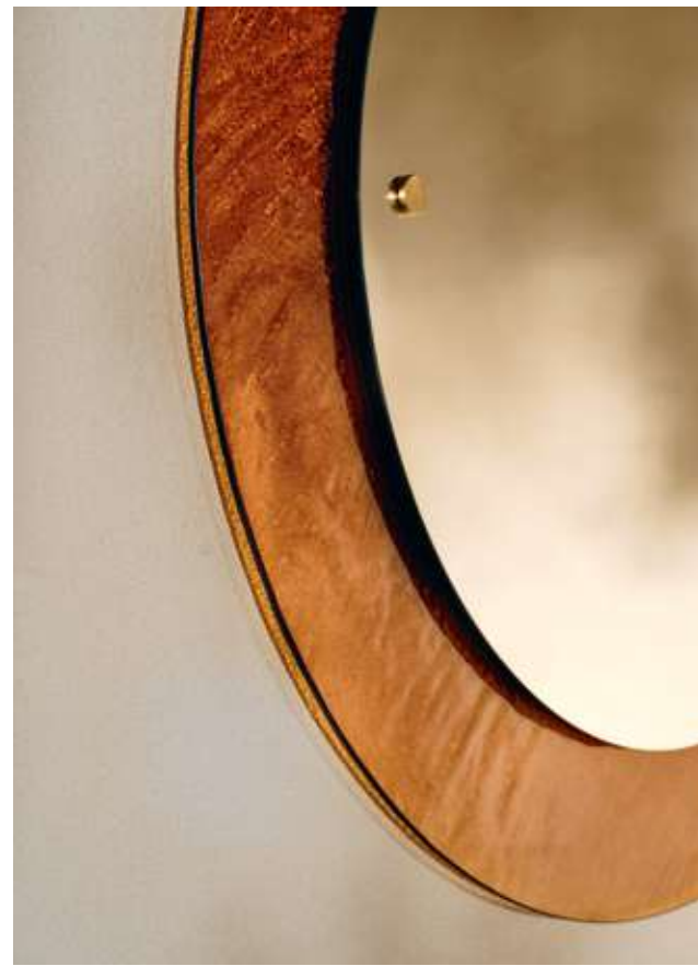
Eclipse Complemento con specchio e vetro cotto ambra.