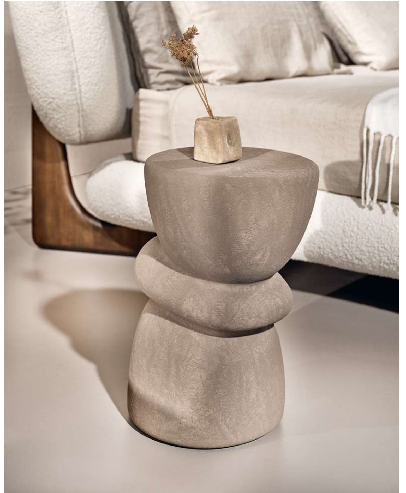
EN Ovoo Coffee Table in mud ceramic.