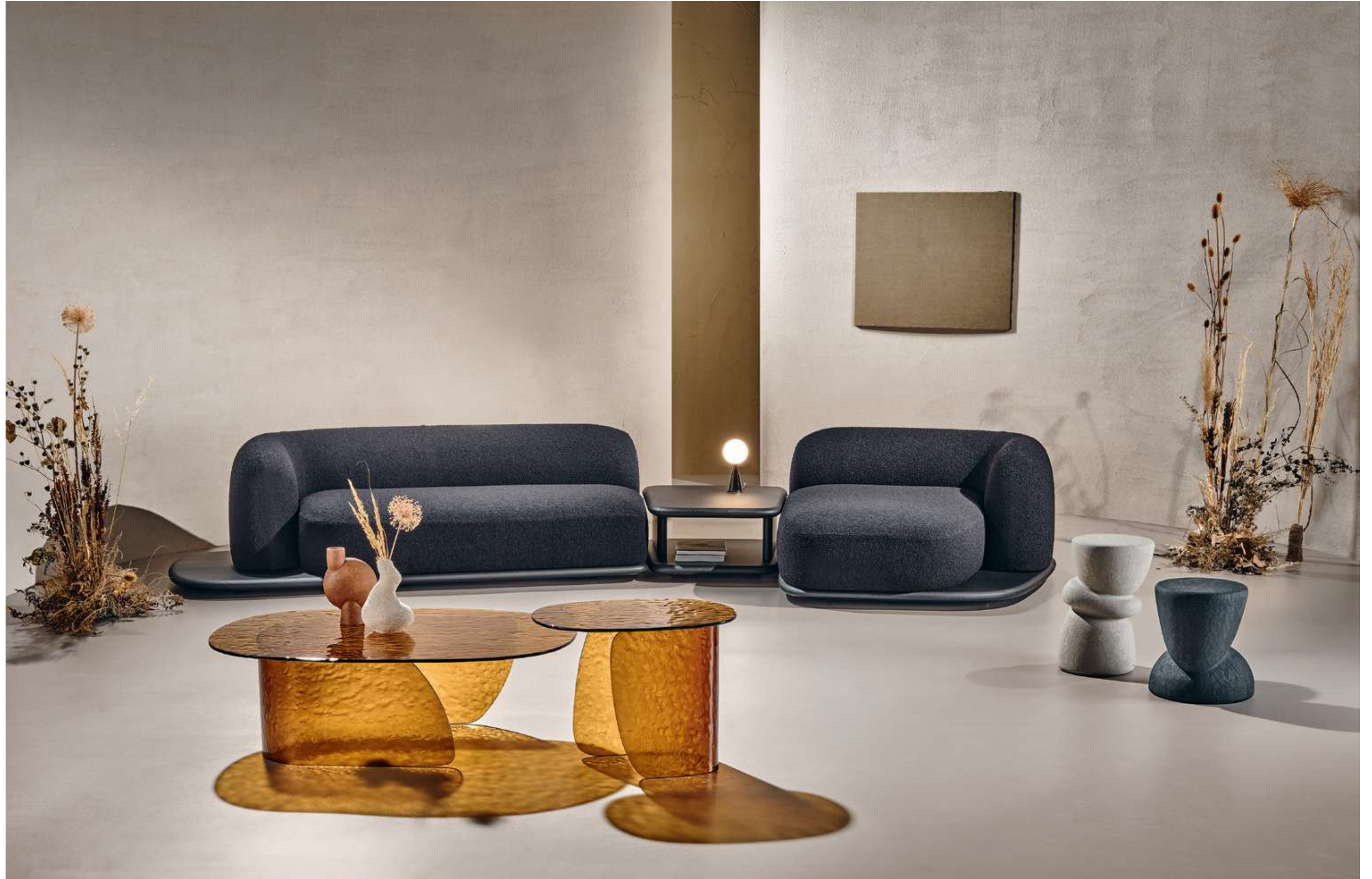
Dune Divano, Sofa; Blur Coffee Table Tavolino, Coffee Table; Ovoo Tavolino, Coffee Table.